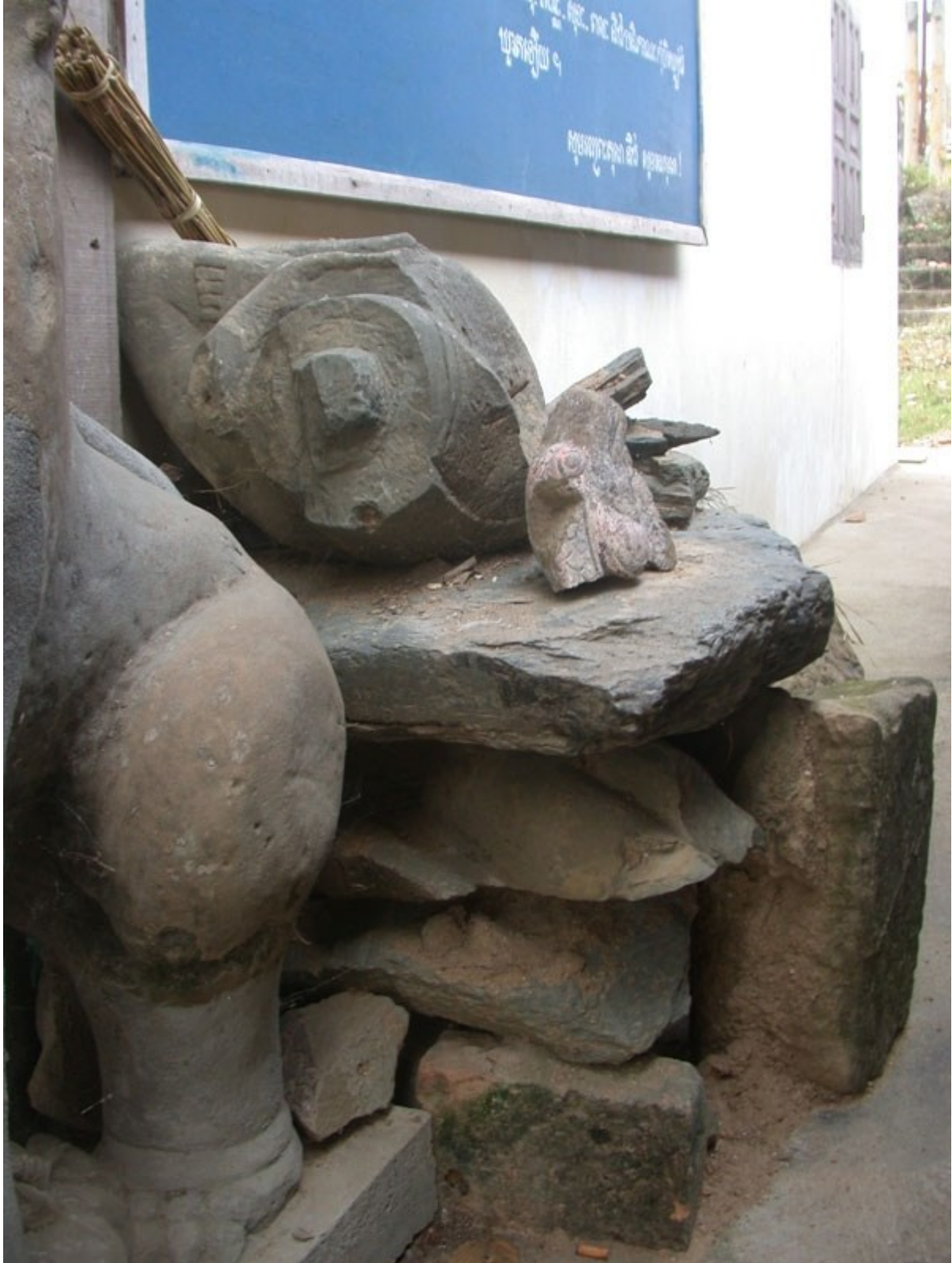
សំណល់បុរាណវត្ថុនៅវត្តព្រះធាតុ