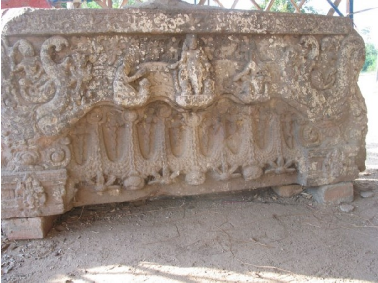
ផ្នែកនៅវត្តព្រះធាតុ