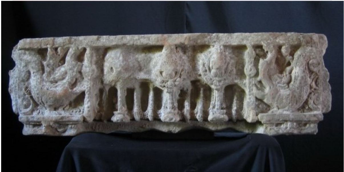
ផ្នែកនៅវត្តព្រះធាតុ