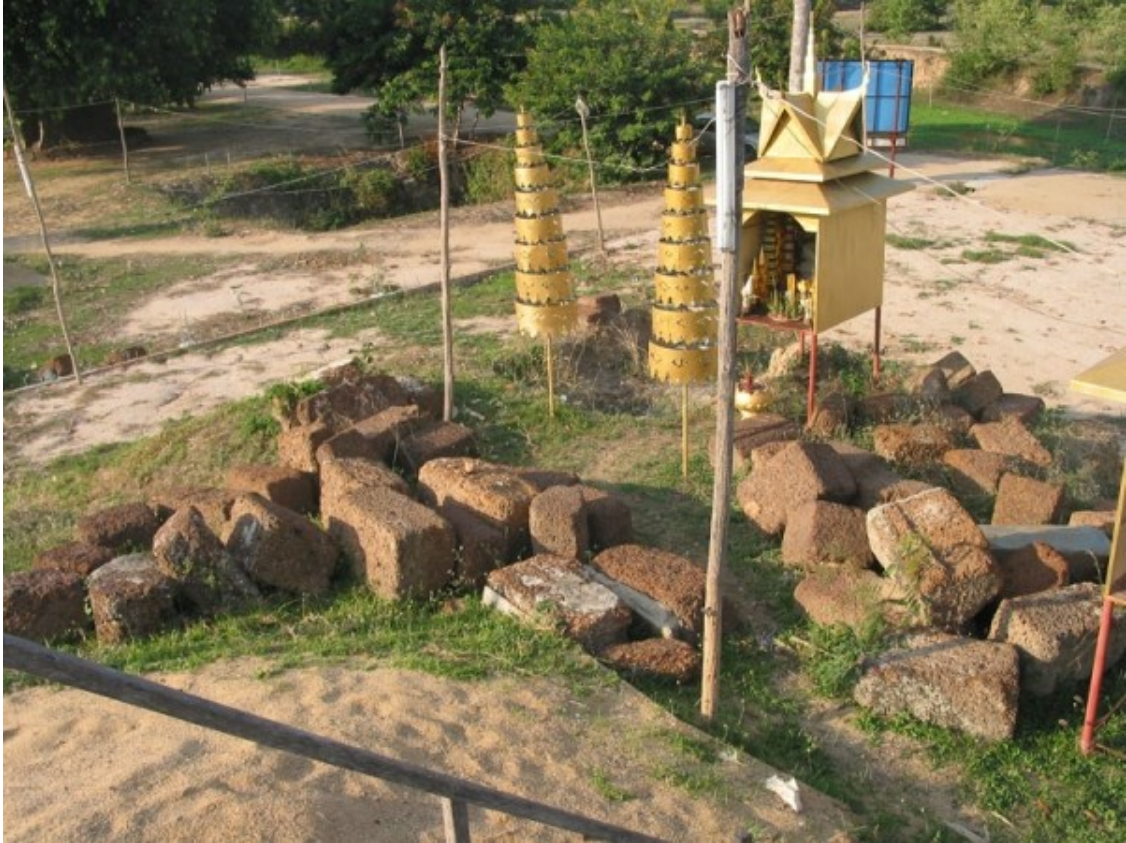
សំណល់បុរាណវត្ថុនៅវត្តព្រះធាតុ