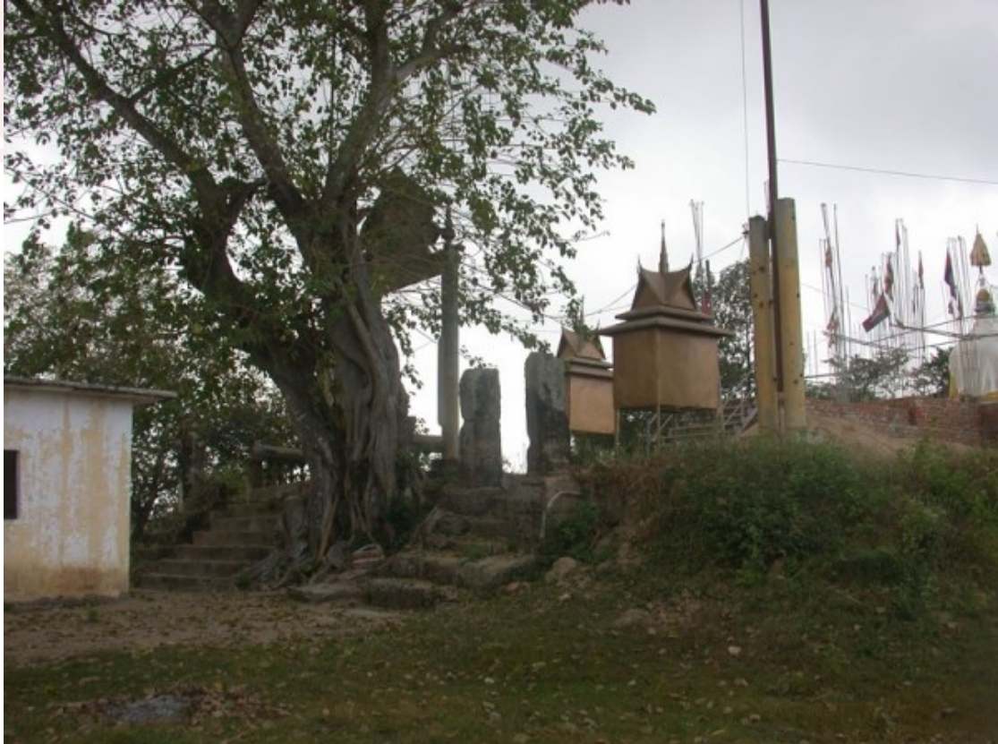
សំណល់បុរាណវត្ថុនៅវត្តព្រះធាតុ