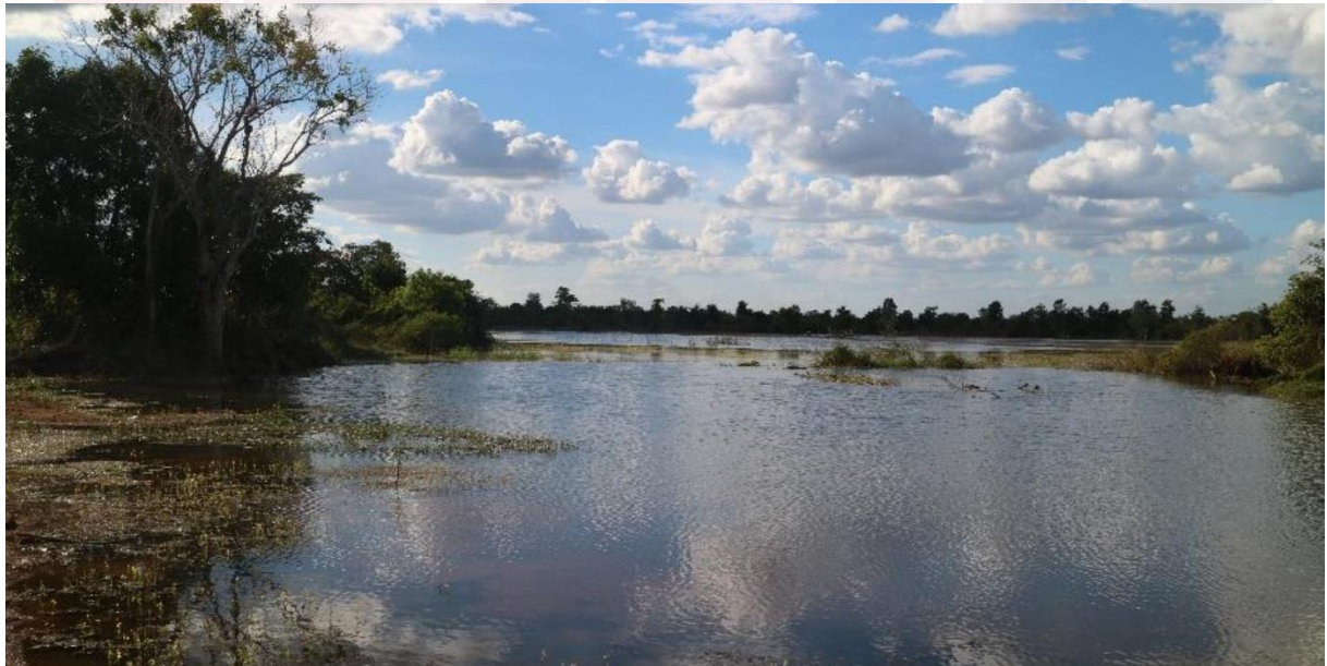
ប្រាសាទបន្ទាយព្រាវមើលពីលើអាកាស