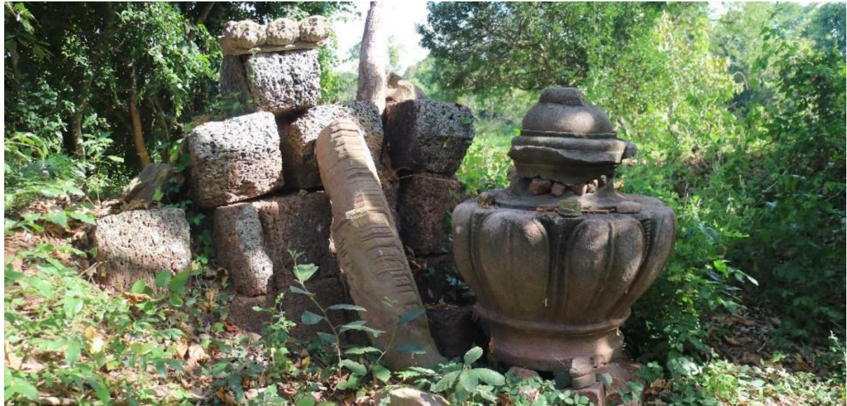
វត្តសិល្បៈជាគ្រឿងលម្អប្រាសាទ