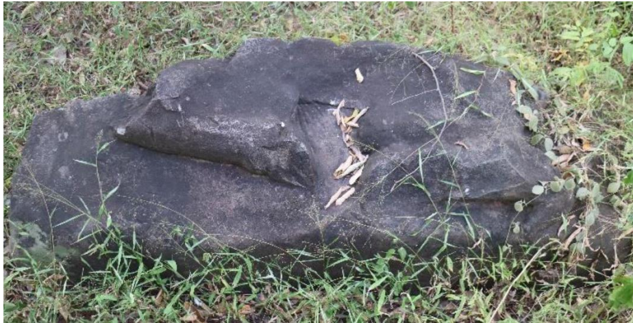
បំណែកគោនន្ទី