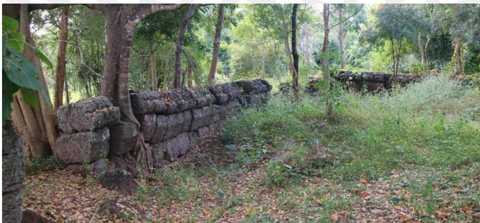
កំពែងថ្មបាយក្រៀមខាងក្នុង