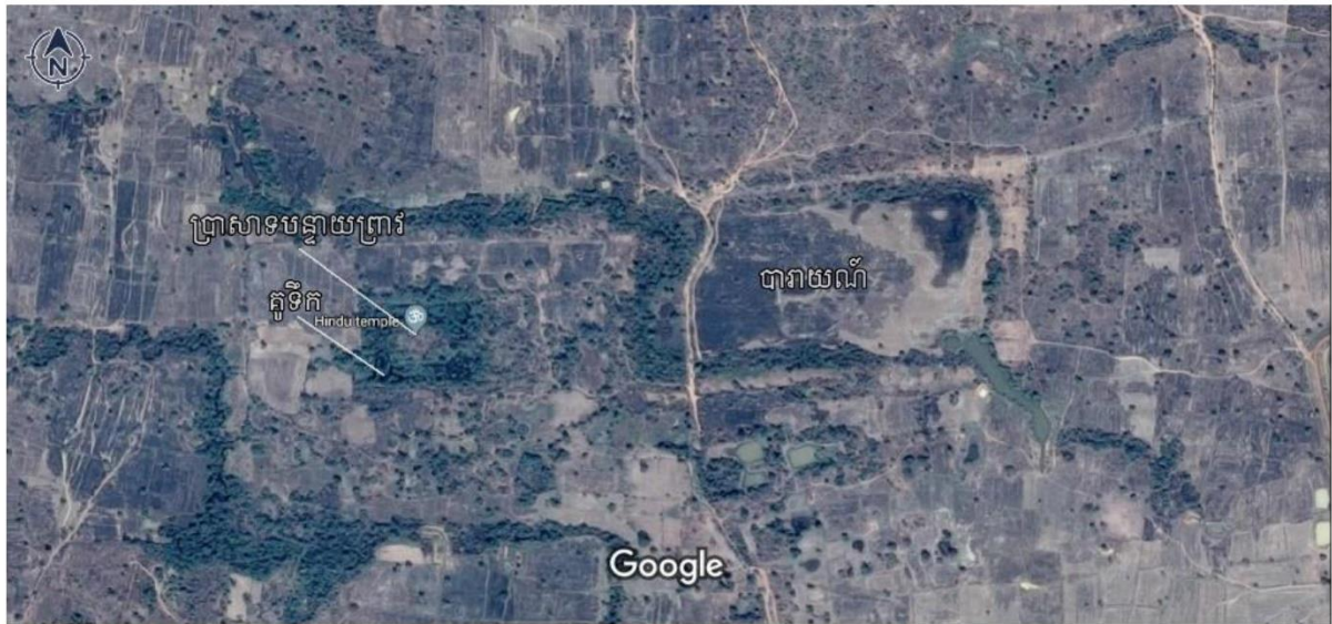
100 m