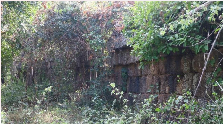
កំពែងថ្មបាយក្រៀមខាងក្រៅ