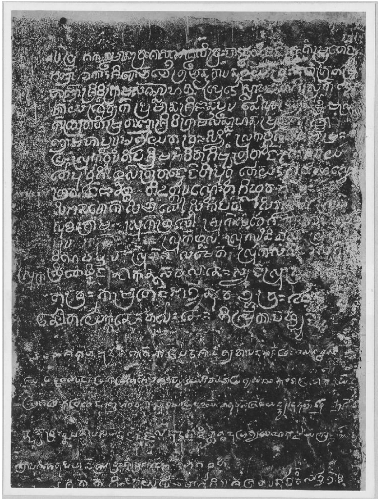
សំណៅផ្តិតសិលាចារឹកវត្តមៀន