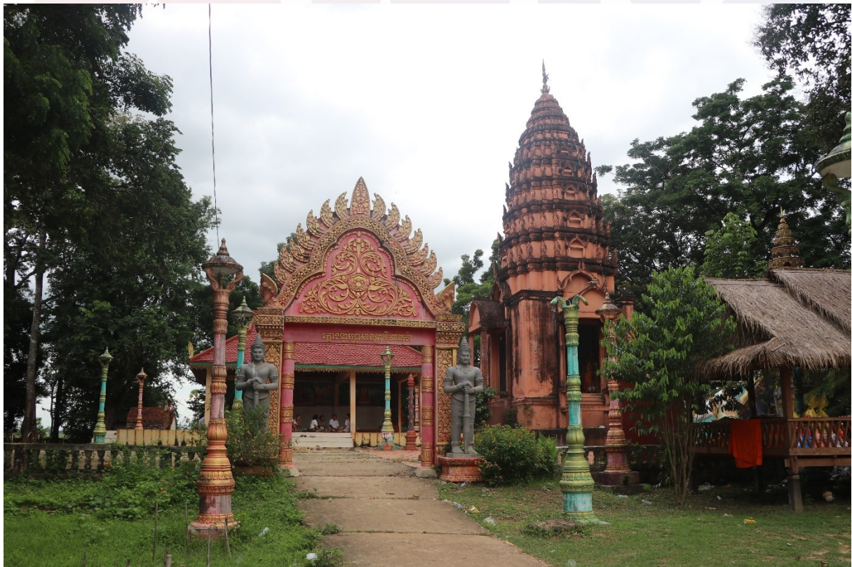
ប្រាសាទព្រះវិហារគុហ៍ ទីតម្កល់សិលាចារឹកវត្តមៀន