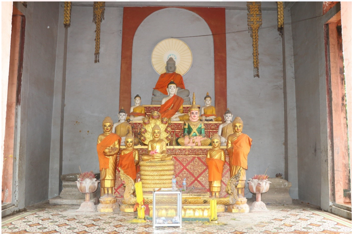
បរិវេណខាងក្នុងប្រាសាទព្រះវិហារគុហ៍ ទីតម្កល់សិលាចារឹកវត្តមៀន