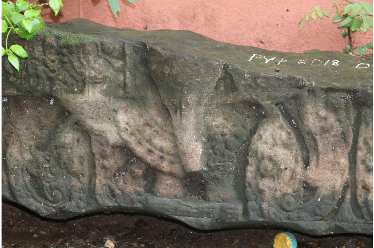
សំណល់ផ្នែកប្រាសាទ