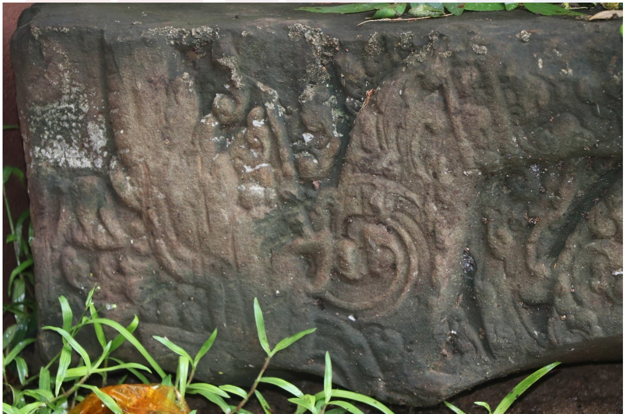
សំណល់ផ្នែកប្រាសាទ