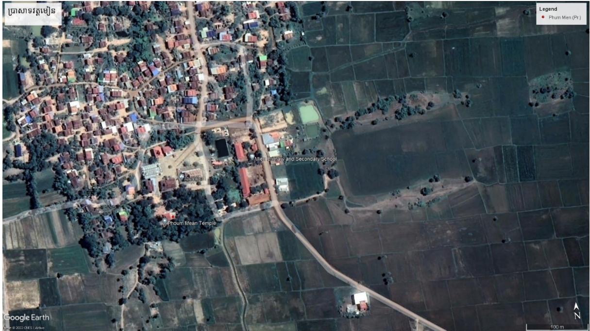
ផែនទីវត្តមៀន