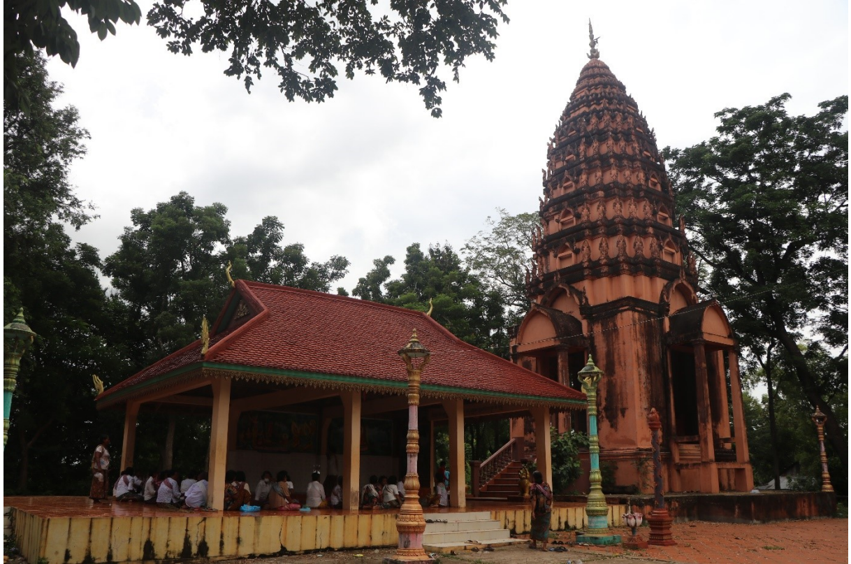
អ្នកស្រុកមកសូត្រធម៌ជារៀងរាល់ថ្ងៃ អំឡុងពេលចូលវស្សា