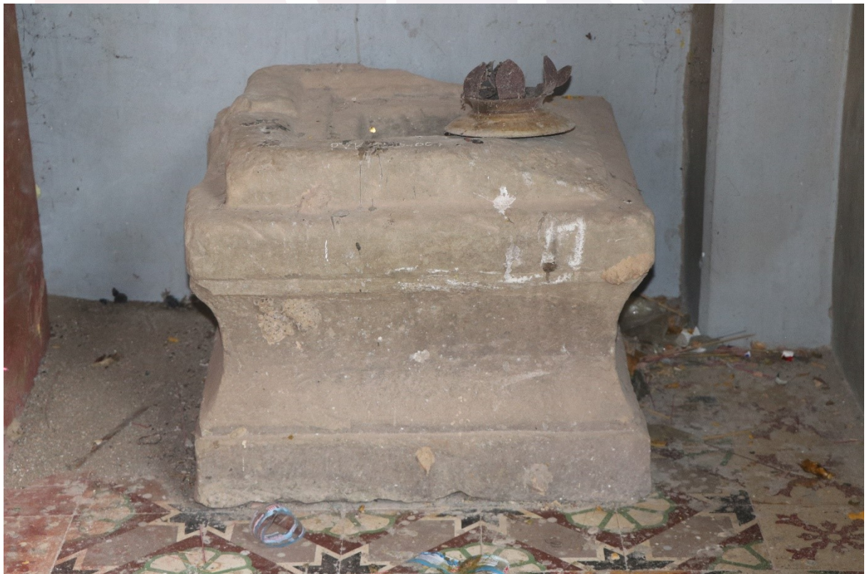
ជើងទម្រសាងពីថ្មភក់