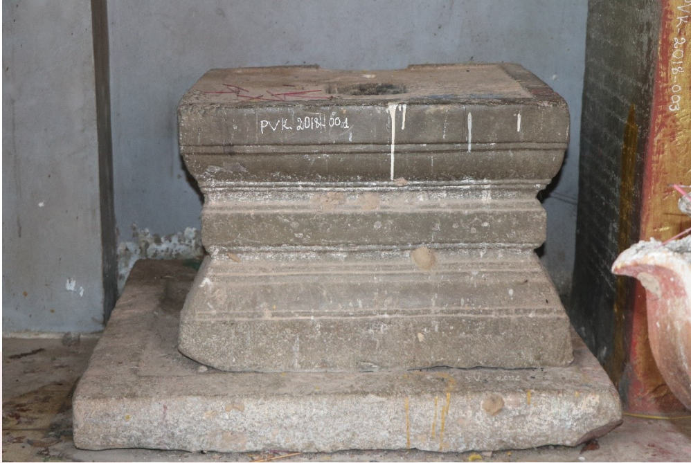
ជើងទម្រង់បន្ទះស្នាព្រាទី