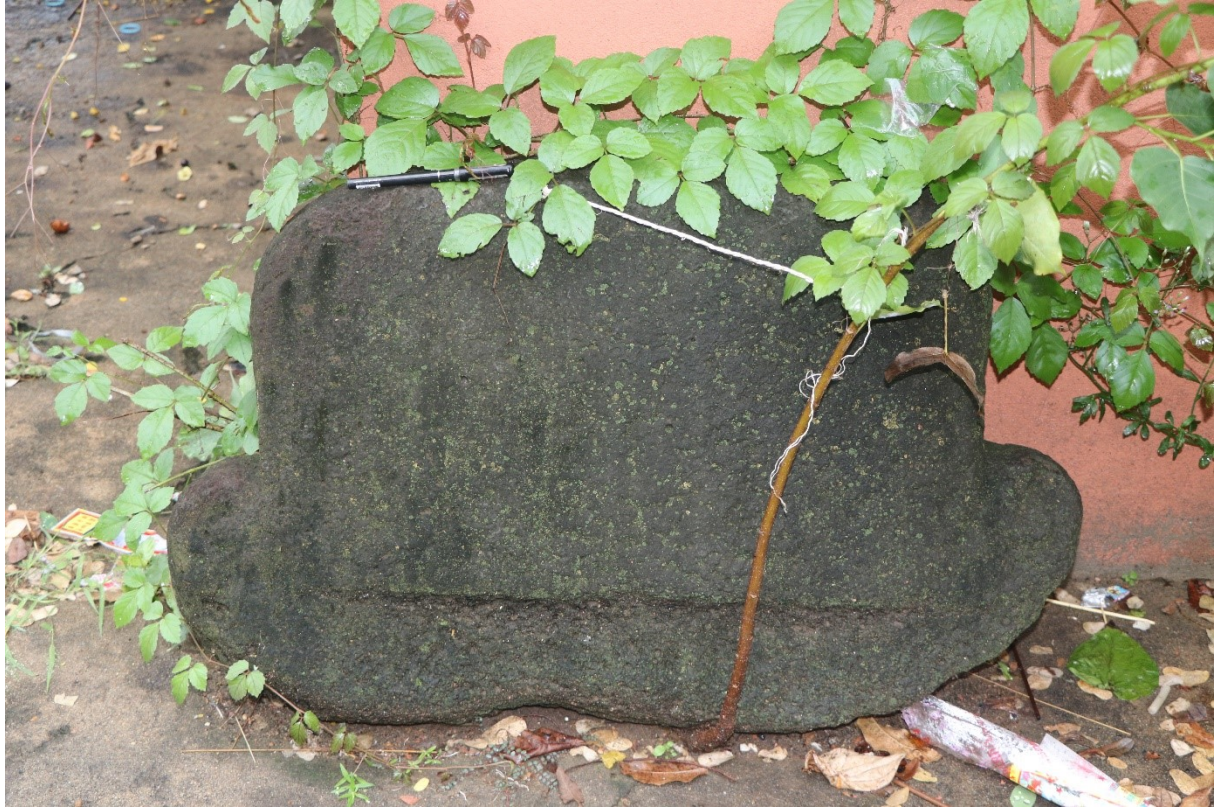
ថ្មទ្រនាប់ជណ្តើរសាងពីថ្មបាសាល់