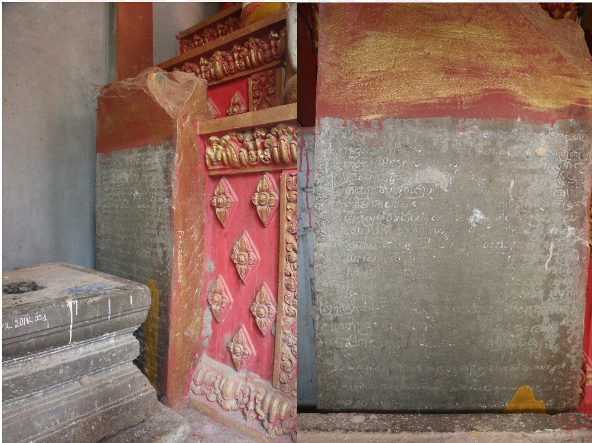
សិលាចារឹកវត្តមៀន