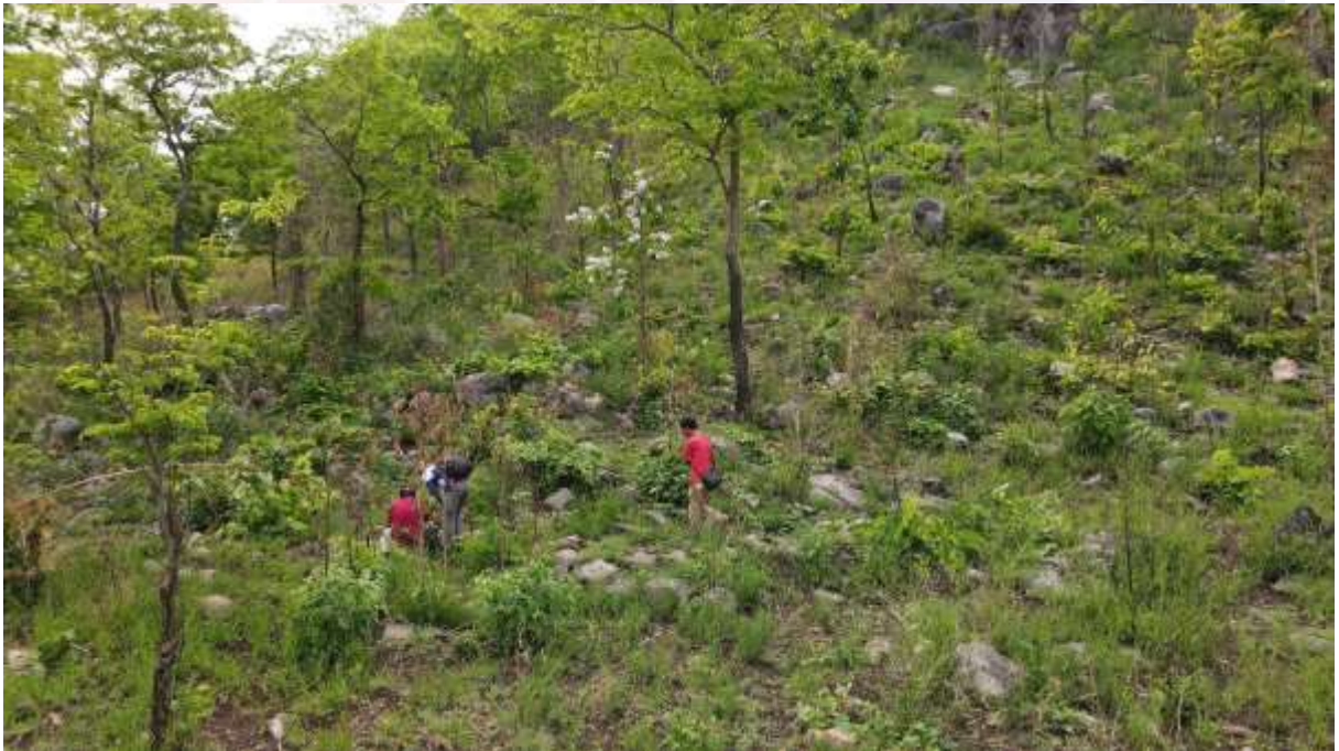
រូបលេខ២ សកម្មភាពពិនិត្យ