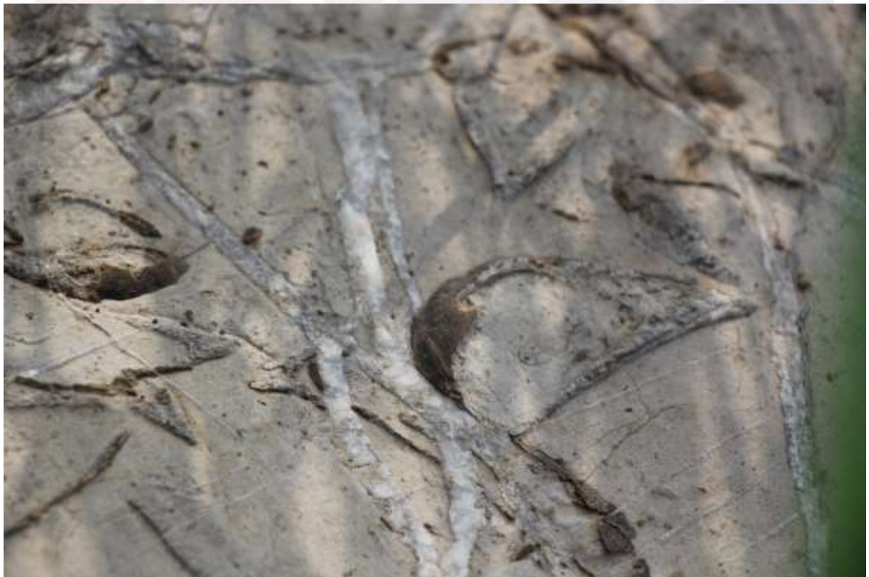
រូបលេខ១០ សំណាកធុស៊ីល?