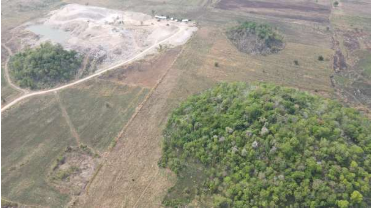
រូបលេខ១ ភ្នំចង្រ្កានយក្ស