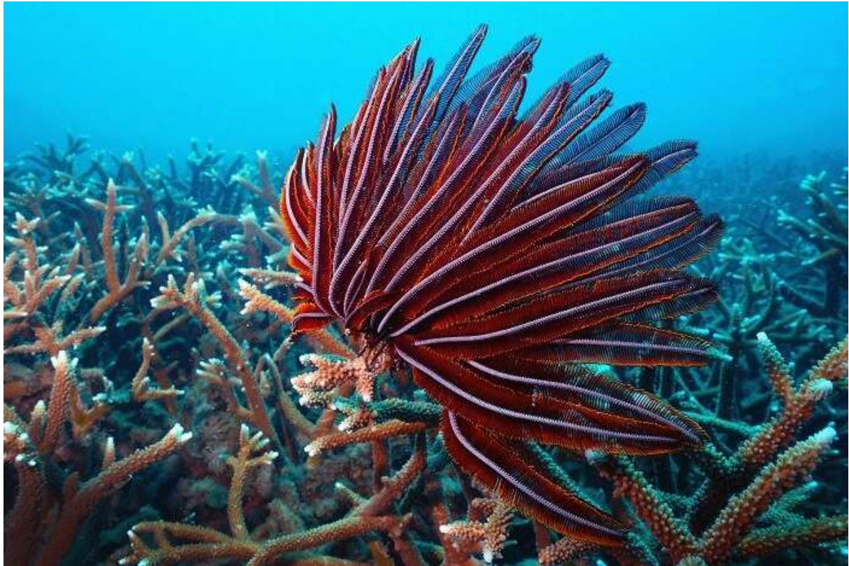
រូបលេខ៥ រូបលេខ៦