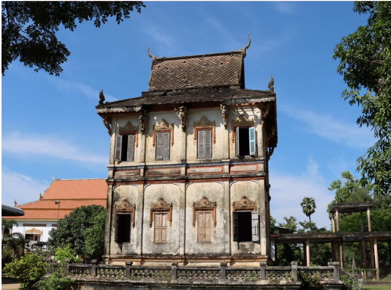
រូបលេខ៤ ធម្មមន្ទីរវត្តត្នោតជុំ, សង់ឆ្នាំ១៩៣៣ (កំពង់ធំ)

១.ហោត្រ័យ៖ គឺជាអគារដ៏មានសារៈសំខាន់បំផុត សម្រាប់បម្រើឱ្យវិស័យសិក្សានៅតាមវត្តអារាម ទន្ទឹមនឹងសាលាពុទ្ធិកសិក្សា។ អ្នកខ្លះហៅសំណង់នេះថាបណ្ណាល័យ ឬខ្លះទៀតហៅថាធម្មមន្ទីរ ឬធម្មត្រ័យ ដែលទុកជាអគារសម្រាប់តម្កល់ឯកសារសំខាន់ៗផ្សេងៗដូជា គម្ពីរ ក្បួន ច្បាប់ សាស្ត្រា ហើយជាពិសេសគឺតម្កល់ព្រះត្រៃបិដកសម្រាប់ព្រះសង្ឃសិក្សារៀនសូត្រ។ ៧ ជាទូទៅគេច្រើនសង់ហោត្រ័យនៅក្បែរនឹងសាលាពុទ្ធិកសិក្សា ហើយគេអាចសង់តាមទម្រង់សំណង់បុរាណ ឬទំនើបតាមការនិយម (រូបលេខ៤-៧)។ មិនតែប៉ុណ្ណោះនៅតាមវត្តខ្លះ គេតែងតម្កល់ទុករបស់មានតម្លៃជាសម្បត្តិរួមរបស់សហគមន៍នៅក្នុងហោត្រ័យដែរ។