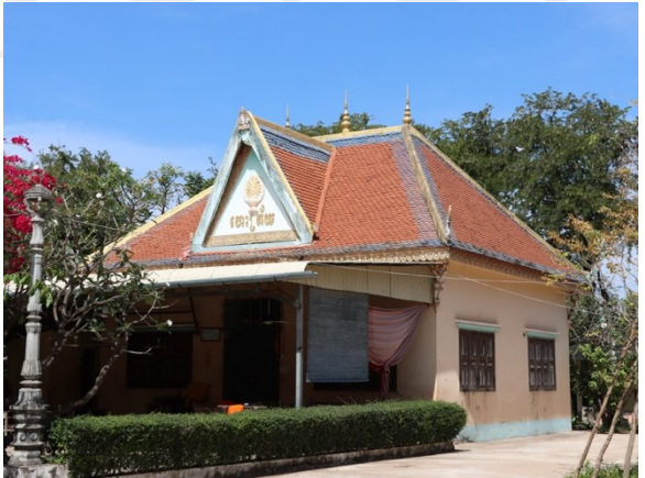
រូបលេខ៧ ហោត្រ័យវត្តព្រះនាង (កំពង់ធំ)