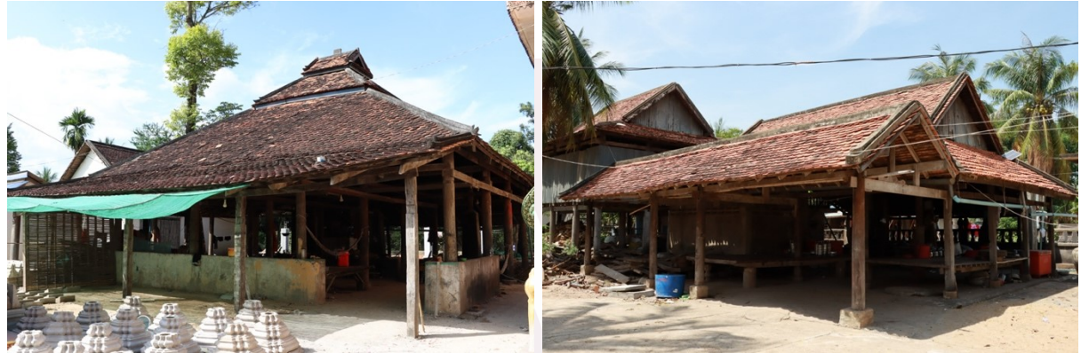
រូបលេខ២១-២២ រោងចម្អិនចង្កាន់ព្រះសង្ឃនៅវត្តកោះតូច និងវត្តព្រះប្រសប់ (កណ្តាល)

ច.សំណង់ផ្សេងៗ៖ ក្រៅពីសំណង់សំខាន់ៗដូចរៀបរាប់ខាងលើ នៅតាមវត្តខ្លះគេ ឃើញមានសំណង់ផ្សេងៗទៀតកសាងតម្រូវតាមការចាំបាច់ក្នុងវត្ត តែពោរពេញដោយ ទឹកដៃសិល្បៈគួរឱ្យកោតសរសើរ។ រូបលេខ២១-២២ គឺជារោងសម្រាប់ព្រះសង្ឃចម្អិន ចង្កាន់(រោងបាយ)នៅវត្តកោះតូច និងវត្តព្រះប្រសប់។ ជាទូទៅគេសង់រោងនេះទាបជាប់ដី នៅក្បែរសាលាធាន់ ហើយធ្វើឱ្យស្រឡះ និងមានខ្យល់ចេញចូលល្អ។ អ្វីគួរឱ្យកត់សម្គាល់ រោងបែបនេះច្រើនធ្វើដំបូលតាមបែបផ្សេងៗ អាស្រ័យតាមចំណូលចិត្តអ្នកស្រុក។