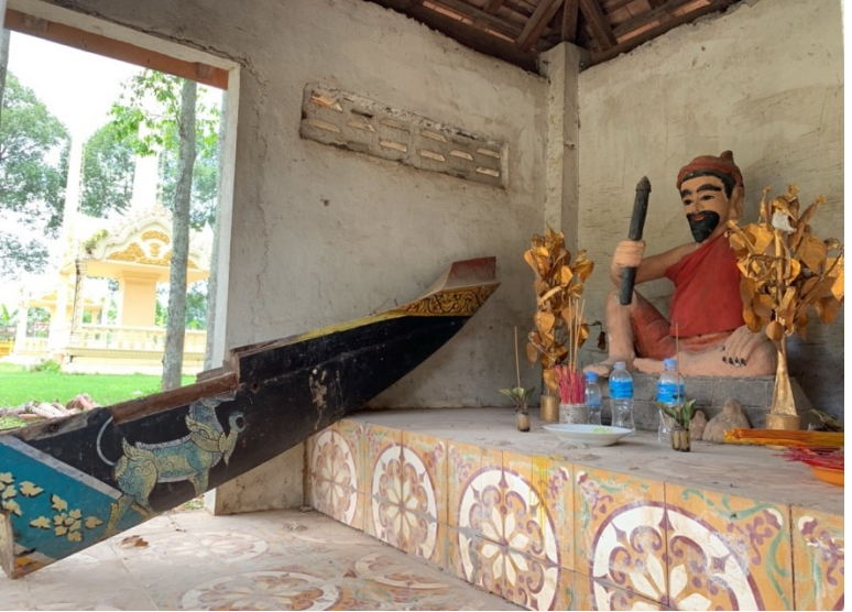
រូបលេខ១៩ ថ្វាយចេកក្បាលទូកក្នុងថ្ងៃបុណ្យវត្តស្វាយអណ្តែត (កណ្តាល)