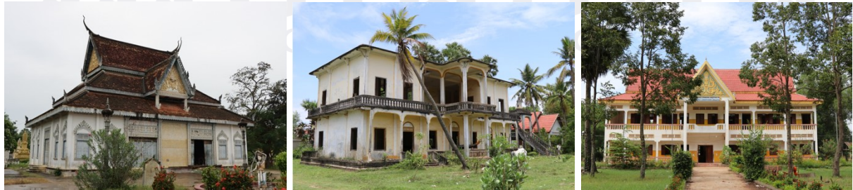
រូបលេខ១-៣ សាលាពុទ្ធិកសិក្សាវត្តសោមនស្ស (បាត់ដំបង), វត្តព្រះពន្លៃ និងវត្តវើល (ត្បូងឃ្មុំ)

ក.សាលាបាលី៖ គឺជាអគារសិក្សាចាំបាច់បំផុតនៅតាមវត្តរាម ដែលគេតែងហៅថា “ពុទ្ធិកសិក្សា”។ ជាទូទៅនៅក្នុងវត្តនីមួយៗ គេឃើញយ៉ាងហោចណាស់មានសាលាពុទ្ធិក បឋមសិក្សា សម្រាប់បើកបង្រៀនដល់ព្រះសង្ឃដែលបួសគង់នៅក្នុងវត្តនោះ។ នៅតាម តំបន់ខ្លះគេហៅសាលានេះថា “សាលាធម្មវិន័យ” ឬខ្លះហៅថា “សាលាធម្មត្រៃ”។ ២ សំណង់ ទាំងនេះអាចសង់ពីឈើ ឬថ្ម អាស្រ័យតាមការនិយម និងធនធាន ហើយនៅតាមវត្តទូទៅ អាចមានពុទ្ធិកបឋមសិក្សា ពុទ្ធិកអនុវិទ្យាល័យ ឬពុទ្ធិកវិទ្យាល័យ អាស្រ័យតាមតម្រូវការ របស់ព្រះសង្ឃក្នុងវត្តសាមី និងវត្តជុំវិញ (រូបលេខ១-៣)។ ផុតពីកម្រិតនោះ ព្រះសង្ឃអាច និមន្តសិក្សាបន្តនៅពុទ្ធិកសាកលវិទ្យាល័យស្ថិតនៅតាមទីរួមខេត្ត ឬនៅរាជធានីភ្នំពេញ។