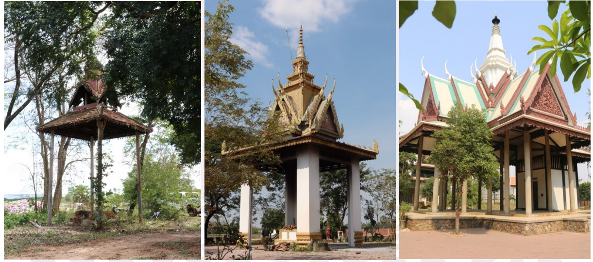
រូបលេខ៨-១០ ឈាបនដ្ឋាន ឬមេរុវត្តកំពង់ត្រឡាចលើ (កំពង់ឆ្នាំង) វត្តចក និងវត្តដំណាក់ (សៀមរាប)

គ.ឈាបនដ្ឋាន ឬមេរុះ គឺជាកន្លែងសម្រាប់បូជាសព ដែលគេអាចកសាងនៅក្នុង បរិវេណវត្ត ឬទីទំនេរណាមួយក្នុងទិសឦសាន (រូបលេខ៨-១០)។ សំណង់នេះ ខ្លះហៅថា “ប៉ាតា” ឬហៅរត់មាត់ថា “បច្ឆា” ក៏មាន។ ប៉ុន្តែបើគេសង់ក្នុងពិធីបូជាសពនៅតាមជនបទ ជាពិសេសនៅតំបន់អង្គរគេហៅថា “ភ្នំយោង” ហើយគេក៏តែងសង់រំកិលទៅទិសឦសាន នៃរោងបុណ្យដែរ ដ្បិតទិសនេះជាទិសពាក់ព័ន្ធនឹងជំនឿកើត និងស្លាប់។ ៤ រីឯឈាបនដ្ឋាន ឬមេរុះនៅតាមវត្ត គេសម្គាល់ឃើញធ្វើរាងជាមេរុមុខដាច់ ដែលមានដំបូលត្រួតត្រា បែរទៅ ទិសទាំងបួន មានកំពូលស្រួចទៅលើ។ ចំពោះខ្លឹមសារនៃឈាបនដ្ឋានឬមេរុះនេះ ក៏មាន ន័យដូចចេតិយដែរ ពោលគឺជាជានិមិត្តរូបនៃភ្នំព្រះសុមេរុ ដែលជាស្ថានទេពស្ថានឬស្ថាន ខ្ពង់ខ្ពស់ ជាទីប្រាថ្នាឱ្យអ្នកស្លាប់បានទៅចាប់កំណើត។