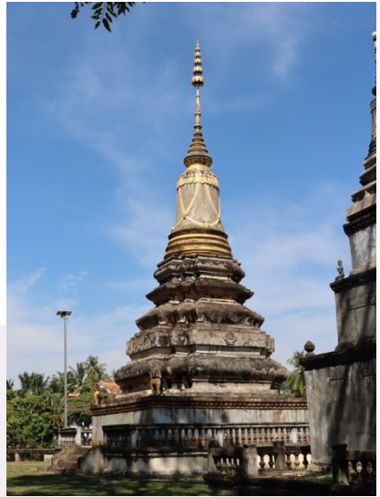
រូបលេខ១១ ព្រះសក្យមុនីចេតិយ វត្តបុទុម (កំពង់ធំ)