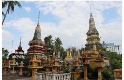
រូបលេខ១៤-១៦ ទម្រង់ផ្សេងៗនៃចេតិយនៅវត្តអង្គរខាងជើង (សៀមរាប) វត្តក្តាំជ័រ (បាត់ដំបង) និងវត្តសិលានទី (ក្រចេះ)