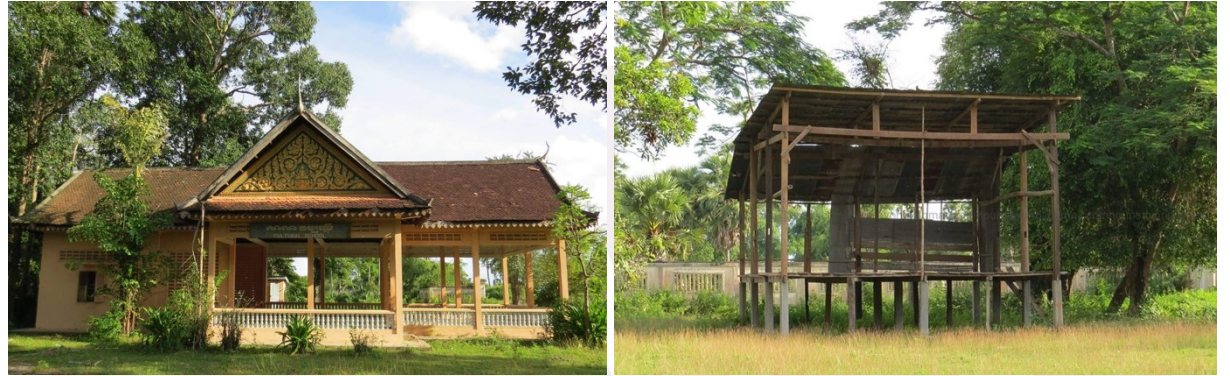
រូបលេខ២៦-២៧ រោងសិល្បៈនៅវត្តប្រម៉ា (សៀមរាប)

រូបលេខ២៦-២៧ គឺជាអគារសម្រាប់ហាត់រៀន និងសម្តែងសិល្បៈនៅវត្តប្រម៉ា ស្ថិតក្នុងខេត្តសៀមរាប។ សំណង់បែបនេះ គេច្រើនសង់នៅជីវិតដែលទំនេរ តែឃ្នាតពីវត្តបន្តិចដើម្បីងាយស្រួលសម្រាប់ហាត់រៀនសិល្បៈផ្សេងៗដូចជា ក្មេង រាំ ឬល្ខោនជាដើម។ សូមកុំភ្លេចថា មកដល់សព្វថ្ងៃមានសិល្បៈបុរាណតាមសហគមន៍មួយចំនួនបានរស់រានឡើងវិញដោយការយកចិត្តទុកដាក់ពីសំណាក់វត្តអារាមដូចជា ស្បែកធំវត្តរាជបូព៌ (សៀមរាប) និងយីកេភូមិនីពេជ្រ (កំពង់ធំ) ជាដើម។