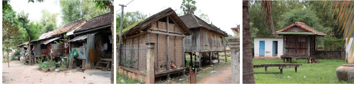
រូបលេខ២៣ តូបដូនដី រូបលេខ២៤-២៥ ជង្រ្តកស្រូវនៅវត្តស្ទឹង និងវត្តសាមគ្គីរតនារាម

រូបលេខ២៣ ជាតូបដូនដីនៅវត្តបុទុម ក្នុងខេត្តកំពង់ធំ។ ជាទូទៅ គេច្រើនសង់តូប សម្រាប់ដូនដីស្នាក់នៅមើលថែវត្ត ឬសម្រាប់ដូនដី-តាដី អញ្ជើញមកស្នាក់អាស្រ័យរក្សា សីលរាល់ខែ ឬពេលមានបុណ្យទាន។ ចំណែកឯរូបលេខ២៤-២៦ គឺជាជង្រ្តកស្រូវនៅវត្ត ស្ទឹង ខេត្តបាត់ដំបង និងជង្រ្តកស្រូវនៅវត្តសាមគ្គីរតនារាម នៅខេត្តតាកែវ។ មកដល់ត្រង់ នេះសូមបញ្ជាក់ថា ដើមឡើយវត្តនៅតាមជនបទភាគច្រើនតែងមានស្រែជុំវិញវត្ត ហើយ រាល់ខែមាយាមគេច្រើនធ្វើបុណ្យដារលានពូនភ្នំស្រូវប្រគេនព្រះសង្ឃ។ នៅតាមវត្តខ្លះ តែង បរិច្ចាគស្រូវមួយភាគទៅដល់អ្នកក្រខ្យត់ផងក៏មាន។