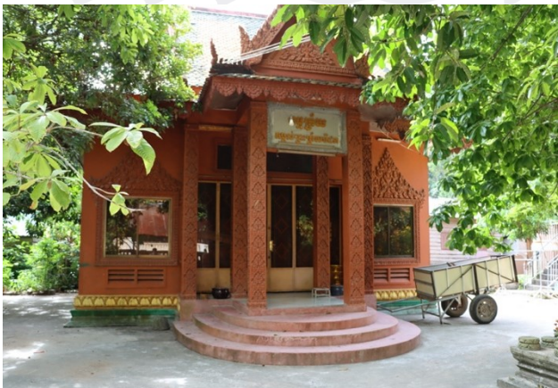
រូបលេខ៦ ធម្មត្រ័យវត្តអង្គរខាងត្បូង (សៀមរាប)