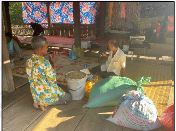
រូបលេខ៣ និង៤៖ ប្រជាជនយកស្រូវមកចូលបុណ្យ