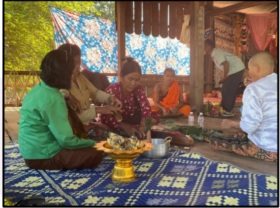
រូបលេខ១ និង២៖ សកម្មភាពរៀបចំគ្រឿងរណ្តាប់ផ្សេងៗ