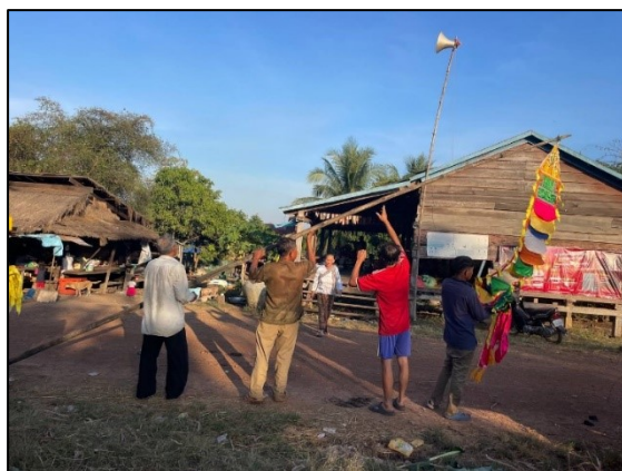
រូបលេខ៥ និង៦៖ ប្រជាជនលើកទង់មុខសាលាធាន