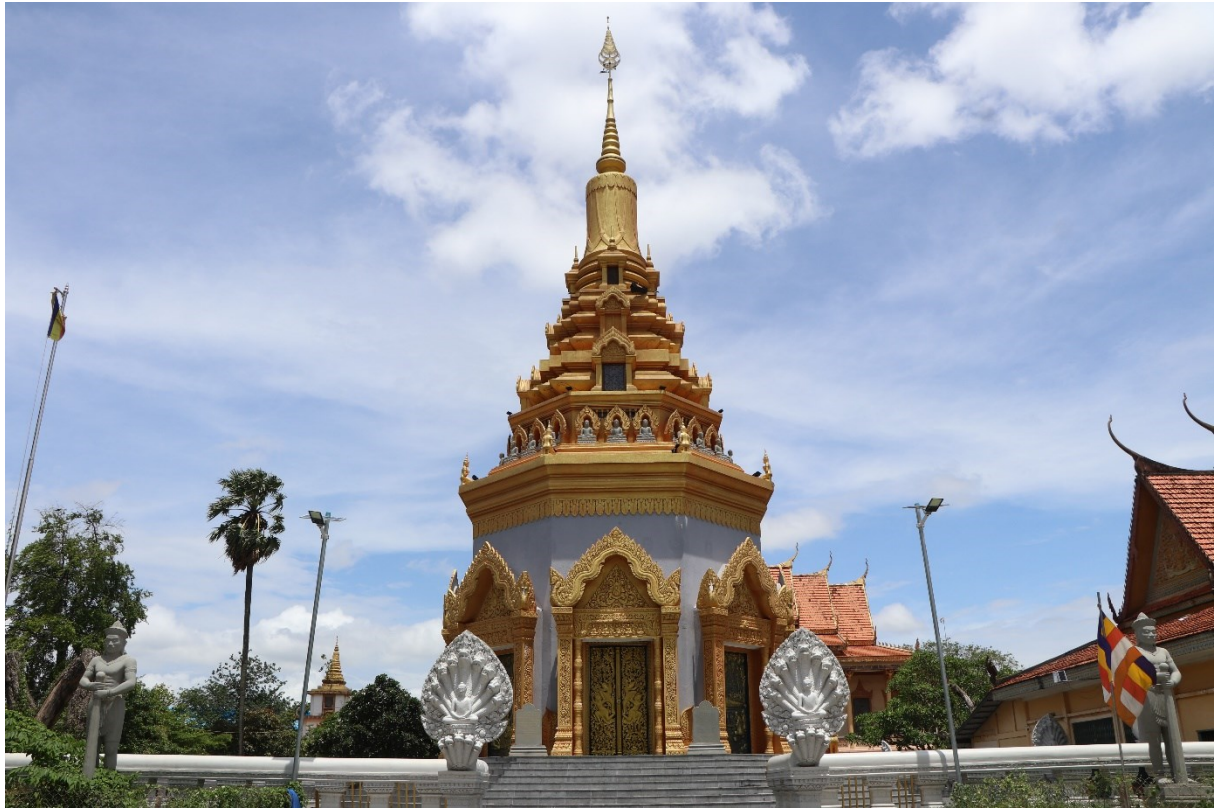
ព្រះសុគន្ធកុដិវត្តសំបូរមាស មានតម្កល់សិលាចារឹកចម្លង (រូបថត៖ ហ៊ិន ឈុនតេង)