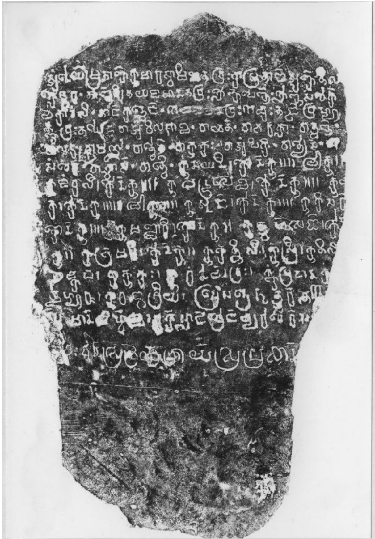
សំណៅផ្ដិតសិលាចារឹកភូមិសំបួរ K.៦៦៤