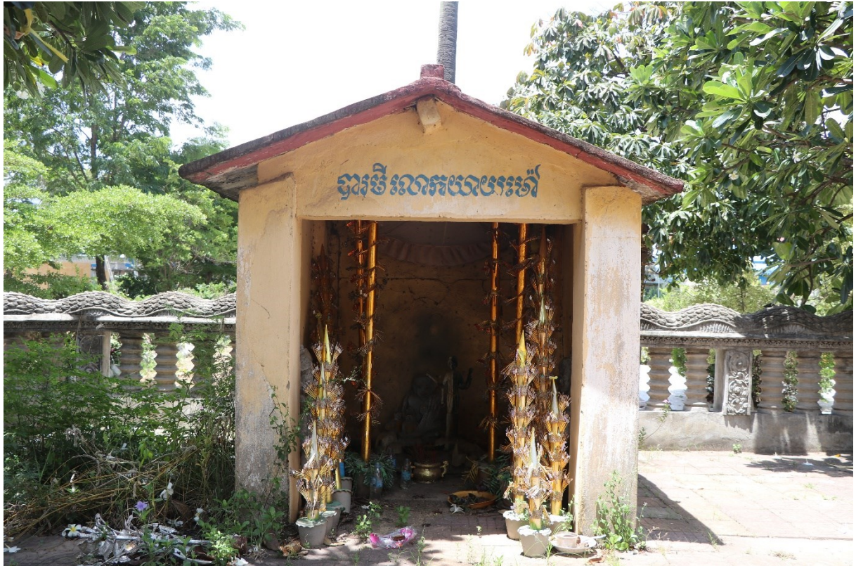
ខ្នងបារមីលោកយាយម៉ៅ ជាទីមានប្រស្រទាប់បីសន្លឹក