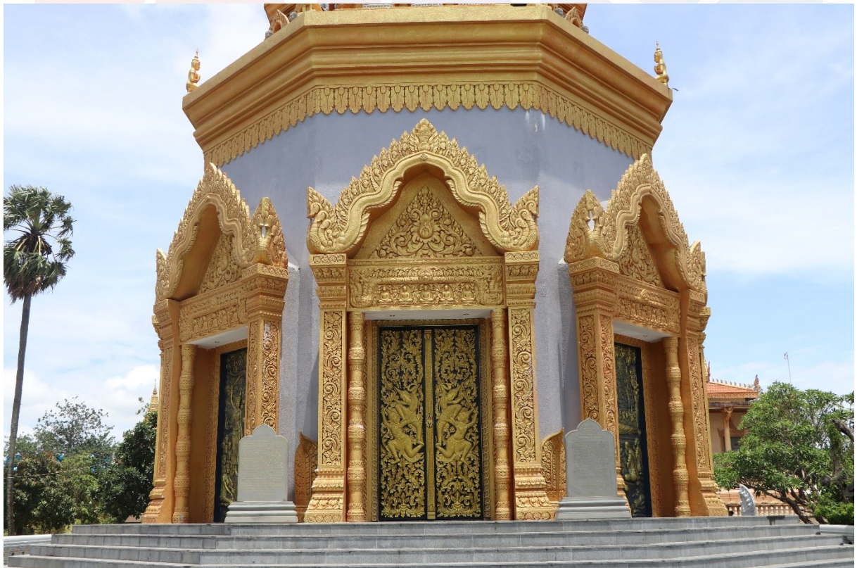
ព្រះសុគន្ធកុដិវត្តសំបូរមាស មានតម្កល់សិលាចារឹកចម្លង