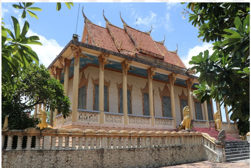
ព្រះវិហារវត្តសំបូរមាស