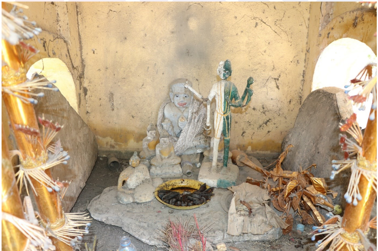
ប្រស្រទាប់ទាំងបីសន្លឹក មានមួយផ្ទាំងជាប្រទ្រទាប់ដណ្តើរព្រាសាទ