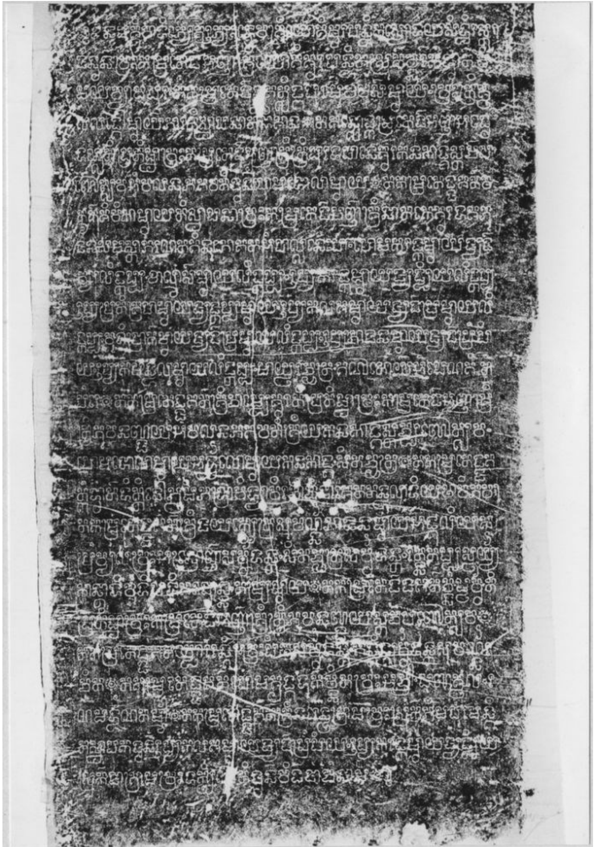
សំណៅផ្តិតសិលាចារឹកប្រាសាទតាកែវ K.២៧៦