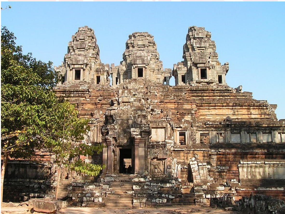
រូបថតប្រាសាទតាកែវ