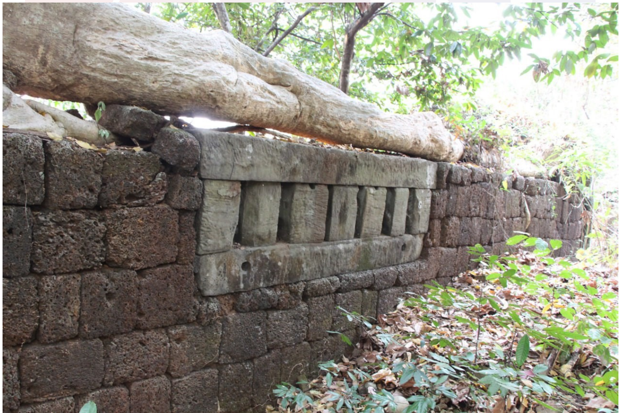
ទិដ្ឋភាពកំពែងថ្មបាយក្រៀមប្រាសាទភ្នំសណ្តក