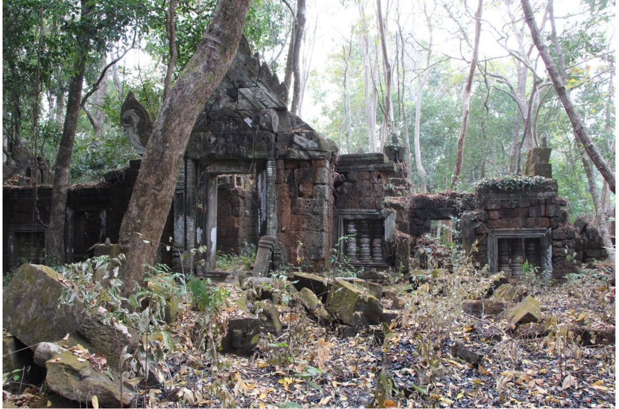
ទិដ្ឋភាពប្រាសាទភ្នំសណ្តក (ប្រភពរូប៖ ស៊ឹម នីឡា)