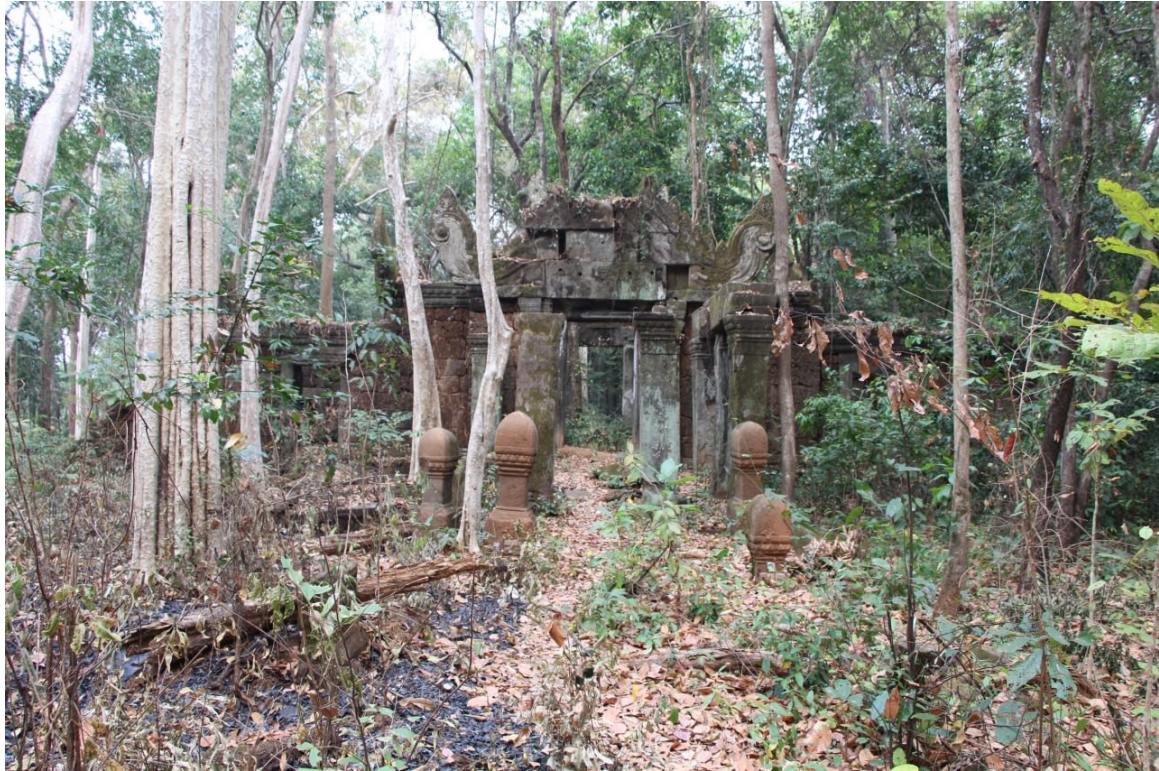
ទិដ្ឋភាពប្រាសាទភ្នំសណ្តក