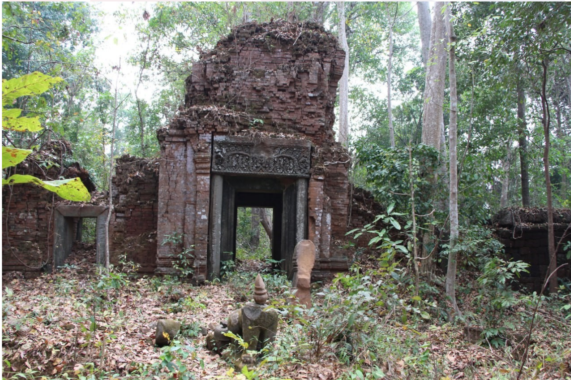
ទិដ្ឋភាពប្រាសាទភ្នំសណ្តក