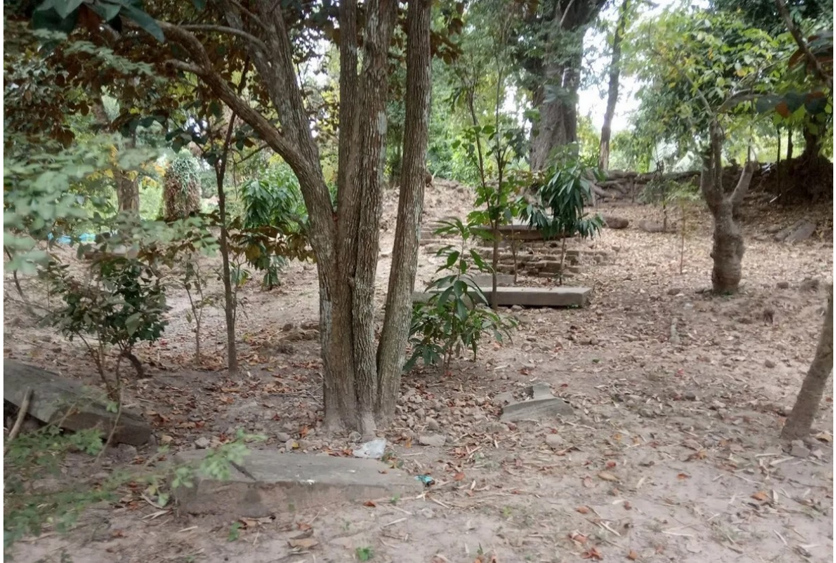
ប្រាសាទព្រៃក្មេងសព្វថ្ងៃ