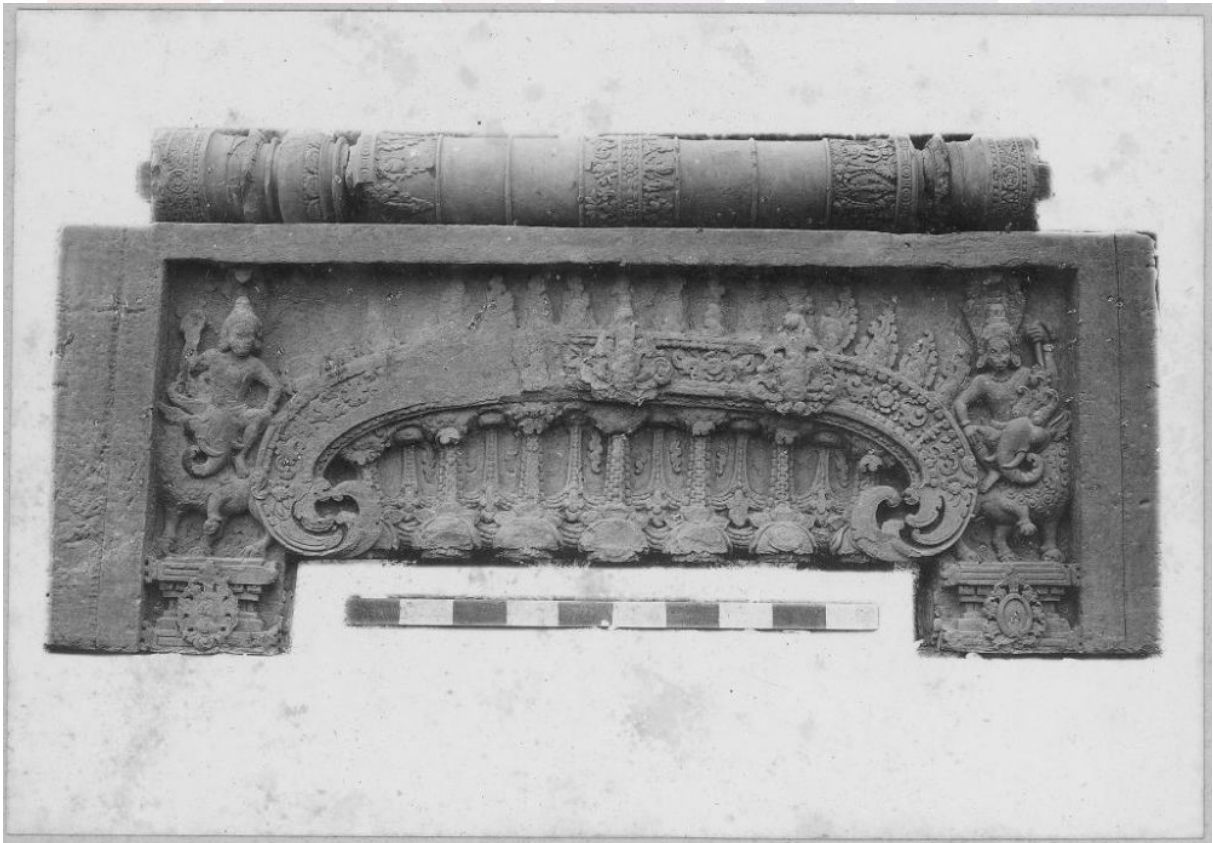
ផ្នែកនិងសសរពេជ្រប្រាសាទព្រៃក្មេង