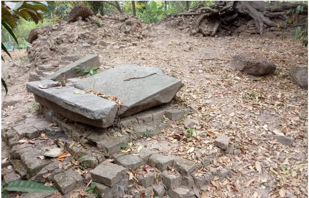
ប្រាសាទព្រៃក្មេងសព្វថ្ងៃ