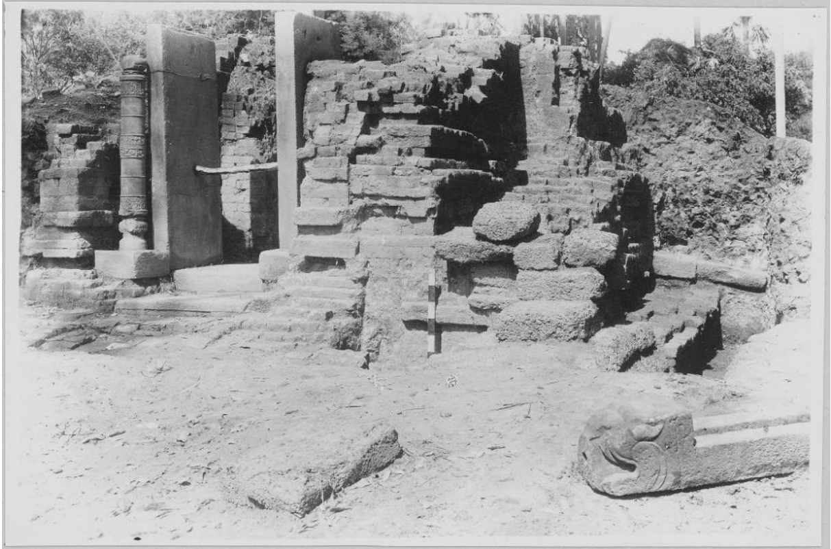
ប្រាសាទព្រៃក្មេង