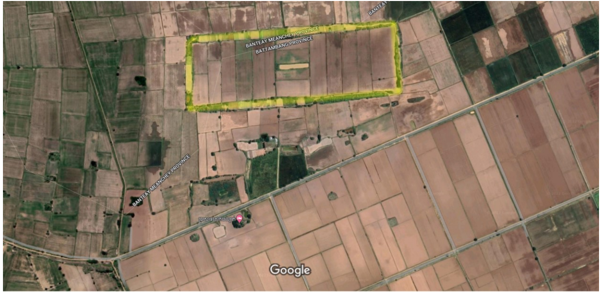
ផែនទីតំបន់គោកប្រដាក់ពីលើអាកាស