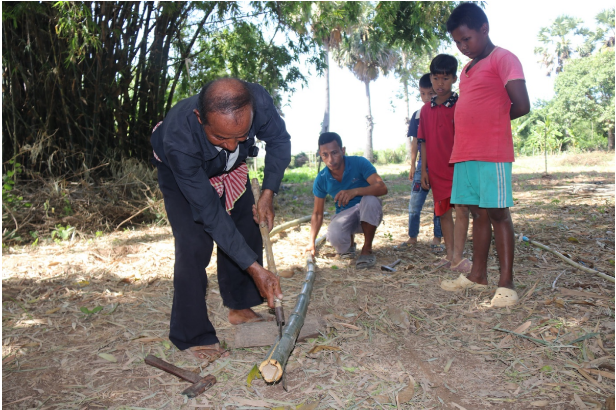
រូបលេខ១ ការសង្កេតរបស់ក្មេងជំនាន់ក្រោយចំពោះការងារសិប្បកម្ម