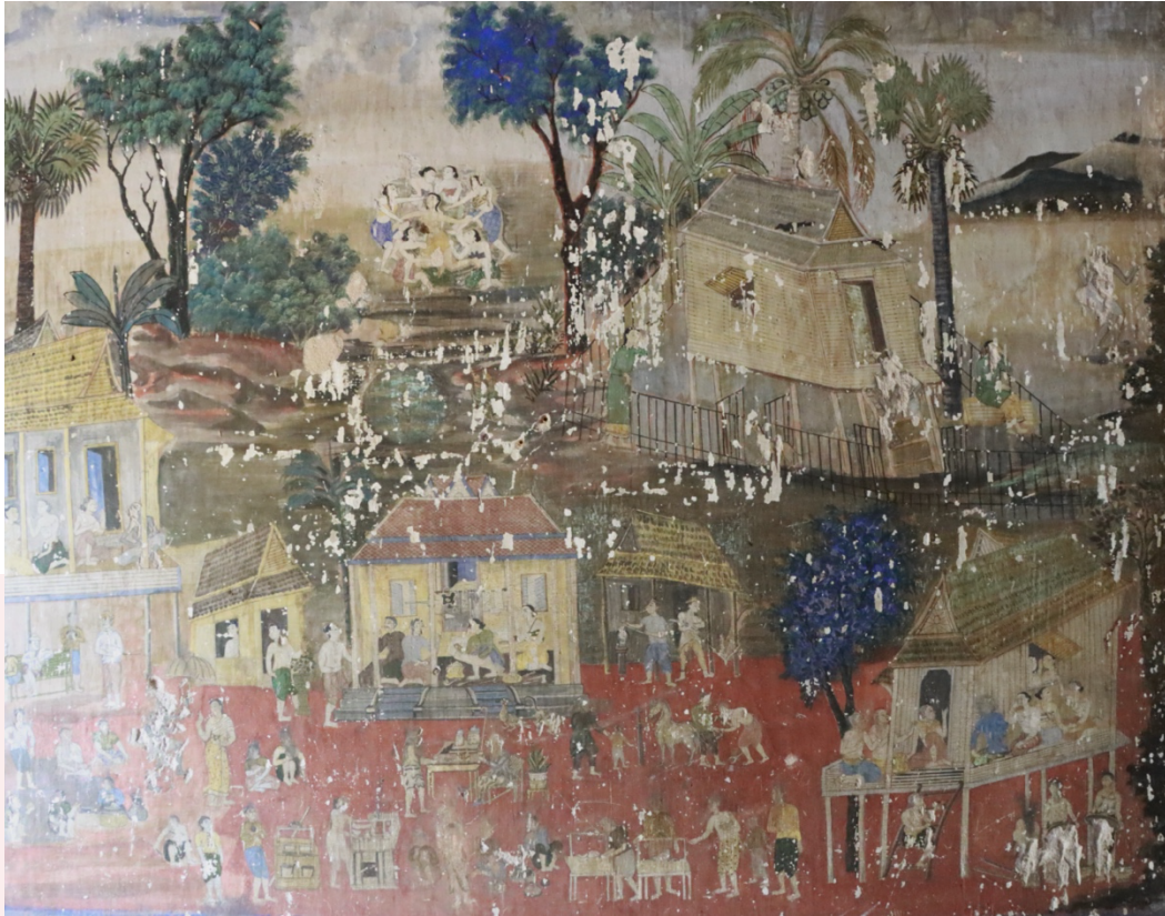
រូបលេខ៧ គំនូរវត្តកំពង់ត្រឡាចលើ បង្ហាញទិដ្ឋភាពផ្សារដែលមានរបរសិប្បកម្មផ្សេងៗ