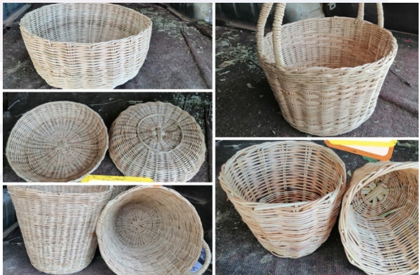
រូបលេខ៣ សម្ភារៈប្រើប្រាស់ស្តារញីពីរពាក់