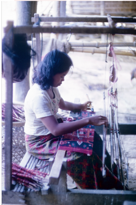
រូបលេខ៥ ស្ត្រីត្បាញហ្វូលនៅស្រុកបាទី ខេត្តតាកែវ