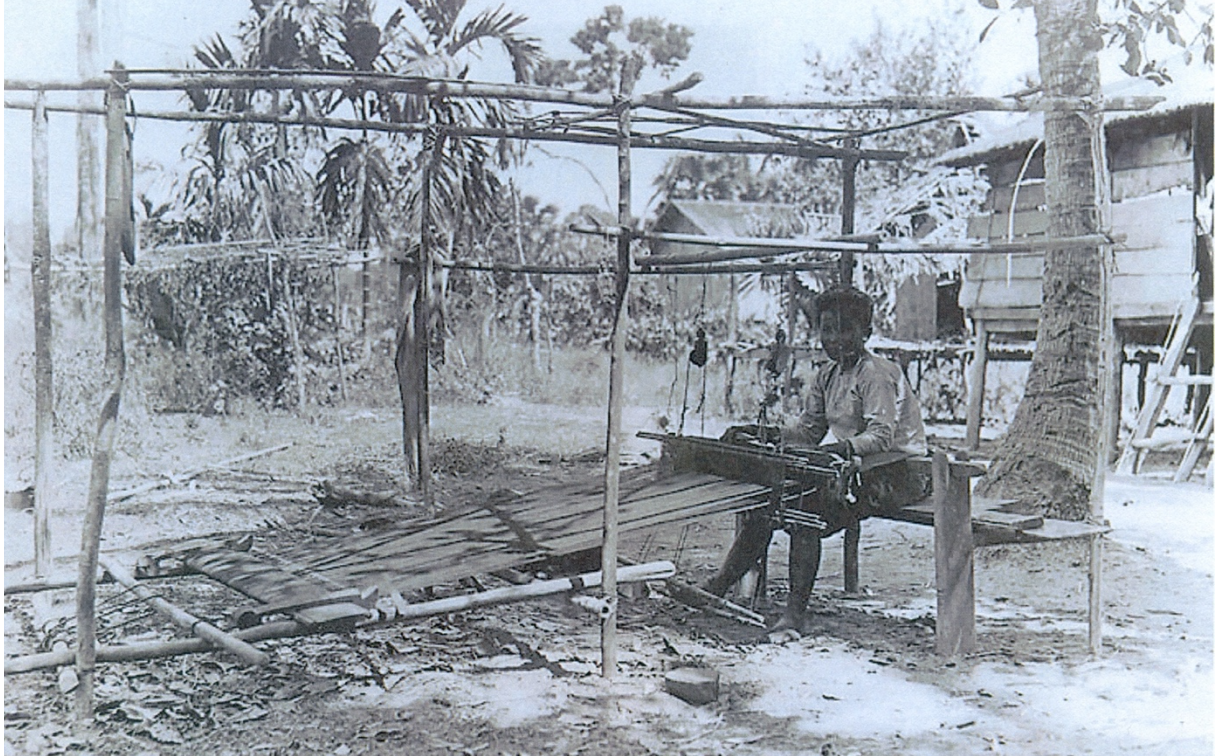
រូបលេខ៤ ស្ត្រីអង្គុយត្បាញនៅទសវត្សរ៍១៩៣១