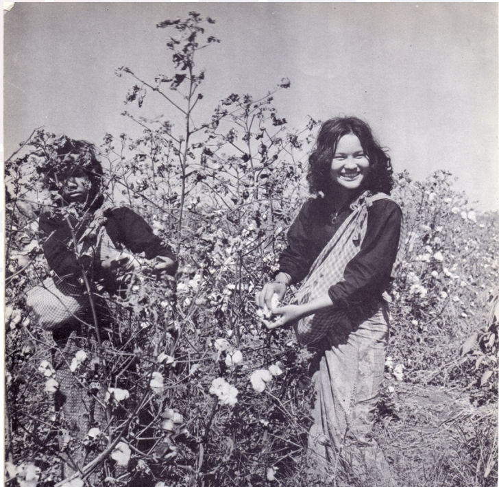
រូបលេខ៦ ស្ត្រីបេះកប្បាស