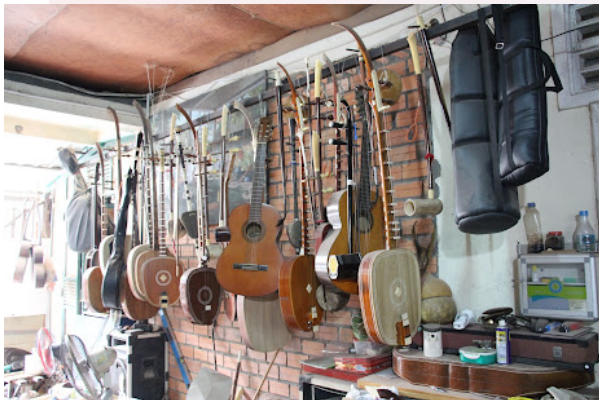
រូបលេខ២ សិប្បកម្មផលិតឧបករណ៍ភ្លេង