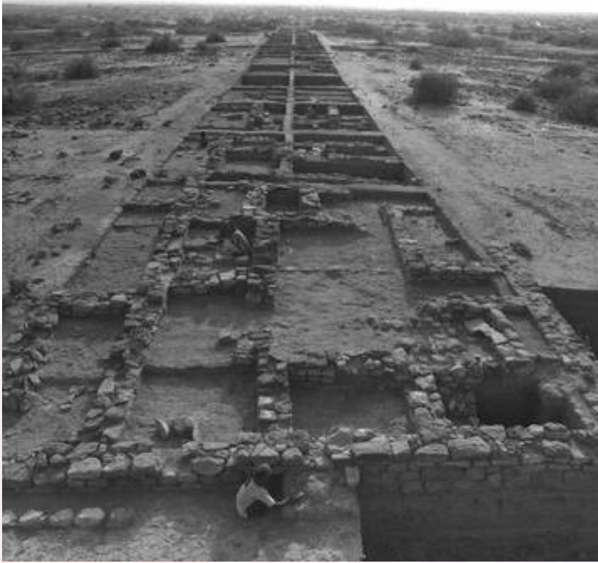
រូបលេខ២ និង ៣៖ សំណង់បុរាណក្នុងក្រុង dholavira