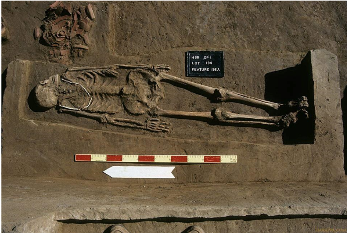
រូបលេខ៤៤និង ៥៖ គ្រោងឆ្អឹងរកឃើញក្នុងតំបន់នៃវប្បធម៌ហារ៉ាដាន