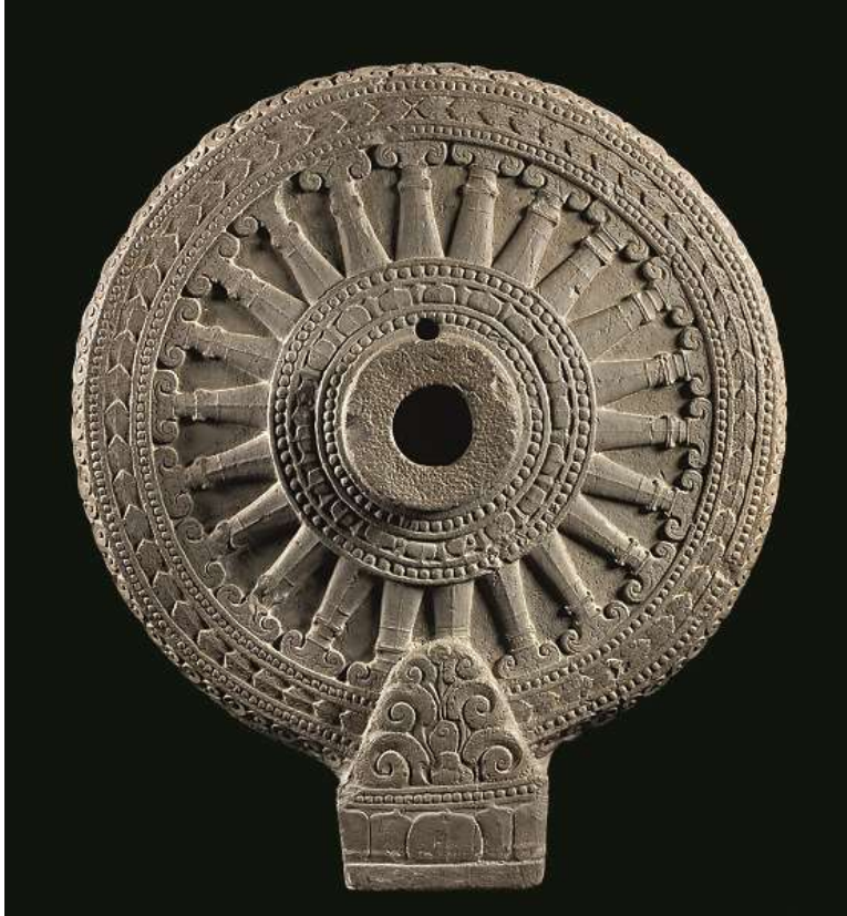
រូបលេខ៥ ៖ ចម្លាក់ធម្មចក្រ