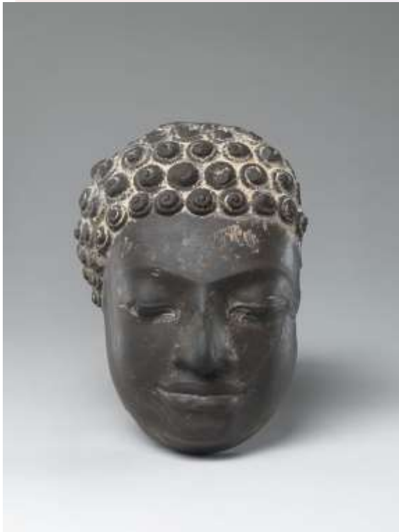
លេខ៤៖ ព្រះកេស