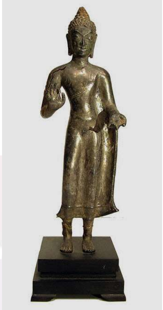
លេខ៣៖ ពុទ្ធរូបឈរអំពីលោហ ក្នុងវប្បធម៌ទ្វារវតី