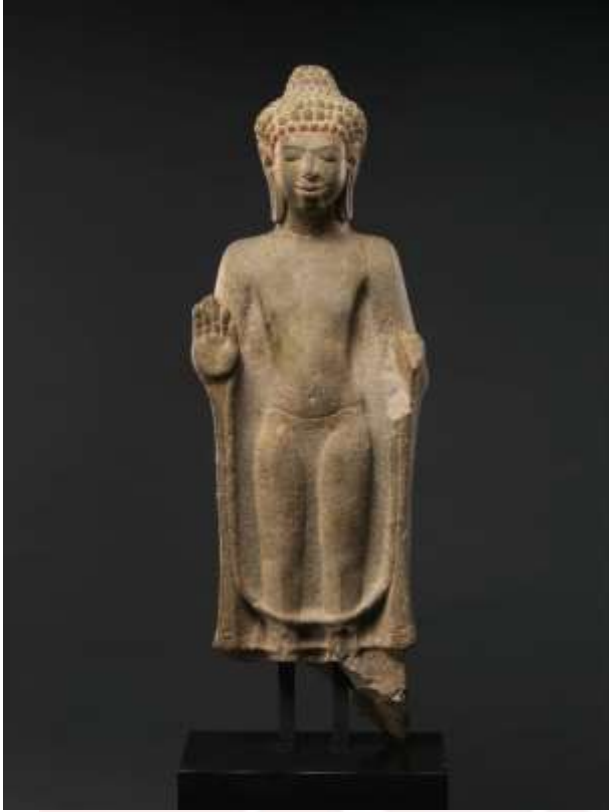
រូបលេខ២៖ ពុទ្ធរូបឈរ អំពីថ្មភក់ក្នុងវប្បធម៌ទ្វារវតី