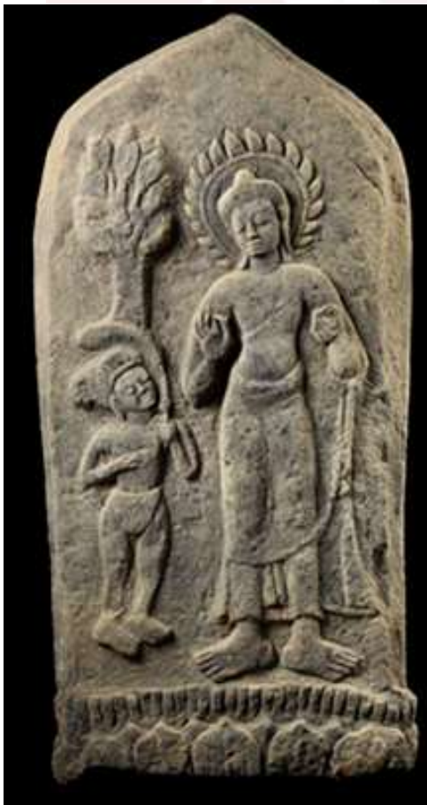
រូបលេខ៦ ៖ បង្គោលសីមា ដែលមានពុទ្ធរូប