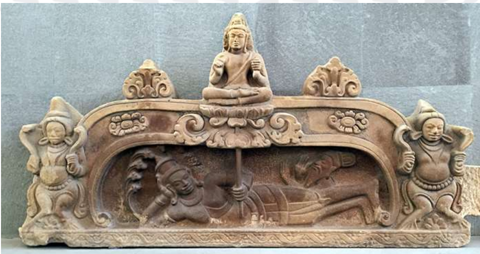
រូបលេខ៤ ៖ ផ្នែកព្រះវិស្ណុបដ្ឋុ