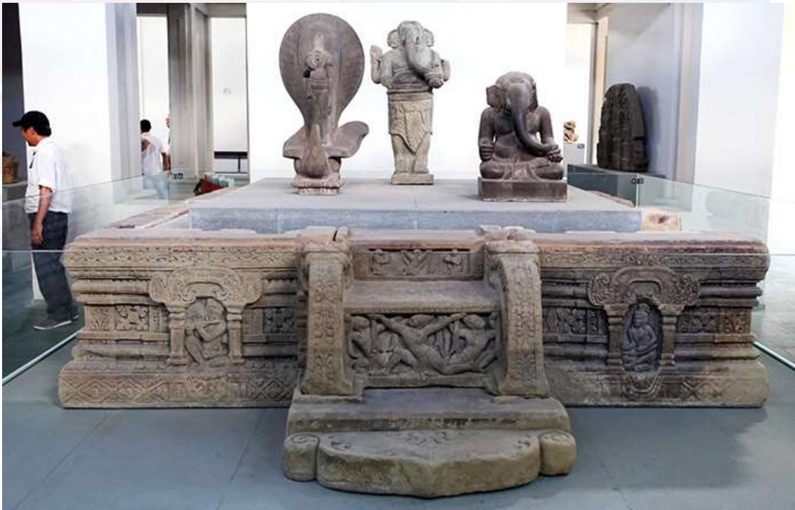
រូបលេខ៨ ៖ ក្បាច់ចម្លាក់ជើងទម្រង់ដែលមកពីតំបន់ប្រាសាទ My Son