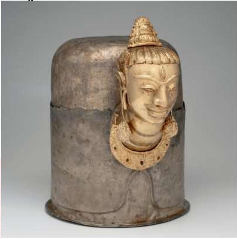
រូបលេខ៥ ៖ ចម្លាក់លិង្គមុខ (lingamukha) ក្នុងសិល្បៈចាម