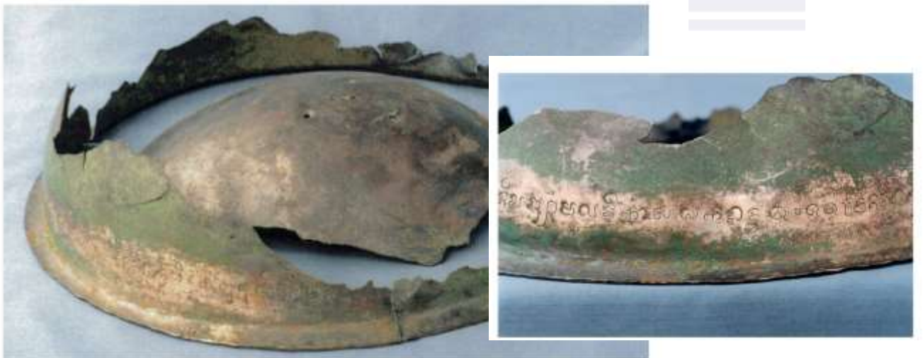
រូបលេខ៦ ៖ គ្រោមលោហៈសម្រាប់គ្រោបលិង្គដែលមានសិលាចារឹក