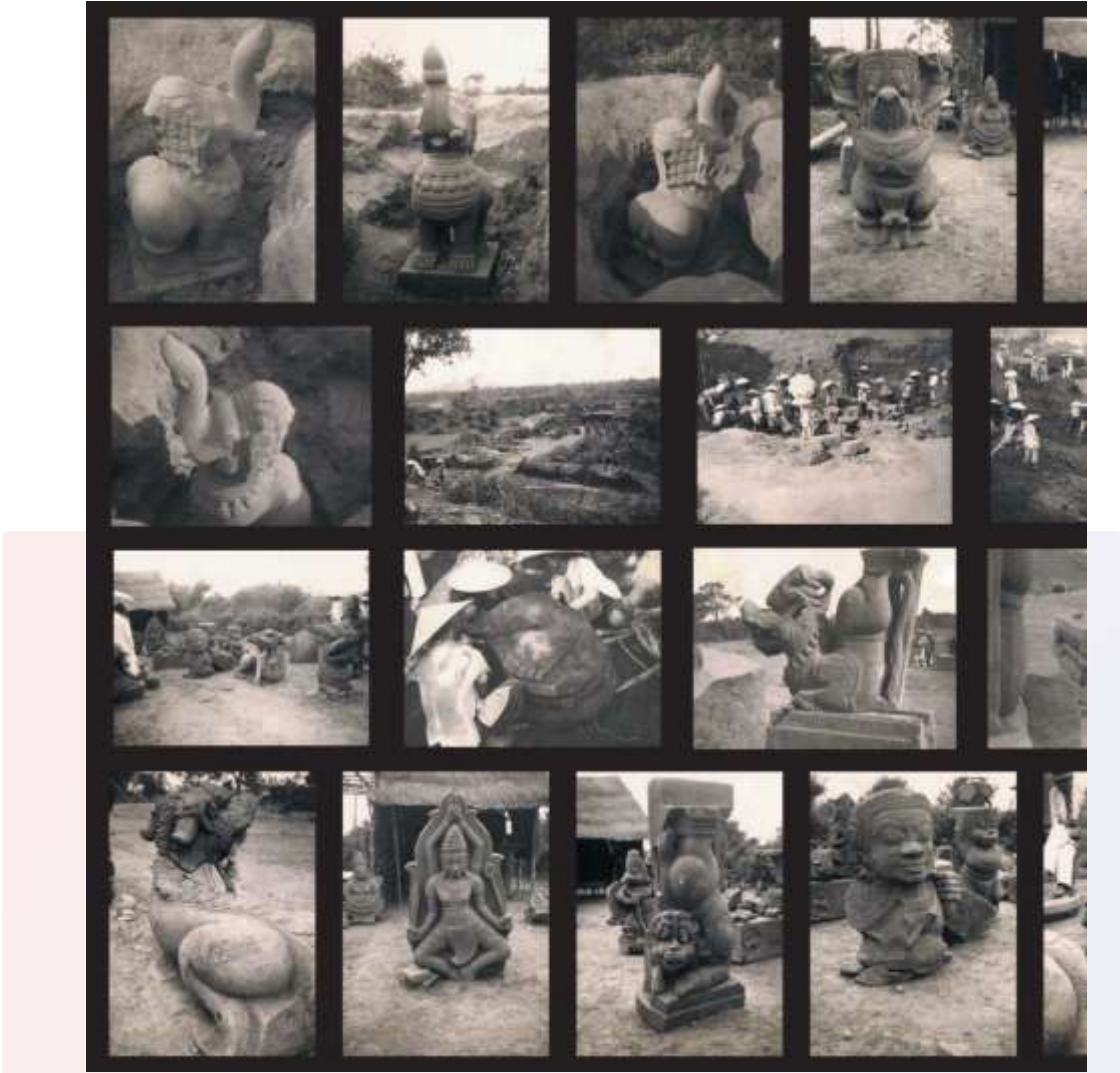
រូបលេខ៣ ៖ ចម្លាក់ក្នុងសិល្បៈចាម