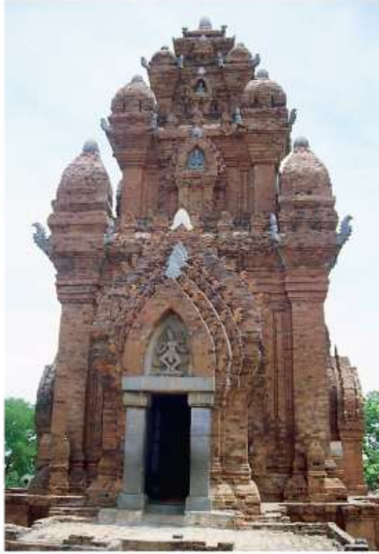
រូបលេខ៧ ៖ ប្រាសាទ Po Nagar de Nha Trang