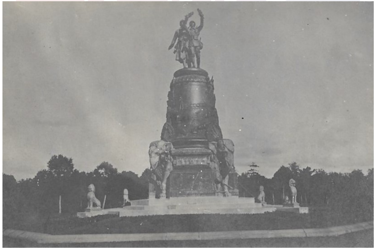
រូបលេខ១ «រូបពីរ» ឬស្នូបរំលឹកគុណអ្នកអនិច្ចកម្មក្នុងសង្គ្រាម

«រូបពីរ» ជាពាក្យខ្មែរហៅសំដៅដល់ស្នូបសាងសង់ឡើងដើម្បីរំលឹកគុណដល់វិរា ភាពយុទ្ធជនខ្មែរ និងបារាំង ដែលពលីជីវិតក្នុងសង្គ្រាមកាលពីឆ្នាំ១៩១៤-១៩១៨។ តាម រយៈឯកសាររាជកិច្ចរាជការ ១ បោះពុម្ពឆ្នាំ១៩២៥ ហៅស្នូបនេះថា «វិមានរំលឹកគុណដល់ អ្នកដែលទទួលអនិច្ចកម្មក្នុងចម្បាំងធំ (ពីឆ្នាំ១៩១៤ ដល់ឆ្នាំ១៩១៨)» ហើយមានចារឹក ពាក្យបារាំងថា “Monument aux Morts” (រូបលេខ១)។ អតីតស្នូបនេះ កសាងឡើងនៅមុំ រង្វង់មូលគល់ស្ថានជ្រោយចង្វារត្រើយខាងលិច ក្នុងរាជធានីភ្នំពេញ ពោលគឺស្ថិត នៅពុំឆ្ងាយពីស្ថានទូតបារាំងឡើយ។ ប៉ុន្តែក្នុងសម័យសង្គ្រាមទសវត្សទី១៩៧០ គេ បានបំផ្លាញស្នូបខាងលើរហូតក្លាយជាបំណែកៗ ហើយថ្មីៗនេះរាជរដ្ឋាភិបាលក្រោងនឹង រៀបចំស្ថាបនាឡើងវិញទុកជានិមិត្តរូបនៃសាមគ្គីភាពរវាងបារាំង និងកម្ពុជា។ ២