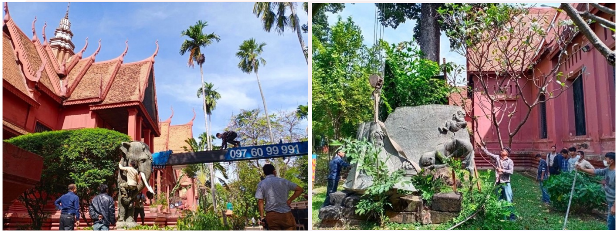
រូបលេខ២០-២១ សកម្មភាពលើកដាក់ដឹកជញ្ជូនបំណែកផ្សេងៗនៃស្នូបរូបពីរចេញពីសារមន្ទីរជាតិកម្ពុជា ដើម្បីយកទៅរៀបចំជួសជុលផ្អែកសាងឡើងវិញ

ដូច្នេះជារួមមក អតីតស្នូប ឬវិមានរំព្វកគុណយុទ្ធជនពលីកម្មក្នុងសង្គ្រាមលោក លើកទី១ ដែលភាគច្រើនហៅថា «រូបពីរ» គឺបង្ហាញឱ្យឃើញពីទឹកដៃសិល្បៈយ៉ាងល្អៗ មិនតែប៉ុណ្ណោះ វិមាននេះជាកស្ថានប្រវត្តិសាស្ត្រកម្ពុជាសម័យអាណាព្យាបាលបារាំង ដែលយុទ្ធជនខ្មែរបានបូជាជីវិតក្នុងការសង្គ្រាមលោកផង និងជានិមិត្តរូបយ៉ាងសំខាន់នៃ ទំនាក់ទំនងជាមិត្តរស់បារាំងនិងកម្ពុជា។