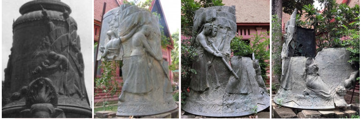
រូបលេខ១២

ទៀតលុតជង្គង់ ហើយមានបុរសម្នាក់កំពុងក្រាបសំពះនៅខាងមុខ ហុចជើងពានផ្ទៃលើ ជូនស្រ្តីនោះ។ រីឯរូបកូនក្មេងដែលស្រ្តីម្នាក់កាន់ក្នុងរូបលេខ១៣ គឺធ្លាក់នៅផ្នែកខាងលើនៃ បុរសកំពុងសំពះនេះ។ ដូច្នេះរូបលើតួស្តុបរូបពីរ គឺធ្លាក់ដេញបន្តគ្នាជុំវិញ។ ប៉ុន្តែគេពិបាក សន្និដ្ឋានថា ខ្លឹមសារនៃចម្បាំងទាំងនេះសិល្បករចង់រៀបរាប់ប្រធានបទអ្វីខ្លះឡើយ។