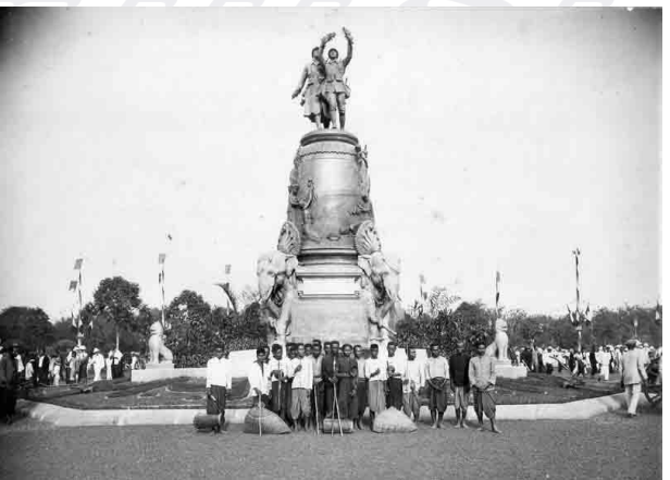
រូបលេខ៥-៦ ក្រុមរាំ និងភ្លេងក្នុងពិធីសម្ពោធស្នូបរូបពីរ