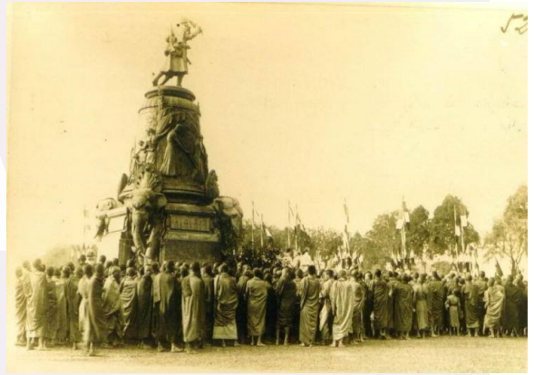
រូបលេខ៣-៤ ព្រះរាជវត្តមានព្រះមហាក្សត្រ ថ្នាក់ដឹកនាំបារាំង និងព្រះសង្ឃក្នុងពិធីសម្ពោធស្នូបរូបពីរ (ប្រភព៖ yosothor.org)