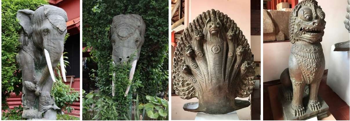
រូបលេខ១៦-១៩ បំណែកក្បាលដំរី នាគ និងតោនៃស្នូបរូបពីរ កាលរក្សានៅសារមន្ទីរជាតិកម្ពុជា