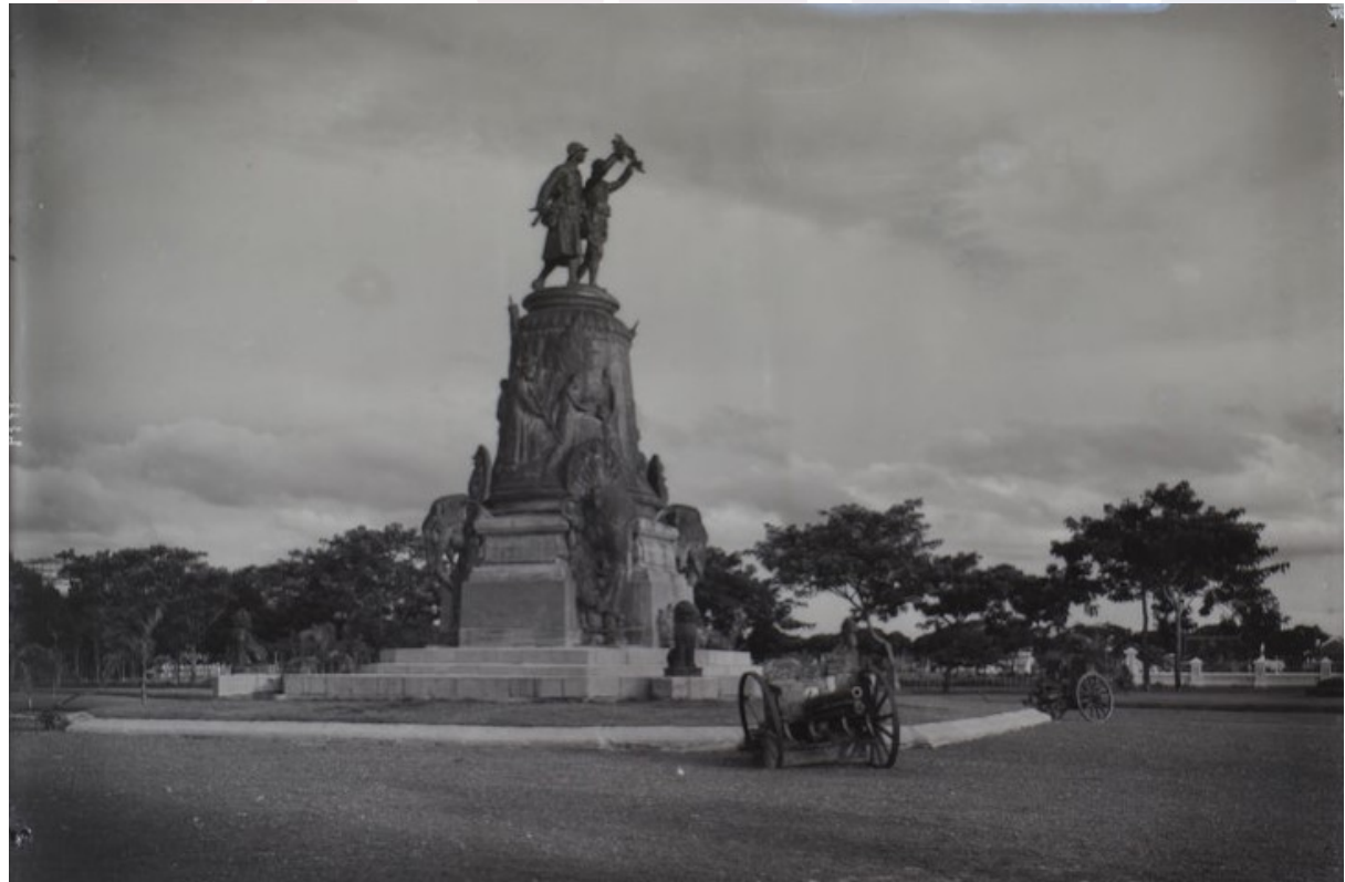
រូបលេខ៧ ទិដ្ឋភាពវិមានរំលឹកគុណខ្មែរ-បារាំង «រូបពីរ» ថតចុងទសវត្សទី២០

វិមានរំលឹកគុណយុទ្ធជនខ្មែរ-បារាំង ឬគេហៅខ្លីថា «រូបពីរ» ស្ថាបនាឡើងអំពីថ្ម និងលម្អដោយចម្លាក់ស្ថិតយ៉ាងវិចិត្រក្រៃលែង។ វិមាននេះសង់ខ្ពស់ត្រដែត ហើយមានបីផ្នែកគឺនៅផ្នែកខាងលើ និងផ្នែកកណ្តាល គេសាងឡើងអំពីលោហៈ។ នៅផ្នែកលើបំផុតនោះគេតម្កល់រូបមនុស្សប្រុសពីរនាក់ ដែលម្នាក់រាងខ្ពស់ជាទាហានបារាំង ឯម្នាក់ទៀតតូចជាងនោះបន្តិចជាទាហានខ្មែរ។ ៨ រីឯនៅផ្នែកកណ្តាល មានសណ្ឋានមូលស្រដៀងនឹងអង្គ(ខ្លួន)នៃចេតិយ ហើយមានធ្លាក់រូបមនុស្សប្រុសស្រី ទាំងក្មេងទាំងចាស់ក្នុងកាយវិការផ្សេងៗព័ទ្ធជុំវិញផង។ ចំណែកផ្នែកក្រោម គេសាងឡើងអំពីថ្ម មានរាងបួនជ្រុង ហើយនៅមុមជ្រុងនីមួយៗ គេលម្អដោយរូបក្បាលដំរីខាងក្រោម និងក្បាលនាគខាងលើ។ ប៉ុន្តែរូបក្បាលដំរីនិងក្បាលនាគទាំងអស់នេះ គេសាងអំពីលោហៈ ហើយនៅផ្ទៃថ្មគេចារឈ្មោះយុទ្ធជនចំនួន១៨៨នាក់។ ដោយឡែកនៅជ្រុងទាំងបួននៃខឿនជុំវិញ គេតម្កល់រូបតោដែលសាងអំពីលោហៈដែរ។ ផុតពីនោះមកគឺជាបរិវេណសួន ដែលគេឃើញមានតម្កល់ដាក់តម្កល់កាំភ្លើងធំនៅតាមជ្រុងនីមួយៗ (រូបលេខ៧)។