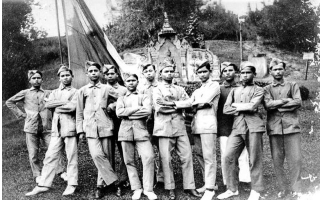
រូបលេខ២ រូបថតនៃយុទ្ធជនកម្ពុជាមួយចំនួនដែលចូលច្បាំងក្នុងសង្គ្រាមលោកលើកទី១

ជាការពិតតាមរយៈប្រវត្តិសាស្ត្រឱ្យដឹងថា សង្គ្រាមរវាងមហាអំណាចដ៏ក្នុងពិភពលោកកាលពីឆ្នាំ១៩១២ ដល់ឆ្នាំ១៩១៨ ឬគេហៅថា «សង្គ្រាមលោកលើកទី១» ៧ ពលរដ្ឋនៃប្រទេសស្ថិតក្រោមអាណាព្យាបាលរបស់មហាអំណាចទាំងអស់ ត្រូវគេកែនបញ្ជូនឱ្យទៅជួយច្បាំងដែរ (រូបលេខ២) ៨ គ្រានោះកម្ពុជាដែលស្ថិតក្រោមអាណាព្យាបាលបារាំងបានបញ្ជូនយុទ្ធជនចំនួន១៨៨នាក់ទៅចូលច្បាំង ៩ ហើយខ្លះបានបាត់បង់ជីវិត ខ្លះរហូសធ្ងន់ស្រាលដោយអំណាចសង្គ្រាម។ ក្នុងបំណងសងគុណបំណាច់ដ៏ធំធេងនៃពលិកម្មនេះនៅរវាងឆ្នាំ១៩២២ គេបានចាប់ផ្តើមស្ថាបនាចារឈ្មោះយុទ្ធជនទាំង១៨៨នាក់ ទុកជាវិមានវត្តក្នុងដែលខ្មែរទូទៅតែងហៅថា «រូបពីរ» ១០ វិមាននេះស្ថាបនារួចស្រេច ហើយសម្ពោធយ៉ាងឱឡារិកនៅក្នុងខែមីនា ឆ្នាំ១៩២៥។