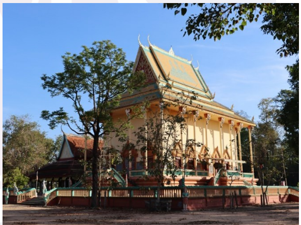
រូបលេខ៣ ព្រះវិហារថ្មីវត្តសំបូរ