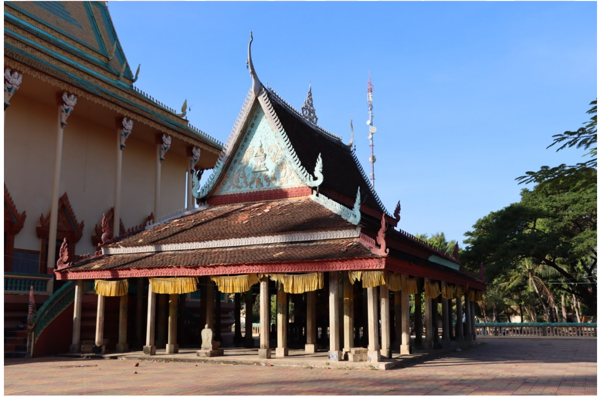
រូបលេខ១ ព្រះវិហារវត្តសំបូរ (មើលពីមុខ)

វត្តពោធិរោងសេះ ឬអ្នកស្រុកហៅថា “វត្តសំបូរ” ១ ស្ថិតក្នុងឃុំសំបូរ ស្រុកប្រាសាទសំបូរ ខេត្តកំពង់ធំ ពោលគឺស្ថិតនៅខាងកើតរមណីយដ្ឋានប្រវត្តិសាស្ត្រក្រុមប្រាសាទសំបូរព្រៃគុក ចម្ងាយប្រហែលជាង១០គីឡូម៉ែត្រប៉ុណ្ណោះ។ សព្វថ្ងៃនៅក្នុងបរិវេណវត្តសំបូរ គេឃើញមានព្រះវិហារពីរសាងទន្ទឹមគ្នា (រូបលេខ១)។ ព្រះវិហារខាងឆ្វេង គឺជាព្រះវិហារចាស់ ដែលជាសំណង់ដ៏ល្អឆើត សាងសង់ឡើងក្នុងរវាងដើមទសវត្សទី២០ នៃចុងសម័យអាណាព្យាបាលបារាំង។ លក្ខណៈស្ថាបត្យកម្មនៃព្រះវិហារនេះ មានទម្រង់ជាព្រះវិហារជហ្វាពីរ គ្រឿងបង្អួចឈើ ពិតានឈើ និងមានសសររេតុងជិត៥០ដើម តែគ្មានជញ្ជាំងឡើយ។ ព្រះវិហារបែបនេះ គឺជាលក្ខណៈសំណង់បុរាណមួយបែប ដែលកម្រឃើញមាននៅបណ្តាខេត្តផ្សេងៗ។ រីឯព្រះវិហារថ្មីសាងជាប់នឹងគ្រឹះព្រះវិហារចាស់ ហើយរួចរាល់ជាស្ថាបតរ និងបានធ្វើបុណ្យបញ្ចុះសីមាឆ្នាំ២០១៥។