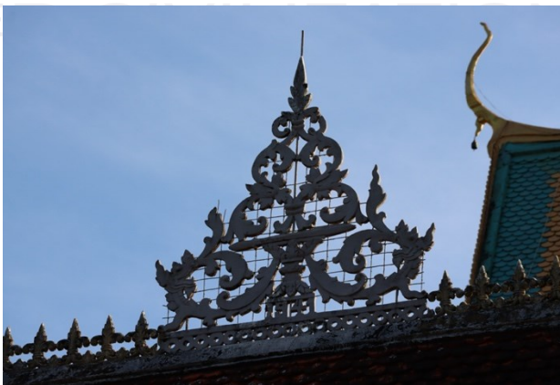
រូបលេខ៥ ការលម្អព្រំដំបូល