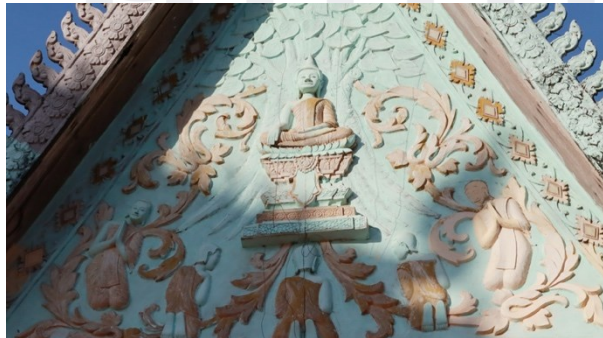
រូបលេខ៧ ហោជាងខាងកើត

ប៉ុន្តែអ្វីដែលគួរឱ្យកត់សម្គាល់ គេធ្លាក់កាយវិការព្រះពុទ្ធគង់លើបល្ល័ង្កវត្ត(?) ព្រះហស្តស្តាំគង់លើព្រះបាទស្តាំ ចុងម្រាមសំយ៉ុងចុះក្រោម ព្រះហស្តឆ្វេងដាក់ផ្ទារស្របលើព្រះបាទឆ្វេង (រូបលេខ៧)។ ៣ ចំណែកឯហោជាងខាងក្រោយ គេធ្លាក់ជារូបទេពមួយអង្គកាន់គ្រឿងសាស្ត្រាក្នុងព្រះហស្តទាំងសងខាង ឈរលើដំរីក្បាលបី (រូបលេខ៨)។ ទេពអង្គនេះ ប្រហែលគេចង់ធ្លាក់សំដៅដល់តួអង្គព្រះឥន្ទ្រ គង់លើដំរីនិងជាដំរី (ព្វវារីណា) ដែលតែងនិយមឃើញធ្លាក់នៅតាមផ្លែរ ឬហោជាងប្រាសាទបុរាណនានា។ ៤ សូមបញ្ជាក់ថាការលាបពណ៌លើគ្រឿងលម្អស្ថាបត្យកម្មផ្នែកខាងលើដូចជា ជហ្វា ព្រំដំបូល ក្បាលនាគ ហោជាង ក្បាច់គល់ហោជាង និងក្បាច់រងស្សូវជាដើម គេសង្កេតឃើញហាក់ដូចជាពុំទាន់រួចរាល់ហើយស្រេចឡើយ ដ្បិតផ្នែកខ្លះគេឃើញមានពណ៌ផ្ទៃមេឃស្រាល ផ្នែកខ្លះមានពណ៌ផ្កាឈូក ហើយផ្នែកខ្លះមានពណ៌ដីលែង។