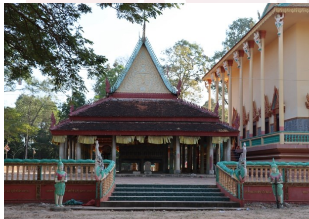
រូបលេខ២ ព្រះវិហារវត្តសំបូរ (មើលពីក្រោយ)

ព្រះវិហារចាស់វត្តសំបូរ កសាងឡើងនៅលើខឿនកម្ពស់ប្រហែល១ម៉ែត្រ។ បន្ទាប់ពីសាងសង់ព្រះវិហារថ្មីរួចជាស្ថាពរមក ខឿនព្រះវិហារទាំងពីរបានរៀបគ្នាបញ្ចូលគ្នាធ្វើជាខឿនទី១ នៃព្រះវិហារថ្មី (រូបលេខ២-៣)។ ដោយឡែកបើនិយាយតែព្រះវិហារចាស់ គេសង្កេតឃើញថាជាព្រះវិហារដែលមានកម្ពស់ទាបល្មម ដំបូលប្រក់ក្បឿងស្រកាលេញជ្រាលចុះសងខាងពីរជ្រក។ នៅចុងព្រំដំបូលខាងមុខបំពាក់ជហ្វាមួយ ហើយចុងព្រំដំបូលខាងក្រោយក៏បំពាក់ជហ្វាមួយដែរ (រូបលេខ៤)។ នៅចំកណ្តាលព្រំដំបូល រចនាលម្អក្បាច់មួយផ្ទាំង ២ មានចារឹកភ្ជាប់នឹងលេខ “1941” (រូបលេខ៥) ដែលក្បាច់លម្អមួយផ្ទាំងនេះក៏ឃើញចម្លងប្រើបន្តលើព្រំដំបូលព្រះវិហារថ្មីដែរ។ រីឯនៅតាមចែងដំបូលនីមួយៗ លម្អដោយនាគចែងក្នុងមួយជ្រុងចំនួន៣ ដែលក្បាលនាគខ្លះមានការរចនាពីសសៃដែកធ្វើជាអណ្តាតនាគប្រកបដោយសិល្បៈយ៉ាងល្អវិសេស (រូបលេខ៦)។