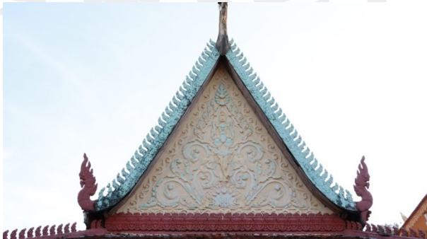
រូបលេខ៨ ហោជាងខាងលិច