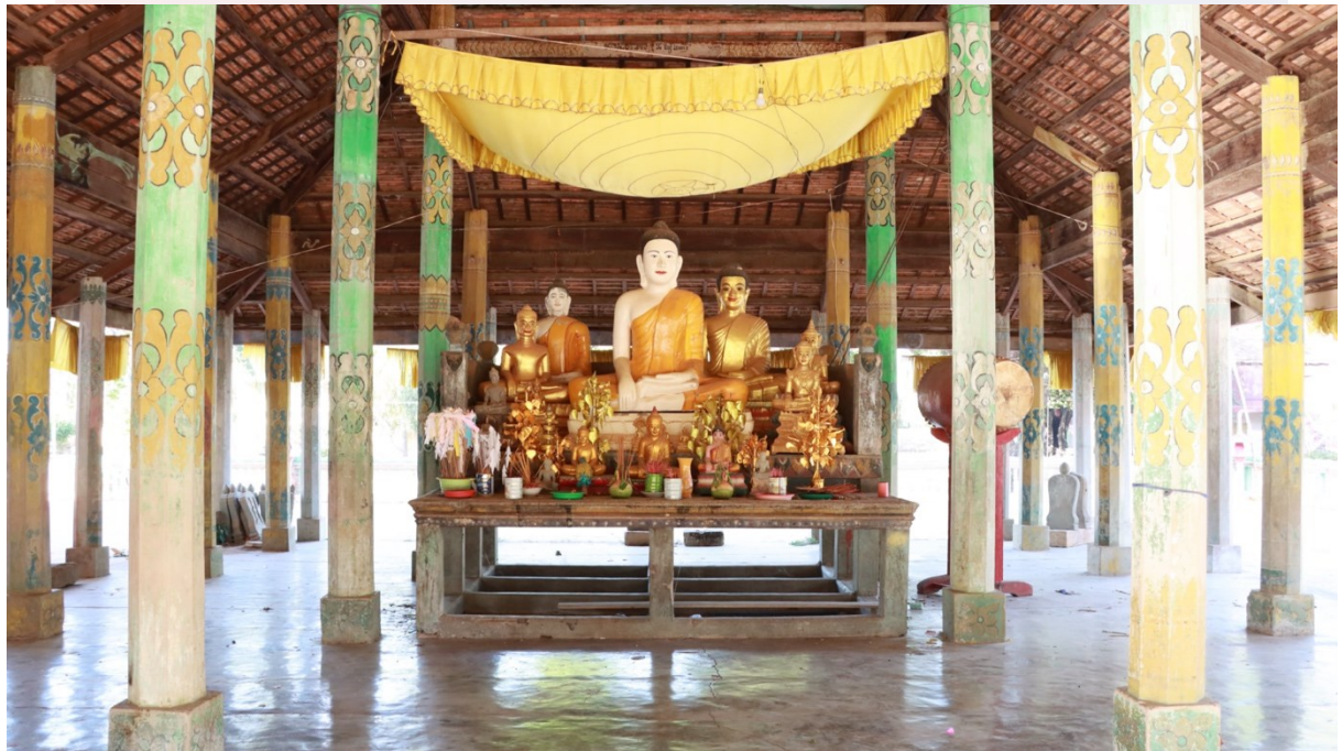
រូបលេខ៩ ផ្នែកខាងក្នុងព្រះវិហារចាស់វត្តសំបូរ និងព្រះបដិមាព្រះដីវតម្កល់ក្នុងព្រះវិហារ

រីឯចន្លោះសសរបាំងសាចនៃព្រះវិហារវត្តសំបូរ នៅតាមត្រង់ទិសទាំងបួន និងទិសតូចៗជុំវិញ គេសង្កេតឃើញមានតម្កល់សន្លឹកសីមាធ្លាក់ពីថ្មភក់។ សន្លឹកសីមាទាំងនោះពុំបញ្ចុះភ្ជាប់ទៅនឹងគ្រឹះព្រះវិហារឡើយ ពោលគឺតម្កល់លើទ្រនាប់ថ្មមួយដុំរាងបួនជ្រុង។ ចំណែកឯនៅចុងល្វែងគ្រឹះផ្នែកខាងលិច គេសាងបល្ល័ង្ក(អាសន៍ព្រះ?) មានចន្លោះលំហខាងក្រោម តម្កល់ព្រះបដិមាព្រះដីវ័ធំ គង់ក្នុងកាយវិការផ្កាញ៉ាមារ សាងពីស៊ីម៉ង់ត៍ អមដោយព្រះពុទ្ធបដិមាតូចធំផ្សេងៗទៀត (រូបលេខ៩)។ នៅលើក្បាលសសរខ្លះគេឃើញមានចំណារឈ្មោះម្ចាស់សទ្ធាសាងសសរ និងកាលបរិច្ឆេទព.ស.២៥០៥ ឆ្នាំ១៩៦២។