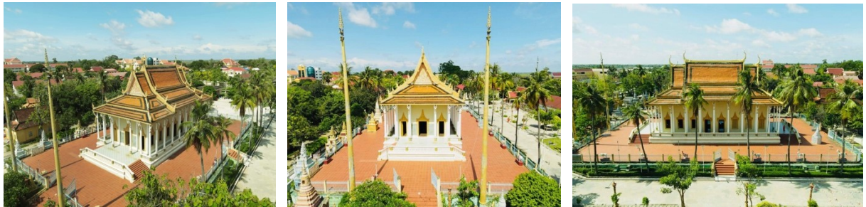
រូបលេខ៤-៦ ព្រះវិហារវត្តសំសមីមើលពីមុខ និងចំហៀង

ដូចបានបញ្ជាក់មកខាងដើម ព្រះវិហារវត្តសំសមីសង់នៅលើខឿនពីរថ្នាក់។ ខឿន ថ្នាក់ទី១ ខ័ណ្ឌព័ទ្ធដោយសួនផ្កា និងរបងដែក ដែលទុកច្រកចូលតាមតាមទិសទាំងបួន។ ខឿនថ្នាក់ទី២ មានកម្ពស់ប្រហែលជាង១ម៉ែត្រ មានបង្គន់ដៃជុំវិញត្រឹមសសរបាំងសាច់ ដោយមានជណ្តើរឡើងតែទិសខាងកើត និងទិសខាងលិចប៉ុណ្ណោះ។ ព្រះវិហារនេះ ជា ទម្រង់វិហារបុរាណដែលសង់ពង្រីកខ្នាត ឱ្យទូលាយ និងស្រឡះ ដោយមានទ្វារធំៗបីនៅ ទិសខាងកើតនិងខាងលិច និងទ្វារម្ខាងពីរនៅទិសខាងត្បូង និងខាងជើង ព្រមទាំងបង្អួច ម្ខាង៦ នៅលើជញ្ជាំងចំហៀងទាំងពីរ (រូបលេខ៤)។