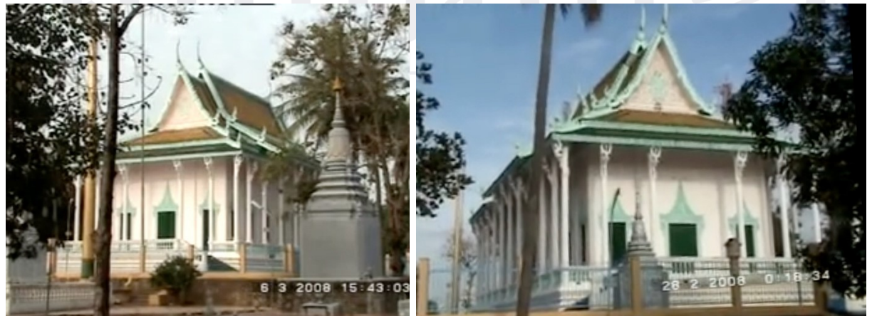
រូបលេខ១-២ ព្រះវិហារវត្តសំសមីមុនជួសជុល (ប្រភព៖ ប៊ែន វិបុល, ២០០៨)

ជាការពិត គិតមកដល់បច្ចុប្បន្ន ព្រះវិហារវត្តសំសមីមានអាយុកាលជិត១០០ឆ្នាំ។ ប៉ុន្តែគេមើលឃើញថា ព្រះវិហារនេះគឺជាសំណង់មានលក្ខណៈរឹងមាំជាងព្រះវិហារតាមបណ្តាវត្តផ្សេងៗ ដែលកសាងឡើងក្នុងសម័យកាលប្រហាក់ប្រហែលគ្នា។ ព្រះវិហារនេះកសាងអំពីថ្ម លើខឿនពីរថ្នាក់ មានជញ្ជាំងខ្ពស់ស្រឡះ ដំបូលប្រក់ក្បឿង និងបំពាក់ជហ្វាស៊ា។ ជញ្ជាំង និងហោជាងព្រះវិហារ លាបពណ៌ផ្កាយក្រហម ហើយមុនឆ្នាំ២០១២ គេសង្កេតឃើញថា រចនាសម្ព័ន្ធដំបូលព្រះវិហារមានការបាក់បែក លេចធ្លុះដោយអន្លើ (រូបលេខ១-២)។ ប៉ុន្តែក្រោយមក រចនាសម្ព័ន្ធសំខាន់ៗ និងគ្រឿងបង្ហាញខ្លះនៃផ្នែកដំបូលបានជួសជុលកែលម្អយ៉ាងប្រសើរដូចឃើញសព្វថ្ងៃ (រូបលេខ៣)។