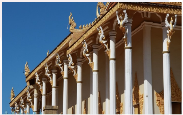
រូបលេខ៨ ទែនទយរូបគ្រុឌលម្អលើក្បាលសសរ