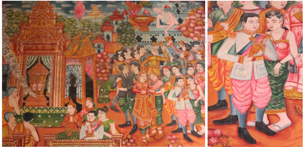
រូបលេខ២០-២១ ពិធីចែកព្រះបរមសារីរិកធាតុព្រះសម្មាសម្ពុទ្ធ