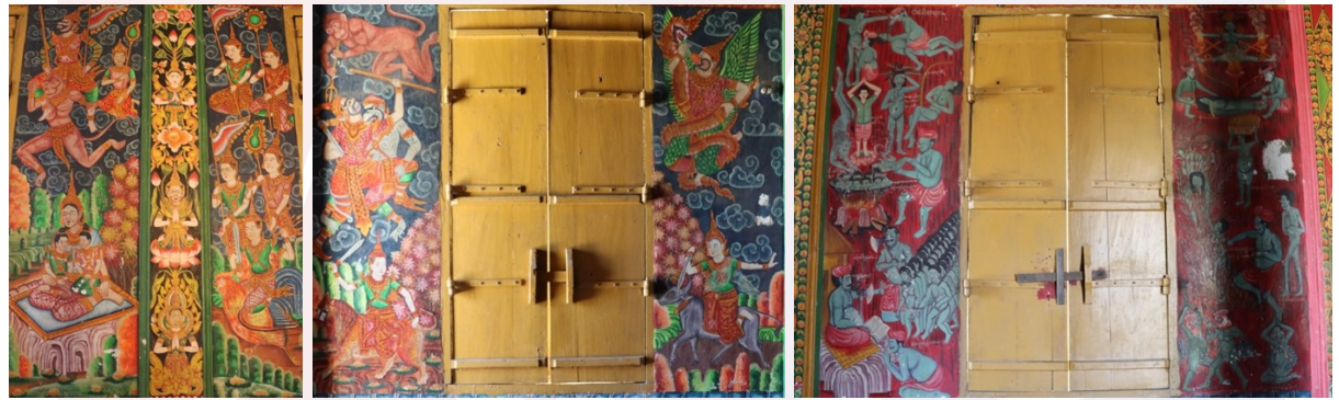
រូបលេខ១៧-១៩ គំនូររឿងជាតក រូបទេវតាប្រចាំឆ្នាំ តួអង្គក្នុងទេពកថា និងការធ្វើទារុណកម្មសត្វនរក

គំនូរលើជញ្ជាំងមានពីរជួរ គឺជួរខាងលើជារឿងពុទ្ធប្រវត្តិចាប់ផ្តើមពីទ្រង់ប្រសូត្រ រហូតបរិនិព្វាន។ គំនូរជួរខាងក្រោមមានខ្លឹមសាររឿងចម្រុះដូចជា រឿងជាតក ការធ្វើ ទារុណកម្មពួកសត្វនរក តួអង្គក្នុងរឿងរាមកេរ្តិ៍ ទេវតាប្រចាំខែឆ្នាំទាំង១២ និងរូបទេពនិករ ផ្សេងៗ (រូបលេខ១៧-១៩)។ ប៉ុន្តែក្នុងបណ្តារូបនៃរឿងពុទ្ធប្រវត្តិលើជញ្ជាំងទាំងអស់ គេ សង្កេតឃើញត្រង់ផ្ទាំងចែកព្រះបរមសារីរិកធាតុព្រះពុទ្ធ (រូបលេខ២០) មានរូបតួយុវក្សត្រ មួយព្រះអង្គ ទ្រង់ព្រះពស្ត្រក្សិនពណ៌ផ្កាយក្រហម ព្រះកូសាកុតកត្រង់ពណ៌ស ទ្រង់ត្រៀង ព្រះឥសូរិយយស ហើយយាងទ្រព្រះកោដ្ឋមានមួយផង (រូបលេខ២១)។ ក្នុងរូបនេះ អ្នកខ្លះយល់ថាគឺជាព្រះតាយាលក្ខណ៍ ព្រះបរមរតនកោដ្ឋ។