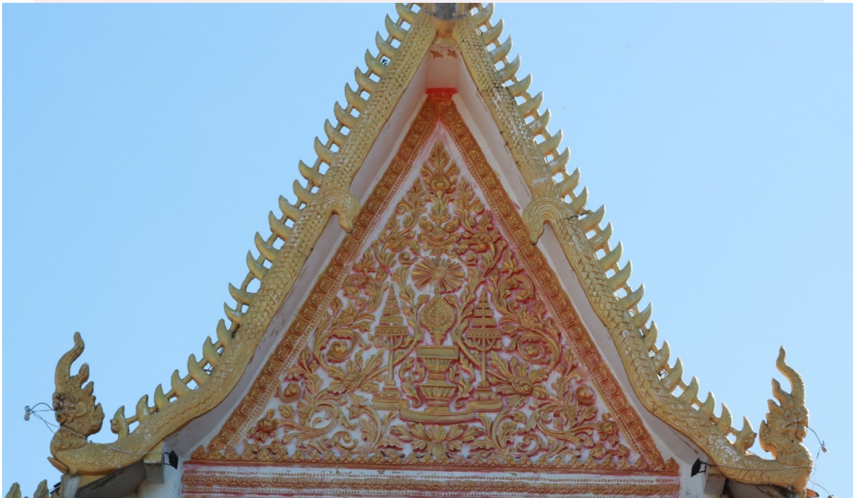
រូបលេខ៩ ក្បាច់លម្អលើហោជាងព្រះវិហារ