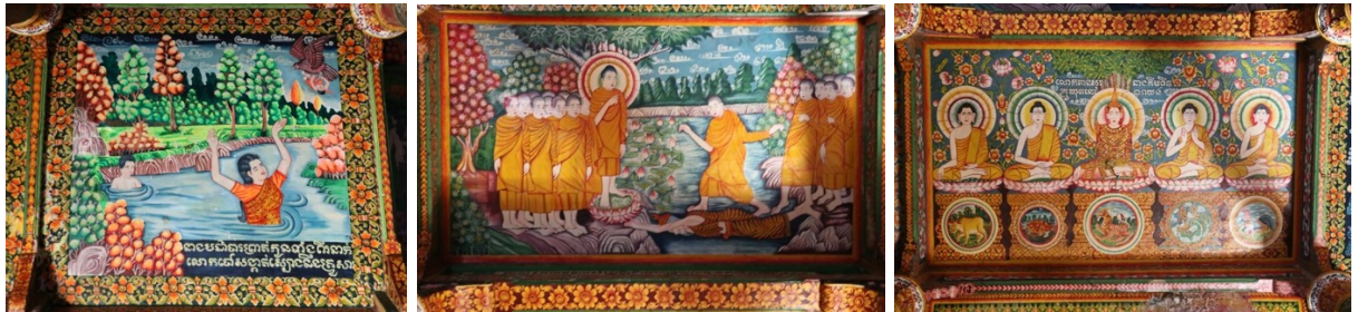
រូបលេខ១៤-១៦ គំនូរខ្លះគួរនៅលើពិភានដូចជា នាងបដាបារ សុមេធាបាស និងព្រះប្រាំព្រះអង្គ...

ដោយឡែកគំនូរនៃព្រះវិហារនេះ គឺបានបញ្ជាក់មកខាងលើស្រេចថាចាប់ផ្តើមគួរក្រោយព្រះវិហារបញ្ចុះសីមារួចជាង២០ឆ្នាំ ដោយមានជាងគំនូរពីខេត្តកំពង់ធំឈ្មោះ ម៉ែនសារឿន។ ចំពោះលក្ខណៈនៃការរៀបចំគំនូរខាងក្នុងព្រះវិហារនេះ គឺមានគំនូរពីរជួរលើជញ្ជាំងជុំវិញ និងគំនូរជាផ្ទាំងធំៗលើពិភាន។ ជាទៅទៅគេសង្កេតឃើញថា ចាប់ពីត្រឹមជួរខាងលើនៃជញ្ជាំងរហូតដល់ផ្ទៃពិភាន គេគួរបង្ហាញឈុតផ្សេងៗចម្រុះគ្នាទាំងរឿងពុទ្ធប្រវត្តិ និងរឿងក្នុងជាតកនាណាដូចជា នាងបដាបារ សុមេធាបាស និងព្រះប្រាំព្រះអង្គជាដើម (រូបលេខ១៤-១៦)។