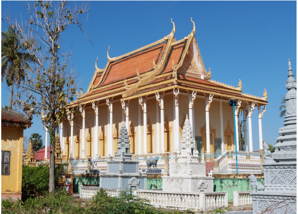
រូបលេខ៣ ព្រះវិហារវត្តសំសមីក្រោយជួសជុលរួច (មើលពីជ្រុងអាគ្នេយ៍)

ដូចបានបញ្ជាក់មកខាងដើម ព្រះវិហារវត្តសំសមីសង់នៅលើខឿនពីរថ្នាក់។ ខឿន ថ្នាក់ទី១ ខ័ណ្ឌព័ទ្ធដោយសួនផ្កា និងរបងដែក ដែលទុកច្រកចូលតាមតាមទិសទាំងបួន។ ខឿនថ្នាក់ទី២ មានកម្ពស់ប្រហែលជាង១ម៉ែត្រ មានបង្គន់ដៃជុំវិញត្រឹមសសរបាំងសាច់ ដោយមានជណ្តើរឡើងតែទិសខាងកើត និងទិសខាងលិចប៉ុណ្ណោះ។ ព្រះវិហារនេះ ជា ទម្រង់វិហារបុរាណដែលសង់ពង្រីកខ្នាត ឱ្យទូលាយ និងស្រឡះ ដោយមានទ្វារធំៗបីនៅ ទិសខាងកើតនិងខាងលិច និងទ្វារម្ខាងពីរនៅទិសខាងត្បូង និងខាងជើង ព្រមទាំងបង្អួច ម្ខាង៦ នៅលើជញ្ជាំងចំហៀងទាំងពីរ (រូបលេខ៤)។