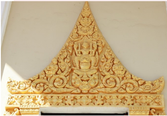
រូបលេខ៧ ក្បាច់លម្អស៊ុមទ្វារ-បង្អួច

រីឯការលម្អផ្សេងៗផ្នែកខាងក្រៅជញ្ជាំងព្រះវិហារ គេឃើញមានតែនៅលើស៊ុមទ្វារ- បង្អួច និងនៅលើក្បាលសសរជុំវិញបាំងសាច់។ នៅលើស៊ុមទ្វារ និងបង្អួច គឺជាក្បាច់ពុម្ព ស៊ីម៉ង់ត៍ដែលគេធ្លាក់ជាក្បាច់អង្ករ បំបែកជុំវិញរូបព្រះវិស្ណុជិះគ្រុឌ (រូបលេខ៧)។ រីឯនៅ តាមក្បាលសសរជុំវិញបាំងសាច់ លម្អដោយទែនទយរូបគ្រុឌ មានស្វាបធ្លាក់ជាក្បាច់ ក្រីទេសទ្រវេងស្បូវ (រូបលេខ៨)។ ចំណែកឯហោជាងព្រះវិហារនេះ រចនាលម្អដោយក្បាច់ ដូចគ្នាទាំងសងខាង ពោលគឺធ្លាក់ក្បាច់ក្រីទេសលាយជុំវិញរូបផ្ចិតចាមរតម្កល់នៅលើជើងពាន ដែលមានពន្លឺរស្មីនៅកំពូល និងត្រូវតម្កល់យក្ខអមសងខាង (រូបលេខ៩)។