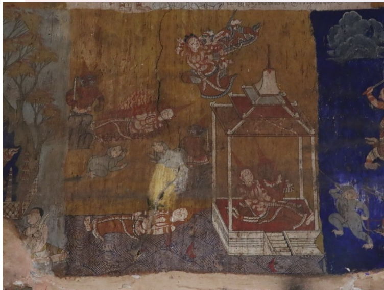
រូបលេខ១២ ឈុតមួយនៃរឿងរាមកេរ្តិ៍បង្ហាញពីនាងបញ្ញាកាយកាឡាខ្លួនជាសពព្រះនាងសីតាអណ្តែតមកទើបមុខព្រះពន្លាព្រះរាម