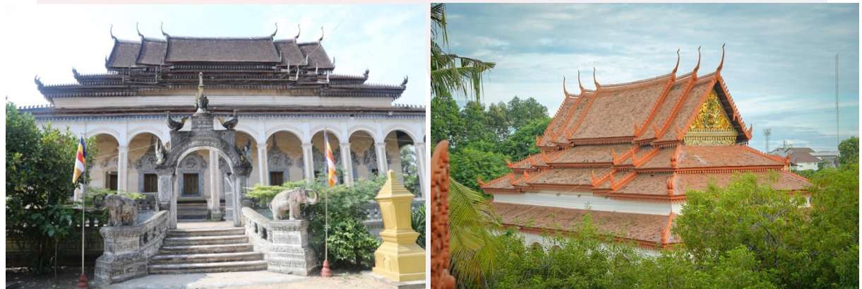
រូបលេខ៤-៥ ព្រះវិហារវត្តរាជបូណ៌មុនជួសជុល និងក្រោយជួសជុល

វិហារជាដំបូលក៏ដឹង ខ្ពស់ស្រឡះ ប្រក់ក្បឿងស្រកាលេញ ជ្រាលចុះម្ខាង៤ថ្នាក់ ហើយនៅ ចុងព្រំដំបូលខាងមុខបំពាក់ជហ្វាព្យា ចុងព្រំដំបូលខាងក្រោយបំពាក់ជហ្វាព្យា។ នៅលើព្រំ ដំបូលមានលម្អដោយក្បាច់មួយខ្សែ (នាងច្រាល?) ភ្ជាប់ពីចុងម្ខាងទៅម្ខាងយ៉ាងល្អប្លែក។ រីឯនៅតាមចែងដំបូលនីមួយៗ គេឃើញមានលម្អនាគចែង ទេពប្រណាម និងរូបផ្សេងៗ ទៀតប្លែកពីព្រះវិហារទីទៃ(រូបលេខ៤-៥)។ មិនតែប៉ុណ្ណោះ ជហ្វានីមួយៗគេសង្កេតឃើញ មាត់ ពុកមាត់ ចង្កូម (ពាំកែវ?) និងភ្នែក ហើយគល់ជហ្វាគេធ្លាក់ជារូបស្រដៀងនឹងមុខរាហូ ឬព្រះកាល។ លក្ខណៈជហ្វានេះ ប្រហាក់ប្រហែលនឹងជហ្វាលើនៃព្រះវិហារបុរាណវត្ត ល្អក់ ដែលស្ថិតក្នុងស្រុកប្រាសាទបាគង ខេត្តសៀមរាបដែរ។