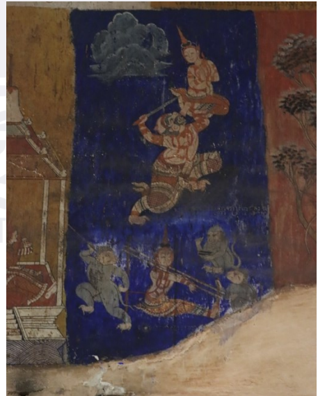
រូបលេខ១៥ ទ័ពស្វាធ្វើទារុណកម្មនាងបុញ្ញាកាយរកការពិត មុននឹងព្រះរាមចាត់ឱ្យហនុមានជូននាងទៅក្រុងលង្ការ