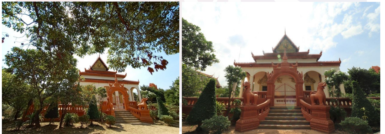
រូបលេខ១-២ ព្រះវិហារវត្តរាជបូណ៌ក្រោយជួសជុលរួចរាល់ជាស្ថាពរ

ស្ថិតនៅតាមបណ្តោយដងស្ទឹង ចំកណ្តាលក្រុងសៀមរាប មានវត្តជាច្រើនកសាងឡើងប្រកបដោយទឹកដៃសិល្បៈយ៉ាងវិសេសក្រៃលែង។ ក្នុងបណ្តាវត្តទាំងអស់នោះ វត្តរាជបូណ៌ (ឬវត្តបូណ៌) ១ ជាវត្តដែលមានព្រះវិហារដ៏ចំណាស់មួយស្ថិតនៅត្រើយខាងកើតនៃដងស្ទឹង។ អ្នកស្រាវជ្រាវទូទៅយល់ថា ព្រះវិហារវត្តរាជបូណ៌កសាងឡើងតាំងពីដើមសតវត្សទី២០ ហើយជាព្រះវិហារដែលមានគំនូរឫកណារឿងរាមកេរ្តិ៍ គួរលើកព្រះឈ្មោះជាងគេនៅកម្ពុជា។ ២ ដោយមើលឃើញតម្លៃនៃសំណង់ខាងលើ ចាប់ពីឆ្នាំ២០១៧ ពុទ្ធបរិស័ទនិងព្រះសង្ឃ សហការជាមួយអាជ្ញាធរជាតិអប្សរា បានរៀបចំជួសជុលលើកតម្លៃជាសំណង់បេតិកភណ្ឌស្របតាមគោលការណ៍អភិរក្សរបស់រាជរដ្ឋាភិបាលរហូតបញ្ចប់នៅឆ្នាំ២០២១ (រូបលេខ១-២)។