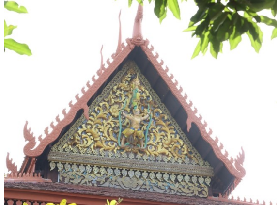
រូបលេខ៦ ហោជាងខាងកើត