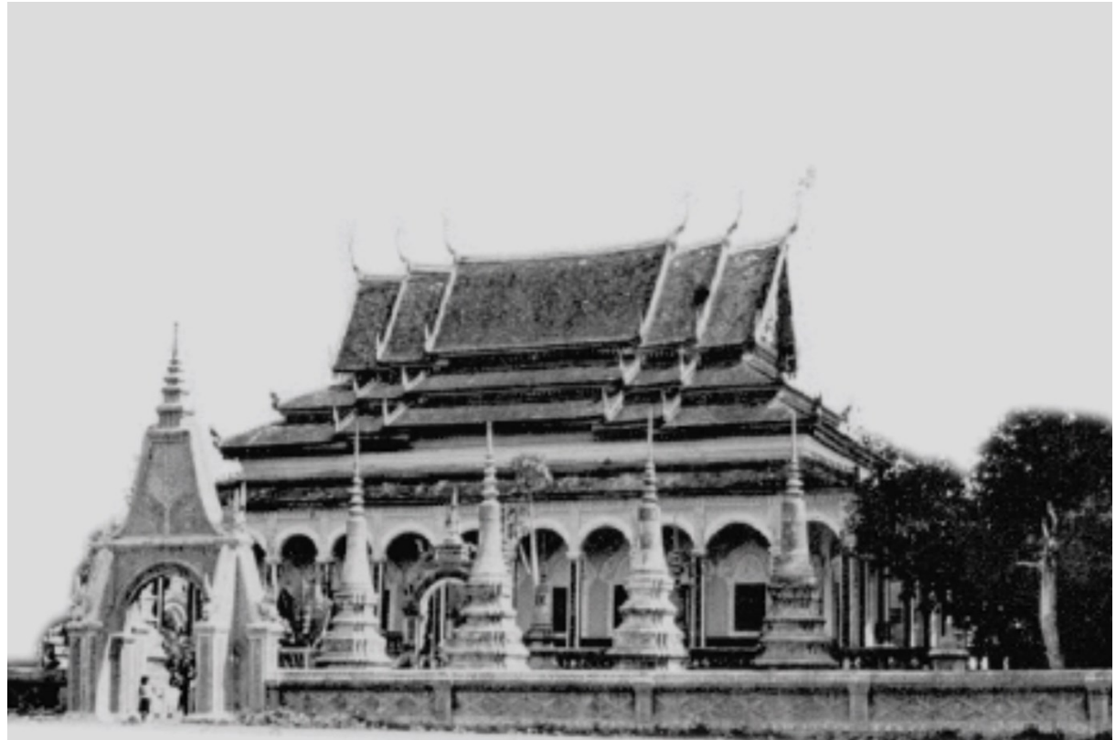
រូបលេខ៣ ព្រះវិហារវត្តរាជបូណ៌មុនសម័យកម្ពុជាប្រជាធិបតេយ្យ (រូបថត៖ Madelein Giteau)

និងជាវត្តដ៏ជាងគេបង្អស់នៅក្នុងទីរួមខេត្ត។ ៧ ចំពោះព្រះវិហារ កសាងឡើងអំពីឥដ្ឋបូក កំបោរបាយអ និងមានគ្រឿងបង្ហំឈើ។ អ្នកស្រាវជ្រាវបានចាត់ទុកថា ព្រះវិហារវត្តរាជបូណ៌ គឺជាប្រភេទព្រះវិហារព្រះវិហារជហ្វាង (រូបលេខ៣)។ ៨ មិនតែប៉ុណ្ណោះ នៅតាមសន្លឹកទ្វារ បង្អួច និងក្បាច់ស៊ុមទ្វារ-បង្អួចជុំវិញ សុទ្ធតែធ្លាក់លម្អដោយក្បាច់រចនាយ៉ាងវិចិត្រគួរឱ្យ កោតសរសើរ។