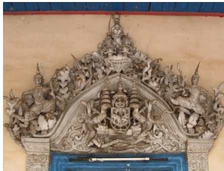
រូបលេខ៩ ព្រះលញ្ឆករដែលស្រដៀងព្រះវិហារវត្តជំរិស