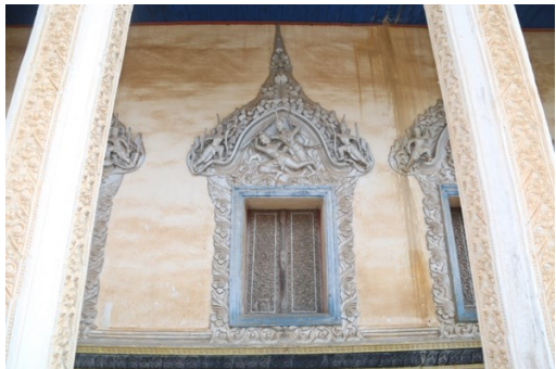
រូបលេខ៨ ក្បាច់លម្អតាមបង្អួច

ដោយឡែក ការលម្អលើជញ្ជាំង ទ្វារ និងបង្អួច គេសង្កេតឃើញមានក្បាច់រចនាធ្លាក់អំពីស៊ីម៉ង់ត៍យ៉ាងរស់រវើក។ លើសពីនេះ ការលម្អនៅតាមស៊ុមទ្វារនិងបង្អួចនីមួយៗ គេធ្លាក់ជារូបតួអង្គផ្សេងៗក្នុងរឿងរាមកេរ្តិ៍ ដែលឈុតខ្លះហាក់ដូចជាបង្ហាញពីការប្រយុទ្ធតតាំងគ្នា។ អ្វីដែលកាន់តែពិសេសជាងនេះ នៅលើស៊ុមទ្វារគេសង្កេតឃើញមានធ្លាក់រូបព្រះលញ្ឆករ មានលក្ខណៈស្រដៀងទៅនឹងការធ្លាក់នៅវត្តជំរិស ក្នុងខេត្តបាត់ដំបង ដែលអ្នកខ្លះយល់ថាគំណាងឱ្យស្តេចសៀម។ ក្បាច់ និងចម្លាក់លម្អទាំងអស់នេះ គេលាបពណ៌ទឹកប្រាក់ (រូបលេខ៨-៩)។ រីឯការលម្អលើសន្លឹកទ្វារ និងបង្អួចនីមួយៗ គេធ្លាក់ជារូបក្បាច់រចនា ព្រមទាំងរូបយក្ស សត្វ និងទេពនិករផ្សេងៗ។ ប៉ុន្តែក្រោយជួសជុលរួចរាល់ ក្បាច់លម្អតាមស៊ុមទ្វារ និងបង្អួចនីមួយៗបានលាបពណ៌ទឹកមាសជំនួសវិញ (រូបលេខ១០)។ សូមបញ្ជាក់ថា ព្រះវិហារវត្តរាជបូណ៌នេះមានទ្វារខាងមុខ៣ ទ្វារខាងក្រោយ២ និងបង្អួចនៅចំហៀងសងខាងសរុបចំនួន១៨។