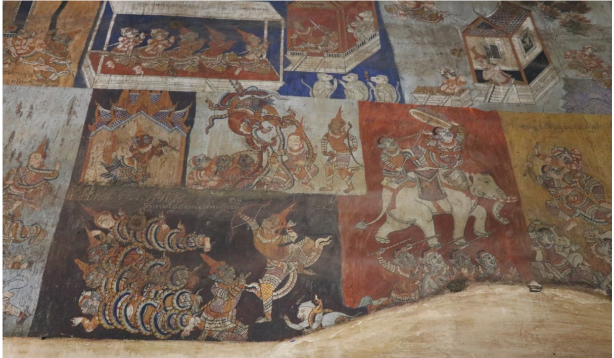
រូបលេខ១៣ ការគូរឈុតផ្សេងៗដែលបែងចែកតាមផ្នែកគំនូរ

ទៅក្នុងឈុតខ្លះៗ ចំពោះការលើកយករឿងរាមកេរ្តិ៍មកគូរលើជញ្ជាំងព្រះវិហារនេះ គេសម្មាន់ថាអ្នកស្រុកតំបន់អាស៊ីខ្លះចាត់ទុកព្រះរាមជាព្រះពោធិសត្វ។ ៥