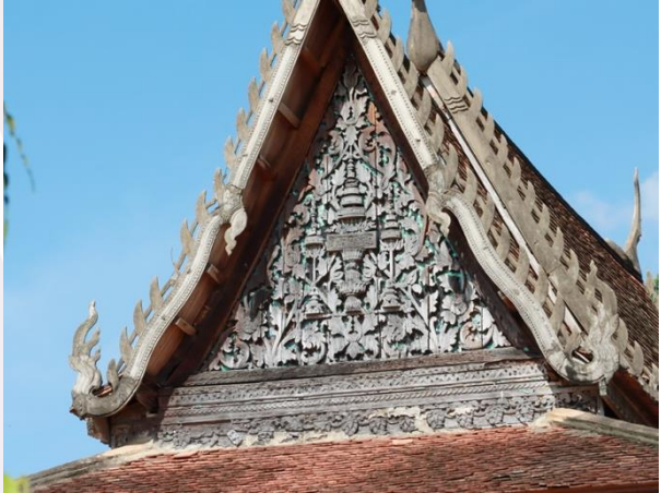
រូបលេខ២ ក្បាច់លម្អលើផ្ទៃហោជាងខាងកើត