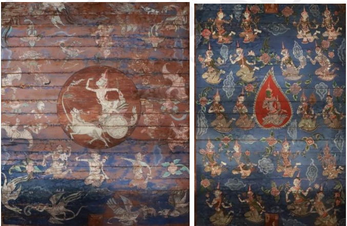
រូបលេខ១០-១១ គំនូរផ្សេងៗលើពិធាន