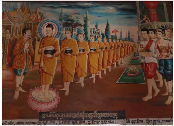
រូបលេខ១២ កាលព្រះអង្គទ្រង់ប្រសូត