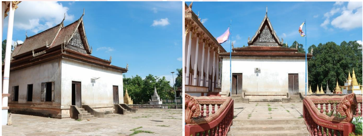
រូបលេខ២-៣ ព្រះវិហារចាស់វត្តកណ្តាល មើលពីជ្រុងពាយ័ព្យ និងមើលពីខាងលិច

ព្រះវិហារចាស់ក្នុងវត្តកណ្តាល សង់នៅលើខឿនកម្ពស់ត្រឹមចង្កេះ ទទឹងប្រហែល ៩ម៉ែត្រកន្លះ និងបណ្តោយប្រហែល១៩ម៉ែត្រកន្លះ។ ព្រះវិហារនេះសង់អំពីឈើ ជញ្ជាំង រៀបតដួ ជាប្រភេទព្រះវិហារជប្បាបួន ដំបូលប្រក់ក្បឿងស្រកាលេញ។ ប៉ុន្តែបច្ចុប្បន្នព្រះ វិហារខាងលើកំពុងស្ថិតក្នុងសភាពទ្រុឌទ្រោម ពុកផុយ ខូចទាំងទ្វារនិងបង្អួចដោយអន្លើ។ (រូបលេខ២-៣)។ បើយោងតាមការសិក្សារបស់ Danielle និង Dominique-Pieree Guéret យល់ថាព្រះវិហារចាស់វត្តកណ្តាលកសាងក្នុងឆ្នាំ១៩០៩ ហើយគំនូរលើជញ្ជាំងគូរនៅ ក្នុងឆ្នាំ១៩៦៤។ 1 ប៉ុន្តែបើយោងតាមផ្ទាំងចារឹកមួយចារជាប់បង្អួចព្រះដីវី ទីវត្តនេះកសាង តាំងពីពុទ្ធសករាជ២៤៣៨ (ឆ្នាំ១៨៩៥) ហើយព្រះវិហារកសាងក្នុងឆ្នាំ១៩០០។ មិនតែ ប៉ុណ្ណោះ នៅលើជញ្ជាំងខាងកើត មានចំណារមួយផ្ទាំងតូចទៀតដែលមានសេចក្តីខ្លីថា “បានរូស(រុះ)រើជញ្ជាំងចាស់ធ្វើជាថ្មីឡើងវិញពីឆ្នាំម្សាញ់ សប្តស័ក ព.ស.២៥០៨”។ តាម សេចក្តីនេះមានន័យថា ជញ្ជាំងព្រះវិហារសព្វថ្ងៃរុះរើរៀបថ្មីក្នុងឆ្នាំ១៩៦៥។