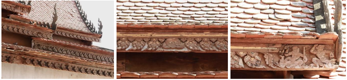
រូបលេខ៦-៨ ក្បាច់លម្អ និងការឆ្លាក់រូបផ្សេងៗនៅលើរាងស្បូវ

ចំណែកខាងក្នុងព្រះវិហារ មានសសរឈើ៣២ដើម សង់ឡើងជាបីល្វែង ពោលគឺ ល្វែងគ្រឹះនៅកណ្តាល និងរបៀងសងខាង (រូបលេខ៩)។ នៅចុងខាងលិចល្វែងគ្រឹះ មានបល្ល័ង្កខ្ពស់មួយយ៉ាងល្អវិចិត្រតម្កល់ព្រះបដិមាព្រះជីវ័ធំ។ ខ្សែបល្ល័ង្ក មានគំនូរពាក់ព័ន្ធរឿងពុទ្ធប្រវត្តិ និងចំណារសារបានវត្តចារនៅខាងមុខ ដែលនាំឱ្យដឹងថាព្រះជីវ័សព្វថ្ងៃកសាងឡើងវិញក្នុងឆ្នាំ១៩៨១។ ចំណុចពិសេសនៃបល្ល័ង្កនេះ គឺនៅលើតួបល្ល័ង្ករចនាជាក្បាច់ភ្លើ និងរូបផ្សេងៗតាមរបៀប “គំនូរបុក” ដែលឃើញនិយមក្នុងសិល្បៈខ្មែរតាំងពីដើមសតវត្សរ៍ទី២០ (រូបលេខ១០)។ ២ ចំពោះពិធានព្រះវិហារនេះ គឺជាពិធានឈើដែលរៀបចំឡើងតែលើចន្លោះល្វែងគ្រឹះប៉ុណ្ណោះ។ គំនូរនៃពិធាន ជាប្រភេទគំនូរបុរាណដែលអ្នកខ្លះយល់ថាគួរទន្ទឹមពេលគ្នានឹងការសង់ព្រះវិហារ។ ប្រធានបទសំខាន់ៗគួរលើពិធាន គឺរូបព្រះអាទិត្យ ព្រះចន្ទ្រ និងទេពនិករនានាលើអាកាស (រូបលេខ១១)។ ៣