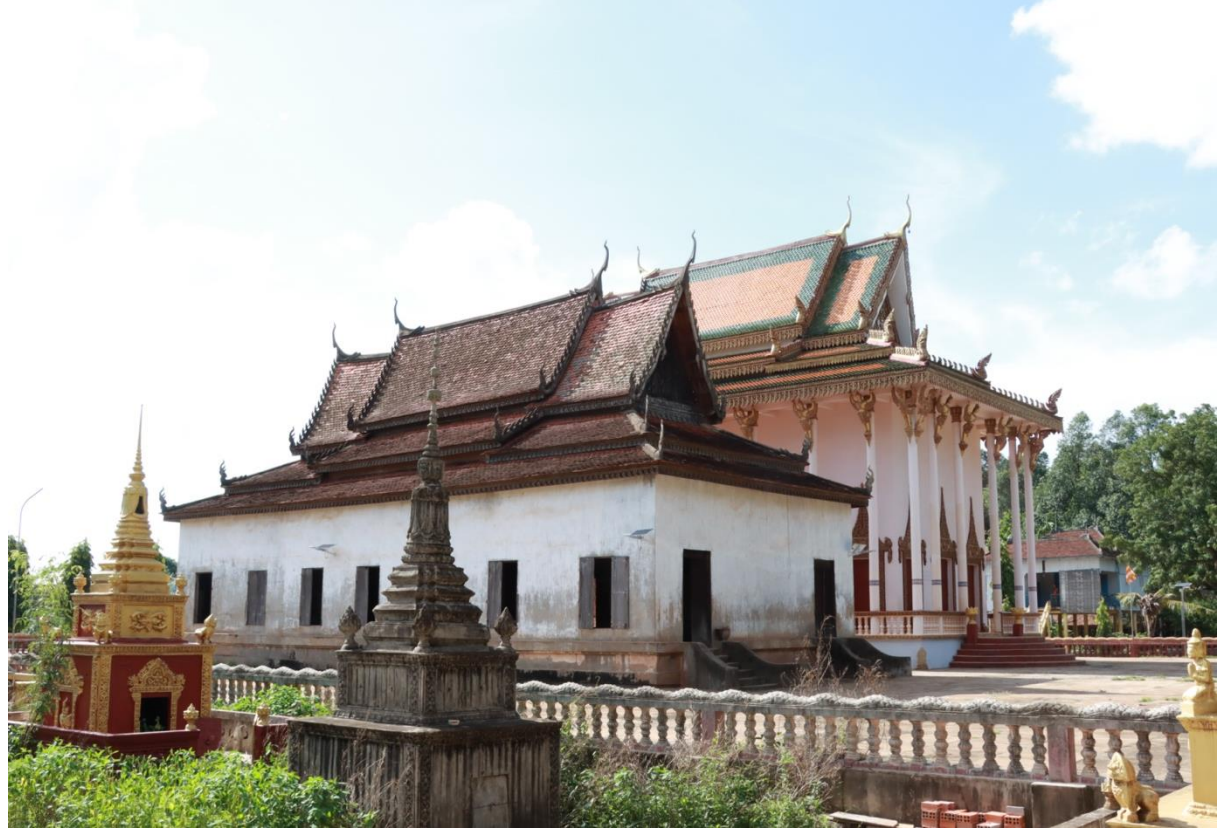
រូបលេខ១ ព្រះវិហារចាស់នៅវត្តកណ្តាល មើលពីជ្រុងអាគ្នេយ៍

វត្តកណ្តាល ឬហៅថាវត្តសំរិទ្ធិជយារាម ស្ថាបនាឡើងនៅប្របតាមជងទន្លេធំ (ទន្លេមេគង្គ) ស្ថិតក្នុងឃុំកោះអណ្តែត ស្រុកស្រីសន្ធរ ខេត្តកំពង់ចាម។ បើផ្អែកតាមចំណារនៅខាងមុខបង្គោលព្រះជីវ័ឱ្យដឹងថា វត្តនេះមានឈ្មោះដើមហៅ "វត្តចុងកោះអណ្តែត"។ បច្ចុប្បន្ននៅក្នុងបរិវេណវត្តមានព្រះវិហារពីរទន្ទឹមគ្នា កសាងជាប់លើខឿនតែមួយ (រូបលេខ១)។ ព្រះវិហារចាស់ស្ថិតនៅខាងត្បូង ជាព្រះវិហារដែលមានសសរឈើ និងគំនូរបុរាណគួរលើពិភពឈើយ៉ាងល្អវិចិត្រ ហើយអ្នកស្រាវជ្រាវយល់ថាព្រះវិហារនេះកសាងឡើងតាំងពីដើមសតវត្សរ៍ទី២០។ នៅក្នុងសម័យសង្គមរាស្ត្រនិយម ពុទ្ធបរិស័ទបានរួមគ្នាជួសជុលកែលម្អព្រះវិហារនេះម្តង ហើយរហូតដល់ក្រោយសម័យកម្ពុជាប្រជាធិបតេយ្យ (ប៉ុល ពត) ព្រះវិហារនេះបានជួសជុលម្តងទៀត។ ប៉ុន្តែក្រោយកសាងព្រះវិហារថ្មីរួចមក ព្រះវិហារចាស់ដែលមានអាយុកាលជាង១សតវត្សរ៍នេះ ហាក់ដូចជាពុំមានតួនាទីសំខាន់សម្រាប់រៀបចំពិធីបុណ្យទានតូចធំ ឬការគោរពបូជាផ្សេងៗដូចបុរាណកាលឡើយ។