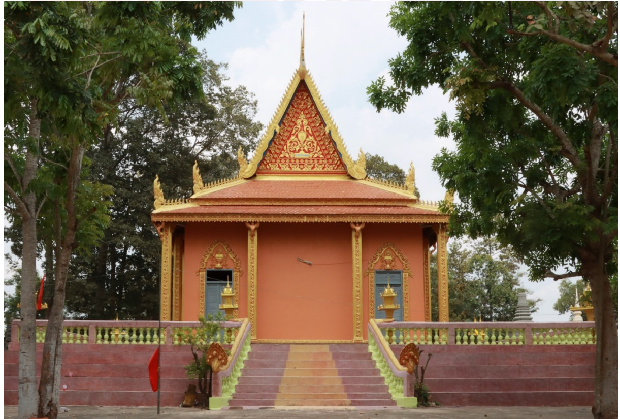
រូបលេខ១ ព្រះវិហារវត្តស្រែរនោងក្រោយជួសជុលដំបូលរួចរាល់ (មើលពីទិសខាងលិច)

វត្តស្រែរនោង កសាងនៅលើទីទួលតូចកណ្តាលភូមិអ្នកស្រុក ស្ថិតនៅក្នុងឃុំស្រែរនោង ១ ស្រុកត្រាំកក់ ខេត្តតាកែវ។ វត្តនេះ គឺជាវត្តស្ថិតនៅតំបន់ជនបទដាច់ស្រយាល ដែលមានព្រះវិហារចាស់មួយ កសាងឡើងតាំងពីដើមសម័យសង្គមរាស្ត្រនិយម។ បើគិតមកដល់បច្ចុប្បន្ន ព្រះវិហារវត្តស្រែរនោងមានអាយុកាលជាង៧០ឆ្នាំ ហើយបានឆ្លងកាត់សង្គ្រាមជាច្រើនជំនាន់។ ប៉ុន្តែបើផ្អែកតាមការសាកសួរ និងចំណារសារបានវត្តឱ្យដឹងថា អ្នកស្រុកតែងមូលមាត់គ្នាជួសជុលថែទាំព្រះវិហារដែលជាមត៌កដូនតារបស់ខ្លួននេះជាបន្តបន្ទាប់ ហើយការជួសជុលចុងក្រោយដោយកម្លាំងសទ្ធាពុទ្ធបរិស័ទជិតព្រួយ គឺក្នុងឆ្នាំ ២០២១-២០២២ ដោយជួសជុលផ្នែកដំបូល ហោជាង និងជញ្ជាំង (រូបលេខ១)។