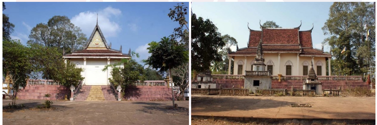
រូបលេខ២-៣ ព្រះវិហារវត្តស្រែរនោងមុនជួសជុល (ថតឆ្នាំ២០១២)