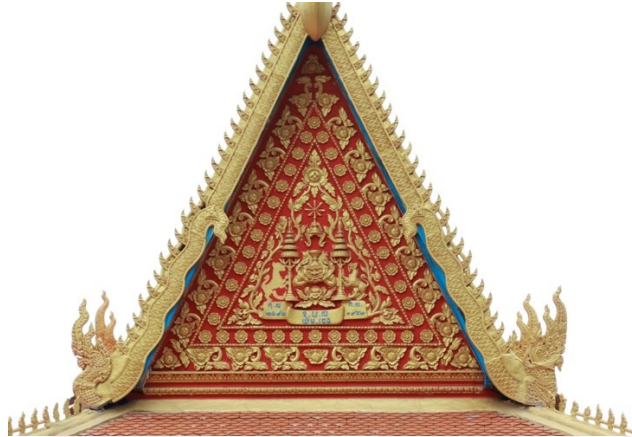
រូបលេខ៦ ហោជាងខាងកើត

១៩៥២។ ចំណែកលើផ្ទៃហោជាងខាងលិច គេរចនាលម្អដោយក្បាច់ផ្កាភ្លឺផ្សេងៗ ជុំវិញរូប ផ្លិតយសដែលនៅកណ្តាល (រូបលេខ៧)។ នៅផ្នែកខាងក្រោមផ្លិតយសនោះ គេចារឹក ពាក្យមួយឃ្លាខ្លី “ព.ស.២២៩៣”។ ដូច្នេះតាមរយៈសំណេរលើហោជាងទាំងពីរបញ្ជាក់ថា ឆ្នាំទាំងនោះជាកាលបរិច្ឆេទសាងហោជាង បន្ទាប់ពីព្រះវិហារផ្ដើមសង់តាំងពីឆ្នាំ១៩៤៩។