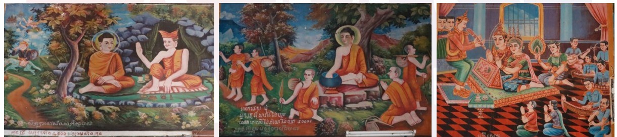
រូបលេខ១០-១២ គំនូរខ្លះៗក្នុងព្រះវិហារវត្តស្រែរនោង

ចំណែកឯគំនូរខាងក្នុងព្រះវិហារ គឺជាគំនូរបង្ហាញពីខ្សែរឿងក្នុងពុទ្ធប្រវត្តិនិងរឿង ជាតកផ្សេងៗដូចបណ្តារវត្តនានាដែរ។ សាច់រឿងផ្ដើមចេញពីជញ្ជាំងខាងកើត ព័ទ្ធរាយ មកជញ្ជាំងខាងត្បូង ទៅជញ្ជាំងខាងលិច និងបញ្ចប់សាច់រឿងត្រង់ព្រះអង្គបរិនិព្វាននៅ លើជញ្ជាំងខាងកើតដែរ។ រីឯគំនូរលើពិភាន គឺជាគំនូរថ្មីគូរក្នុងរវាងទសវត្សទី៩០។ ប៉ុន្តែ យ៉ាងណាក្ដី តាមរយៈគំនូរនៅលើជញ្ជាំងក្នុងព្រះវិហារនេះ យើងអាចសង្កេតឃើញ លក្ខណៈពិសេសខ្លះពាក់ព័ន្ធនឹងសង្គមសេដ្ឋកិច្ច និងវប្បធម៌ខ្មែរក្នុងគ្រានោះដែរ។ គំនូរ មួយផ្ទាំងទំហំប្រហែល៤ម៉ែត្រក្រឡាមានតម្លៃរវាង៤៥០០៛ ទៅ៥០០០៛។ ចំពោះលក្ខណៈ ដែលគួរឱ្យកត់សម្គាល់មួយទៀតក្នុងផ្ទាំងគំនូរ គឺការបញ្ចូលទម្រង់ភ្លេងមួយបែប ដែល មានឧបករណ៍តន្ត្រីបុរាណដូចជា គង រនាត ចាប៉ូ ទ្រូ និងខ្យង(?) នៅក្នុងផ្ទាំងគំនូរនិយាយ ពីពិធីរៀបអភិសេក (រូបលេខ១០-១២)។