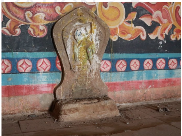
រូបលេខ៩ សន្លឹកសីមាតម្កល់ក្នុងព្រះវិហារ