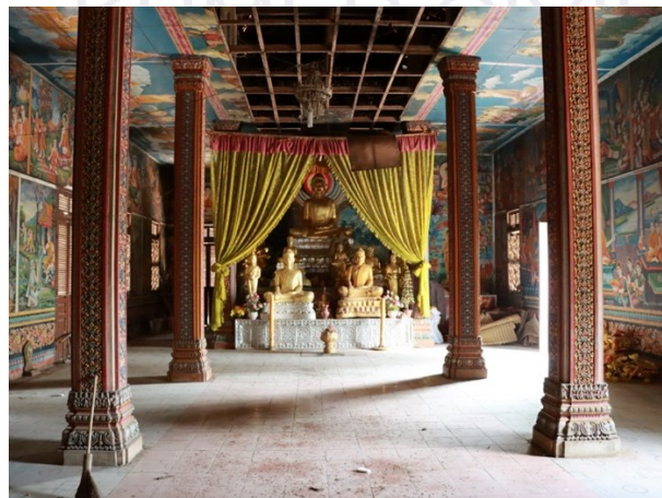
រូបលេខ៨ ផ្នែកខាងក្នុងព្រះវិហារ (អំឡុងពេលជួសជុល)

ដោយឡែកនៅផ្នែកខាងក្នុងព្រះវិហារ តម្កល់ព្រះពុទ្ធបដិមាព្រះជីវ័រនៅចន្លោះលែង គ្រឹះចុងខាងលិច (រូបលេខ៨)។ រីឯនៅតាមជើងជញ្ជាំងជុំវិញ នៃផ្នែកខាងក្នុងព្រះវិហារ គេឃើញមានបញ្ចុះសន្លឹកសីមាទិសទាំងបួន (រូបលេខ៩)។ សន្លឹក សីមាខ្លះ គេធ្លាក់ជារូបនាងគង្គីងច្បូតសក់ ហើយខ្លះទៀតធ្លាក់រូបទេពប្រណម។ លក្ខណៈ បែបនេះគេធ្លាប់ឃើញនៅព្រះវិហារបុរាណមួយចំនួនក្នុងខេត្តសៀមរាបដូចជា ព្រះវិហារ វត្តដំណាក់ និងព្រះវិហារវត្តរាជបូព៌ជាដើម។