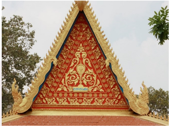
រូបលេខ៧ ហោជាងខាងលិច

ដោយឡែកនៅផ្នែកខាងក្នុងព្រះវិហារ តម្កល់ព្រះពុទ្ធបដិមាព្រះជីវ័រនៅចន្លោះលែង គ្រឹះចុងខាងលិច (រូបលេខ៨)។ រីឯនៅតាមជើងជញ្ជាំងជុំវិញ នៃផ្នែកខាងក្នុងព្រះវិហារ គេឃើញមានបញ្ចុះសន្លឹកសីមាទិសទាំងបួន (រូបលេខ៩)។ សន្លឹក សីមាខ្លះ គេធ្លាក់ជារូបនាងគង្គីងច្បូតសក់ ហើយខ្លះទៀតធ្លាក់រូបទេពប្រណម។ លក្ខណៈ បែបនេះគេធ្លាប់ឃើញនៅព្រះវិហារបុរាណមួយចំនួនក្នុងខេត្តសៀមរាបដូចជា ព្រះវិហារ វត្តដំណាក់ និងព្រះវិហារវត្តរាជបូព៌ជាដើម។