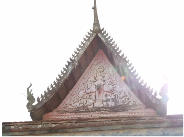
រូបលេខ៥-៦ ហោជាងខាងកើត និងស្ថានភាពបច្ចុប្បន្ន