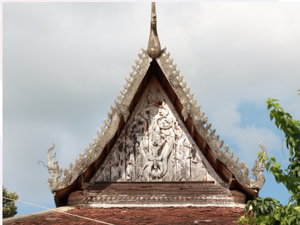
រូបលេខ៧-៨ ហោជាងខាងលិច (រូបថត EFEO ឆ្នាំ១៩២៧) និងស្ថានភាពបច្ចុប្បន្ន

នៅផ្នែកខាងក្នុងព្រះវិហារ គេសង់ឡើងដោយមានសសរឈើយ៉ាងប្រណីតចំនួន ៤ជួរ ទុកល្វែងគ្រឹះធំទូលាយមួយនៅកណ្តាល អមដោយរបៀងសងខាង តែពុំមាន បាំងសាចឡើយ ពោលគឺធ្វើជញ្ជាំងជិតជុំវិញតែម្តង (រូបលេខ៧) ៥ ចំពោះសសរ (៤ដើម អមបល្ល័ង្កព្រះជីវ) និងគ្រឿងបង្កើនឈើនៅផ្នែកខាងលើដូចជា ធ្នឹម ផ្ទោង ផ្ទាន និងបង្កង់ សុទ្ធតែរចនាទីបមាសទាំងអស់។ ប៉ុន្តែគួរឱ្យស្តាយ សព្វថ្ងៃមានផ្នែកខ្លះត្រូវកណ្តៀរចាប់ ផ្តើមស៊ុបផ្ទាញ និងពូនដីបន្តិចម្តងៗ ទន្ទឹមគ្នានឹងការរលេះរកក្បាច់ទីបមាសទាំងនោះជា បណ្តើរៗ (រូបលេខ១០)។ ចំណែកព្រះជីវក្នុងព្រះវិហារនេះ តម្កល់នៅលើបល្ល័ង្កយ៉ាងខ្ពស់ មួយនៅចុងខាងលិចល្វែងគ្រឹះ តែជាព្រះជីវថ្មីកសាងឡើងនៅក្នុងឆ្នាំ១៩៨០។