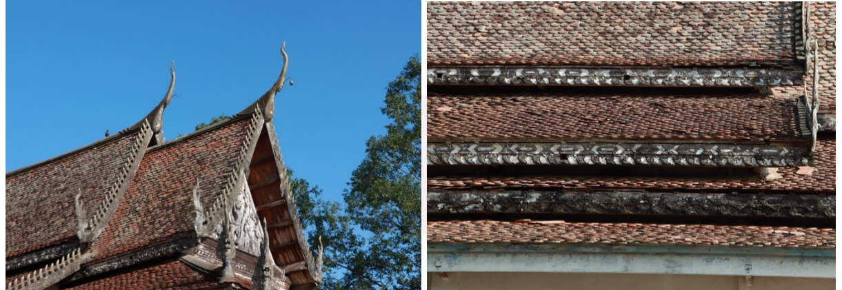
រូបលេខ៣ ជហ្វា និងនាគចែង (ផ្នែកខាងក្រោយ) រូបលេខ៤ ក្បាច់លម្អលើរងស្បូវ

ដោយឡែកចំពោះរចនាសម្ព័ន្ធគ្រឿងបង្កើតផ្នែកខាងលើ គេឃើញសាងឡើងដោយ មានស្លាបដំបូលជ្រាលចុះជាថ្នាក់ៗ លម្អដោយជហ្វាពីរនៅចុងមេដំបូលខាងមុខ ជហ្វាពីរ ទៀតនៅចុងមេដំបូលខាងក្រោយ ដូចព្រះវិហារបុរាណដទៃទៀតដែរ។ នៅតាមចុងចែង ដំបូល លម្អដោយនាគចែង (រូបលេខ៣) ហើយនៅតាមរងស្បូវជុំវិញ លម្អដោយក្បាច់ កញ្ចាំង និងក្បាច់ផ្សេងៗទៀតធ្លាក់ពីឈើបិទកញ្ចក់ (រូបលេខ៤)។