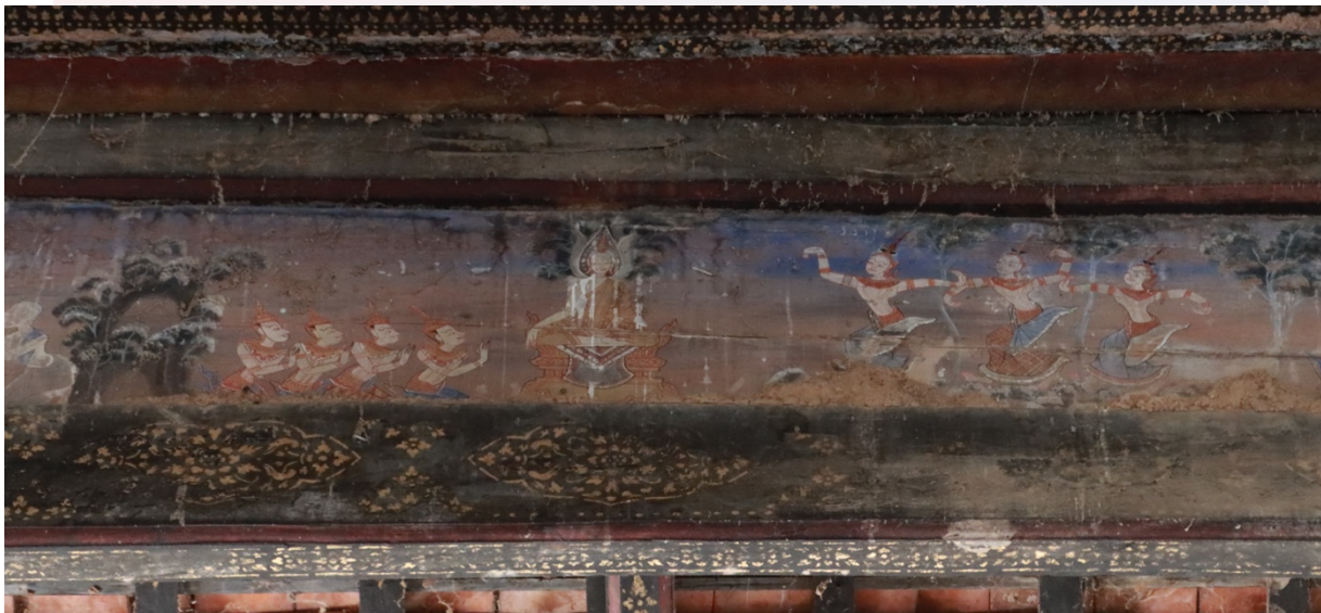
រូបលេខ១២ គំនូរពុទ្ធប្រវត្តិ "កាលព្រះអង្គផ្កាញ់កូនស្រីមារទាំងបីនាក់"