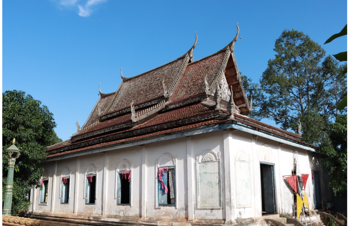
រូបលេខ១ សភាពខាងក្រៅនៃព្រះវិហារចាស់ក្នុងវត្តល្វេសព្វថ្ងៃ (ថតពីព្រះវិហារថ្មី)

នៅក្នុងស្រុកកោះសូទិន ខេត្តកំពង់ចាម មានវត្តជាច្រើនបានកសាងឡើងនៅតាមបណ្តោយដងទន្លេមួយដែលអ្នកស្រុកហៅថា “ទន្លេតូច” ២ បើរាប់ត្រួសៗវត្តបុរាណមួយចំនួននៅក្នុងតំបន់នេះមានដូចជា វត្តពង្រ វត្តជំនីក វត្តមហាលាក និងវត្តល្វេជាដើម។ មកដល់បច្ចុប្បន្ន គេសង្កេតឃើញថាក្នុងវត្តទាំងនោះ ភាគច្រើននៅមានព្រះវិហារបុរាណដែលសេសសល់ពីការបំផ្លិចបំផ្លាញក្នុងសម័យសង្គ្រាម។ ជាក់ស្តែង វត្តល្វេស្ថិតនៅត្រើយម្ខាងនៃដងទន្លេតូច គឺជាវត្តមានព្រះវិហារចាស់មួយខ្លះ មានគំនូរបុរាណយ៉ាងល្អគួរនៅលើហប់ខ្យល់ជុំវិញ។ ប៉ុន្តែបន្ទាប់ពីវត្តនេះបានកសាងព្រះវិហារដំបូងមួយទៀតកាលពីឆ្នាំ ២០០១ ព្រះវិហារចាស់ដែលនិយាយមកខាងលើ ហាក់ដូចជាត្រូវទុកចោល ពុំសូវមានការថែទាំ បោសសម្អាត ឬចូលទៅគោរពប្រតិបត្តិដូចបុរាណកាលឡើយ (រូបលេខ១)។