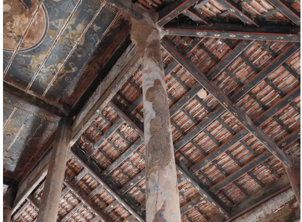
រូបលេខ៩ ផ្នែកខាងក្នុងព្រះវិហារ