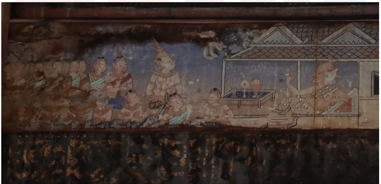
រូបលេខ១៤ គំនូរក្នុងរឿងជ័យទត្ត កាលឥសីអុជធូបទៀនផ្សង

សង្ខេបសេចក្តីមក ព្រះវិហារចាស់ក្នុងវត្តល្វេគឺជាសំណង់បេតិកភណ្ឌប្រកបដោយលក្ខណៈស្ថាបត្យកម្ម និងសិល្បៈបុរាណដ៏កម្រ។ ក្បាច់លម្អ និងគំនូរសាច់រឿងនានាក្នុងពុទ្ធប្រវត្តិ រឿងជាតក និងរឿងជ័យទត្តគួរនៅលើហប់ខ្យល់ គឺជាមូលដ្ឋានយ៉ាងសំខាន់សម្រាប់ការសិក្សាបន្ថែមទៅថ្ងៃខាងមុខ អំពីទំនាក់ទំនង និងតួនាទីសាច់រឿងព្រះពុទ្ធសាសនាក្នុងផ្នត់គំនិតខ្មែរ។