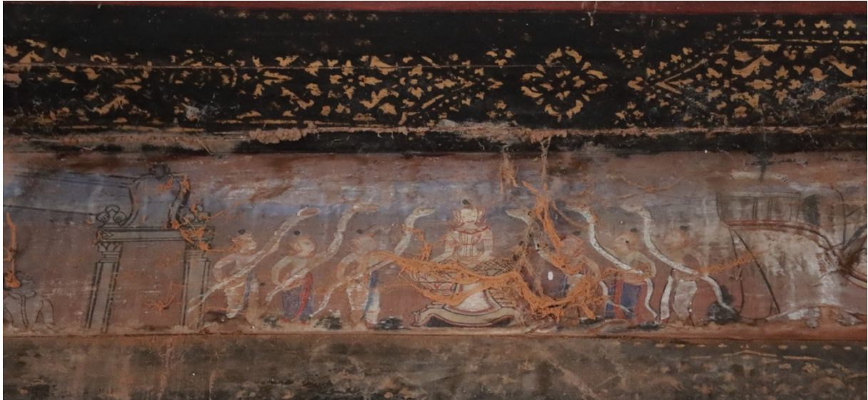
រូបលេខ១៣ គំនូរក្នុងតេមិយជាតក កាលអាមាត្យយកពស់ទៅល្បួងព្រះតេមិយ