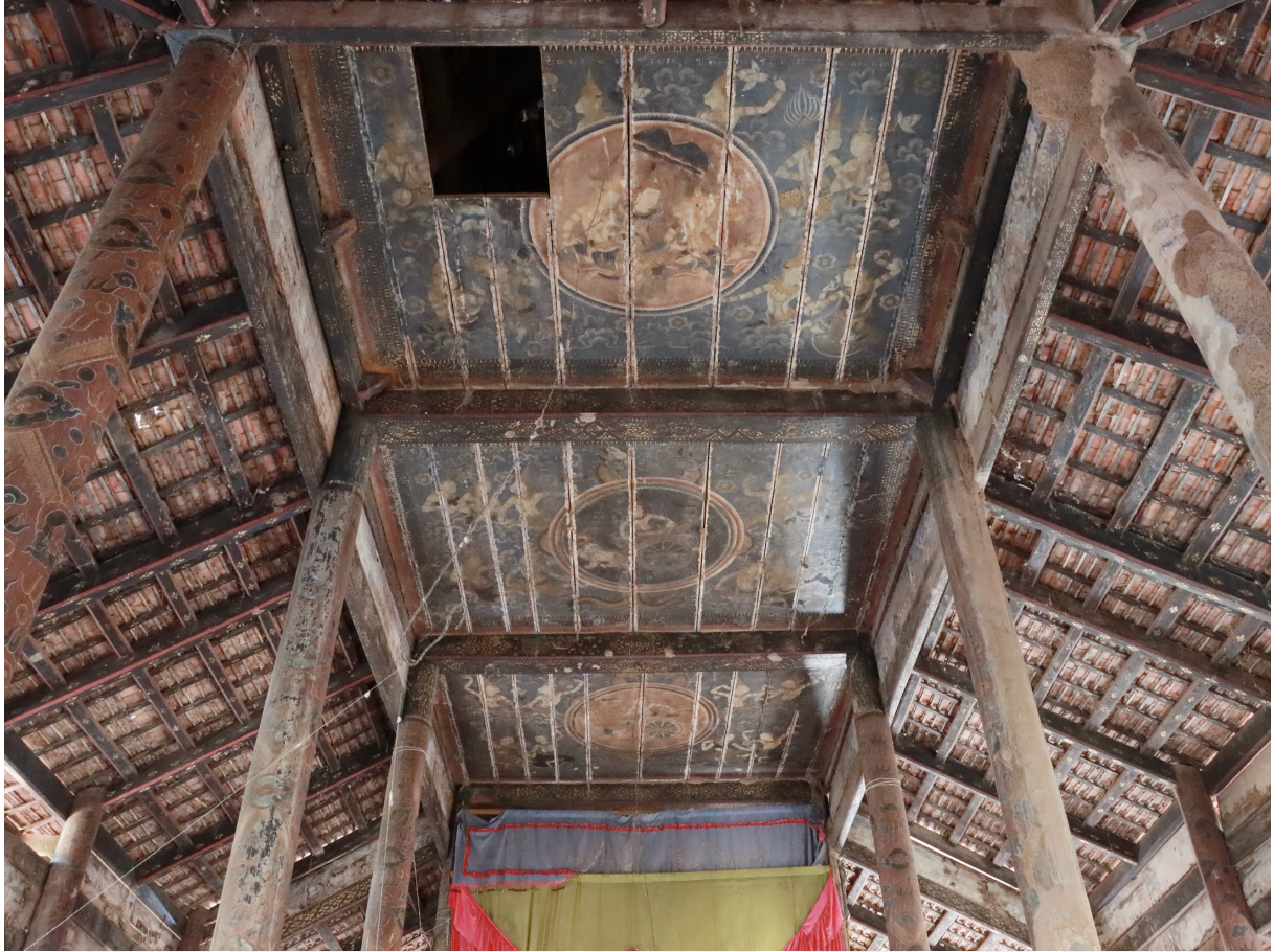
រូបលេខ១១ គំនូរព្រះអាទិត្យ ព្រះចន្ទ្រ និងទេពនិករគូរនៅលើពិភានខាងមុខព្រះជីវ