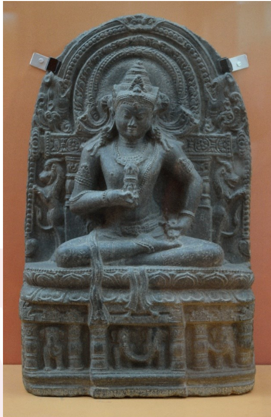
រូបភាពទី១៖ ព្រះវជ្ជសត្វក្នុងសិល្បៈបាលៈ បច្ចុប្បន្ននៅ Indian Museum (រូបថត៖ Biswarup Ganguly)

ដោយឡែកសម្រាប់សង្គមខ្មែរវិញទំនងជាបានស្គាល់ព្រះវជ្ជសត្វយ៉ាងហោចណាស់តាំងពីសតវត្សរ៍ទី១១ មកម៉្លេះ។ គេប្រទះឃើញព្រះនាមរបស់ទ្រង់មានលើកឡើងនៅក្នុងសិលាចារឹកសប្បាក ចុះលេខសម្គាល់ K.១១៥៨ សរសេរជាភាសាសំស្ក្រឹតនិងខ្មែរបុរាណ ចារឡើងនៅឆ្នាំ១០៦៦ ក្នុងរជ្ជកាលព្រះបាទឧទ័យាទិត្យវរ្ម័នទី២ (រូបភាពទី២)។ នៅក្នុងសិលាចារឹកដែលជាផ្នែកសំស្ក្រឹតត្រង់ស្លោកទី១និងទី២ បានសរសេរនមស្ការថ្វាយបង្គំចំពោះព្រះពុទ្ធទាំង៥ព្រះអង្គ (ធូរានិពុទ្ធ) និងលំដាប់ទី៦នមស្ការថ្វាយបង្គំចំពោះព្រះវជ្ជសត្វ។ ការនមស្ការព្រះវជ្ជសត្វនៅដំដាប់ទី៦នេះ ហាក់បង្ហាញថាទ្រង់មានកម្រិតស្មើនឹងព្រះធូរានិពុទ្ធទាំង៥ព្រះអង្គមុន ហេតុនេះហើយទើបមានការយល់ឃើញថាព្រះវជ្ជសត្វនៅក្នុងសិលាចារឹកនេះទំនងមានឋានៈជាព្រះធូរានិយពុទ្ធអង្គទី៦ ៥ ។