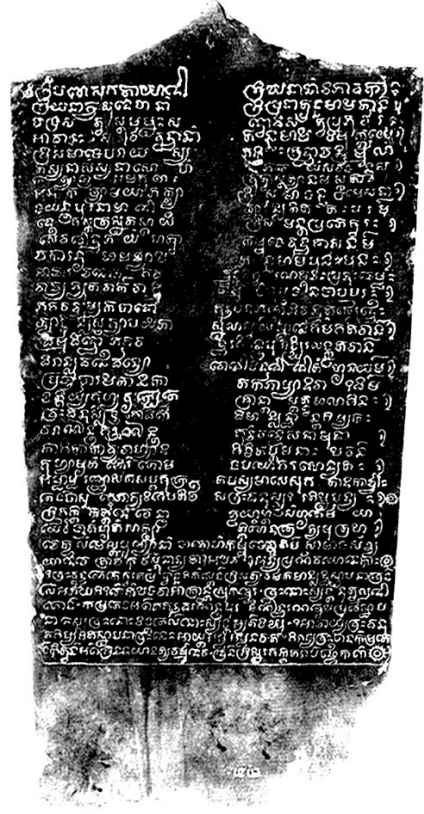
រូបភាពទី២៖ សំណៅសិលាចារឹកសប្បាក (សំណៅ៖ ទ្វារខ្សែច្រកទឹកក្រវាត់ប្រាសាទបាវ្យាត ខេត្តកំពង់ចាម)

តាមរយៈព័ត៌មាននេះធ្វើឱ្យយើងដឹងថា សង្គមខ្មែរសម័យអង្គរទំនងជាបានលើកព្រះវង្សសត្វឱ្យមានឋានៈជាព្រះធានីពុទ្ធអង្គទី៦ដូចនៅក្នុងប្រទេសនេប៉ាល់ដែរ។