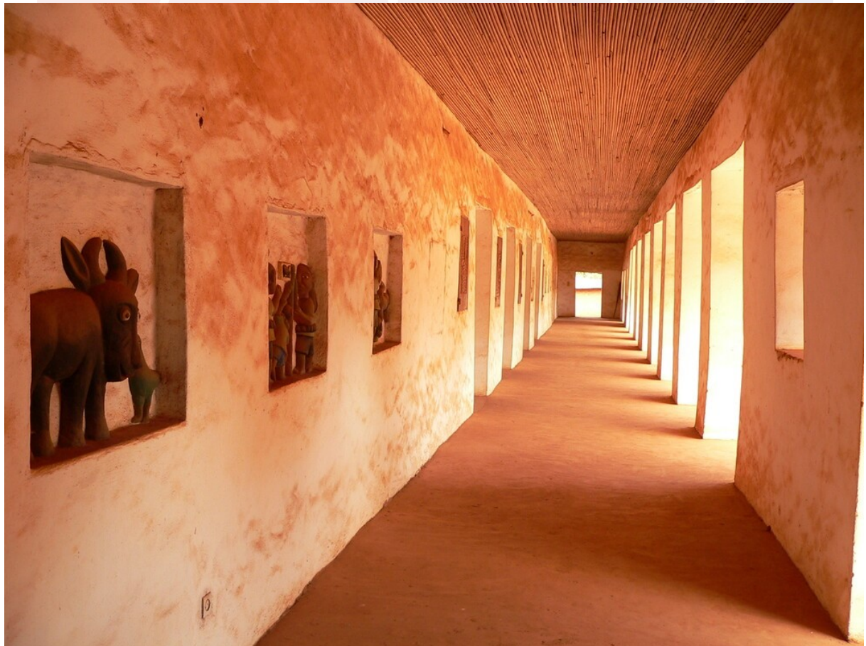
រូបលេខ៣៖ វាំងអាបូមី