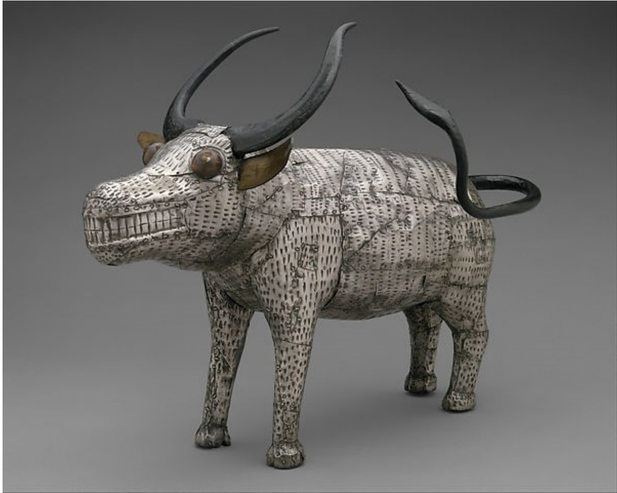
រូបលេខ៤៖ រូបចម្លាក់ដីពីលោហ