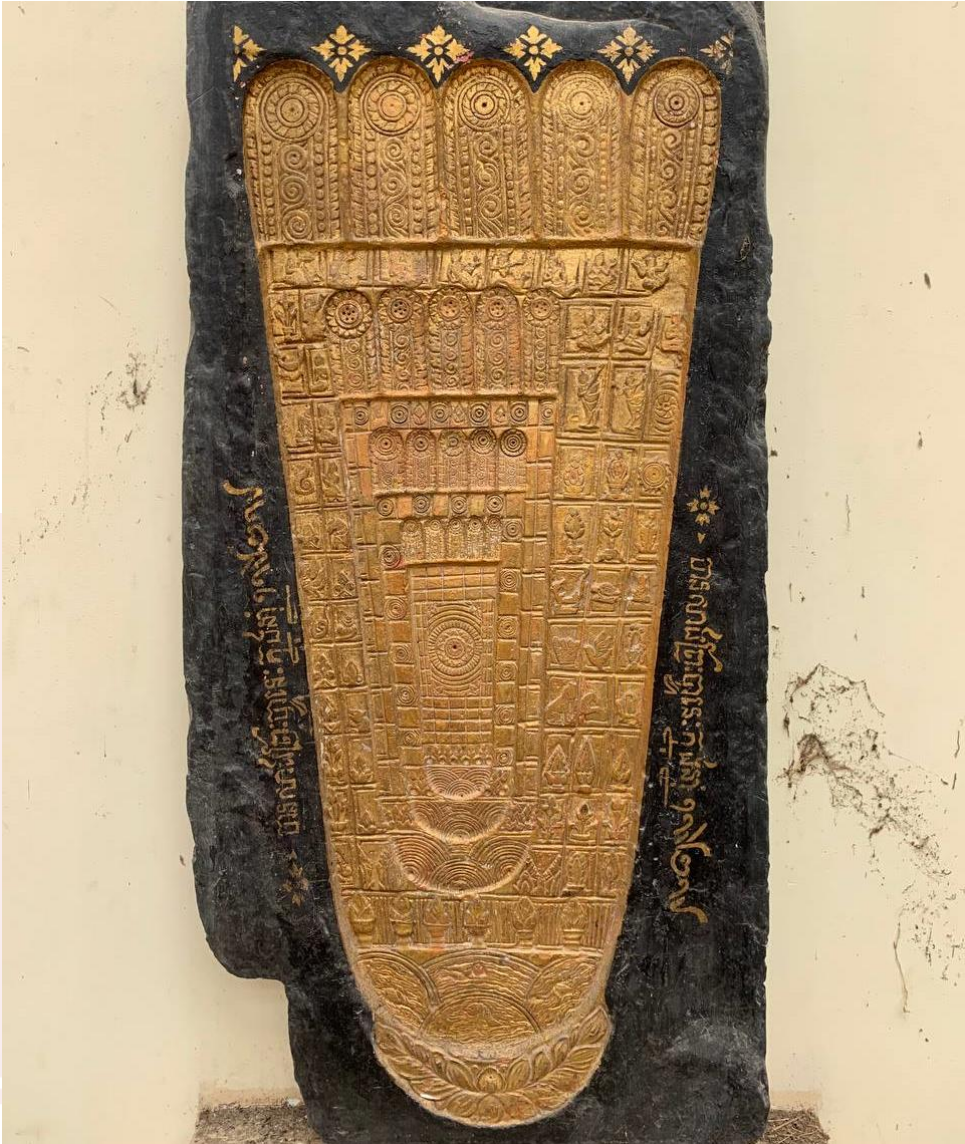
រូបលេខ១៣