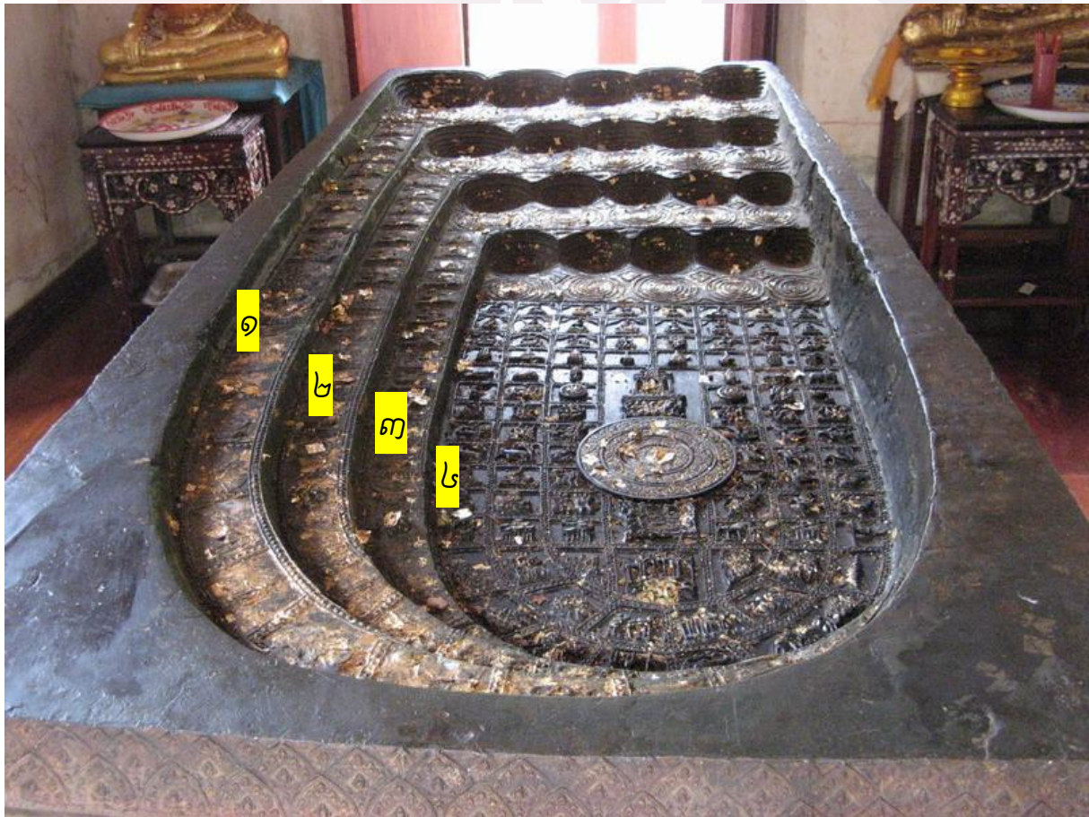
រូបលេខ៩