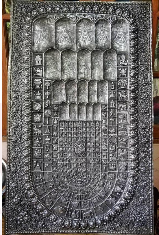
រូបលេខ៦ប្រកពន្ធរយបរវេទបុរាណបាទារបស់ព្រះពុទ្ធត្រួតលើគ្នា៤

ពុទ្ធបាទម្យ៉ាងទៀតគឺពុទ្ធបាទស្បត្តិដែលជាស្នាមបាទារបស់ព្រះពុទ្ធត្រួតលើគ្នា៤ ជាន់មានរូបចក្រកណ្តាលព្រះបាទរូបមង្គល១០៨នៅជុំវិញ(រូបលេខ៦)។