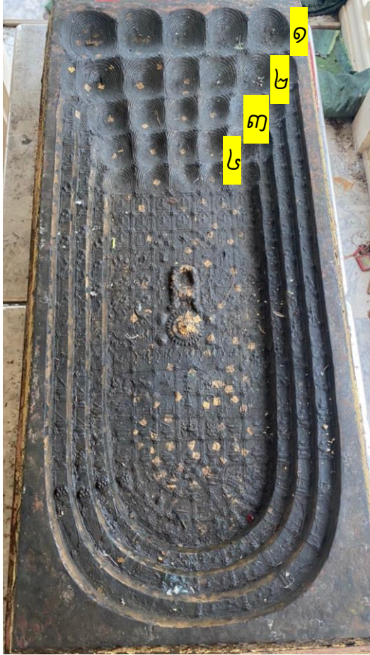
រូបលេខ១០ ប្រភព៖