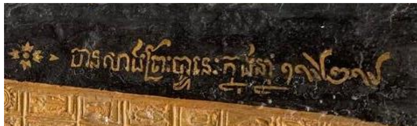
រូបលេខ១២៖ បានសាងព្រះបាទនេះក្នុងឆ្នាំ១៩២៩

ពុទ្ធសិល្បៈពុទ្ធបាទនៅប្រទេសខ្មែរ ទើបតែប្រទះឃើញនៅពាក់កណ្តាលសតវត្សរ៍ ទី២០ ក្នុងបណ្ណាល័យវត្តទិយវ័ន(ព្រៃវែង)ស្ថិតនៅសង្កាត់ពងទឹកខណ្ឌដង្កោ រាជធានីភ្នំពេញ (អតីតបុរាណដ្ឋាន)ប្រភេទថ្មប្លើមអណ្តើកសាងឡើងនៅឆ្នាំ១៩២៩។ (រូបលេខ១២,១៣)។