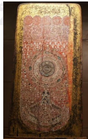
រូបលេខ៥ប្រភព៖