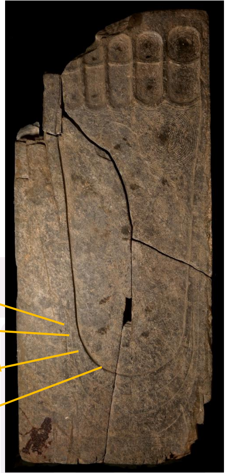
រូបលេខ១១ ប្រភព៖