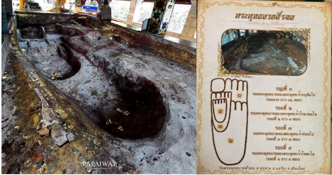
រូបលេខ៨