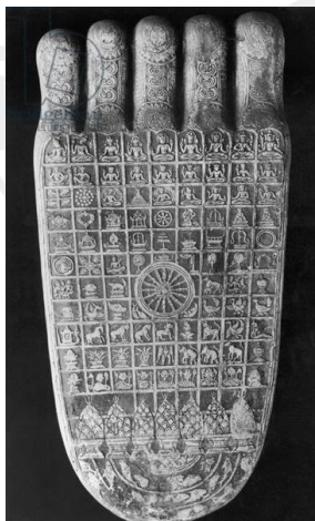
រូបលេខ៤ប្រភព៖