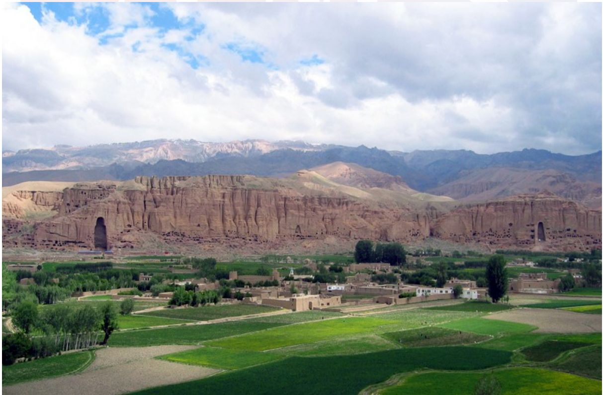
រូបលេខ២៖ ទិដ្ឋភាពទូទៅ នាពេលបច្ចុប្បន្ន