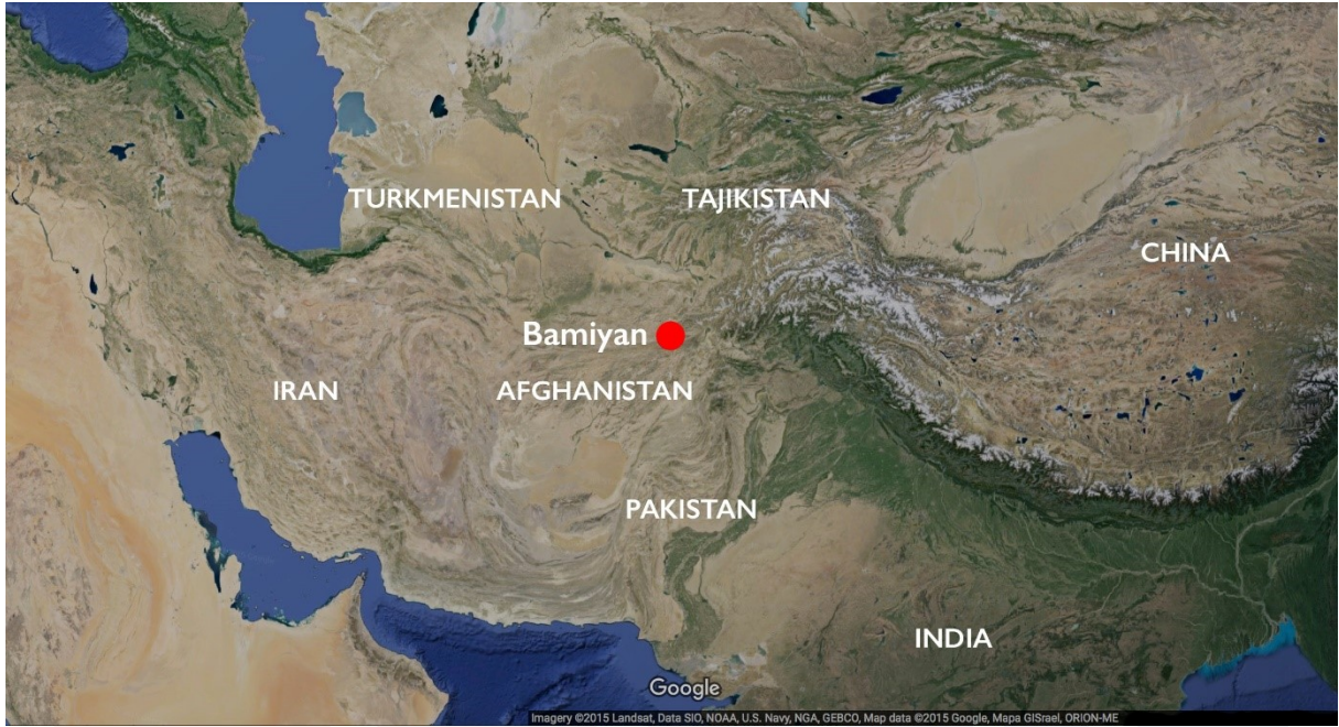
រូបលេខ១៖ ផែនទីនៃតំបន់វប្បធម៌ប៉ាមីយ៉ាន់