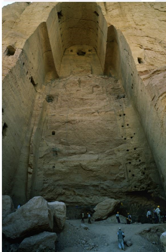
រូបលេខ៤ និង ៥ ៖ព្រះពុទ្ធរូបថតមុនពេលត្រូវបានបំផ្លាញ