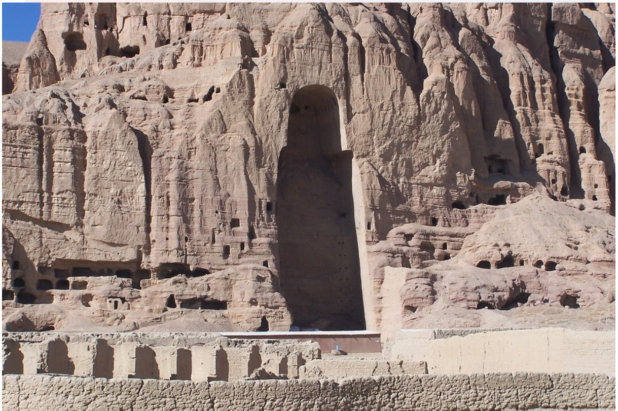
រូបលេខ៨ ៖ រូបចម្លុប្បន្ន អត្ថបទដោយ៖ អេង តុលា