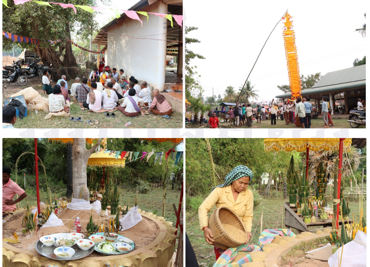
រូបលេខ៦-៧ កិច្ចប្រុងពាលី លើកទង់ ពូនភ្នំខ្សាច់ ភ្នំស្រូវក្នុងវេលារសៀលថ្ងៃសូត្រមន្តឡើងមាយភូមិបង្កោង

ដោយឡែក ផលត្រីដែលអ្នកភូមិរកបានពីត្រពាំងបឹងក្នុងមួយថ្ងៃនេះ គឺជាចំណែក រៀងៗខ្លួនសម្រាប់យកទៅធ្វើសម្លនំបញ្ចុក ឬចម្អិនហូបភ្លាមក្បែរមាត់ត្រពាំង។ ចំណែកឯ ត្រីដែលហ៊ុមចាប់នៅក្នុងសម្រាស់រួមគ្នាកណ្តាលត្រពាំង គឺរក្សាទុកសម្រាប់ធ្វើម្ហូបផ្គត់ផ្គង់ នៅពេលបុណ្យ ពោលគឺទាំងសម្រាប់ទទួលភ្ញៀវ និងជាចង្ហាន់ប្រគេនព្រះសង្ឃ។ ទន្ទឹមនឹង នេះដែរ ក្នុងថ្ងៃចាប់ត្រីគេក៏សង្កេតឃើញអ្នកភូមិមួយចំនួនទៀតនៅផ្ទះរៀបចំធ្វើនំបញ្ចុក ដែលជាអាហារលេចមុខជាងគេក្នុងពិធីឡើងមាយនៅភូមិបង្កោង។ 3 លុះស្តែកឡើងនៃថ្ងៃ បន្ទាប់ អ្នកភូមិចាប់ផ្តើមរៀបចំម្ហូបចំណី ចង្ហាន់ព្រះសង្ឃ និងគ្រឿងសក្ការៈ ព្រមទាំងស្រូវ រៀងៗខ្លួនយកទៅកាន់សាលាបុណ្យ។ នៅក្នុងបរិវេណសាលាបុណ្យគេតែងរៀបចំឱ្យមាន ភ្នំខ្សាច់ និងរានទិសទាំង៨។ លុះដល់វេលារសៀល គេដាក់ដង្ហាយបន្តិចបន្តួចនៅខ្ទម អ្នកតាចិន រួចទើបអាចារ្យចាប់ផ្តើមធ្វើកិច្ចប្រុងពាលី លើកទង់ បួងសួងសុំសេចក្តីសុខ ពូន ភ្នំខ្សាច់ ភ្នំស្រូវនៅត្រង់ដើមពោធិ៍ក្បែររាននិមរាជនៃទិសភ្នំសាន (រូបលេខ៦-៧)។