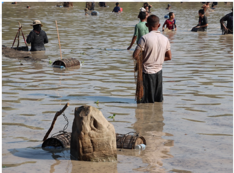
រូបលេខ៤ ខ្នងអ្នកតាចំននៅក្នុងភូមិ