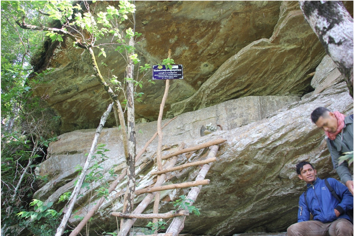
រូបលេខ៣ តំបន់ការពារបុរាណស្ថានរូងជំនាង