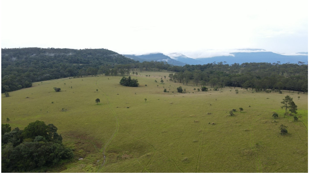
រូបលេខ៥ វាលស្មៅនៅខ្ពង់ក្រពើ