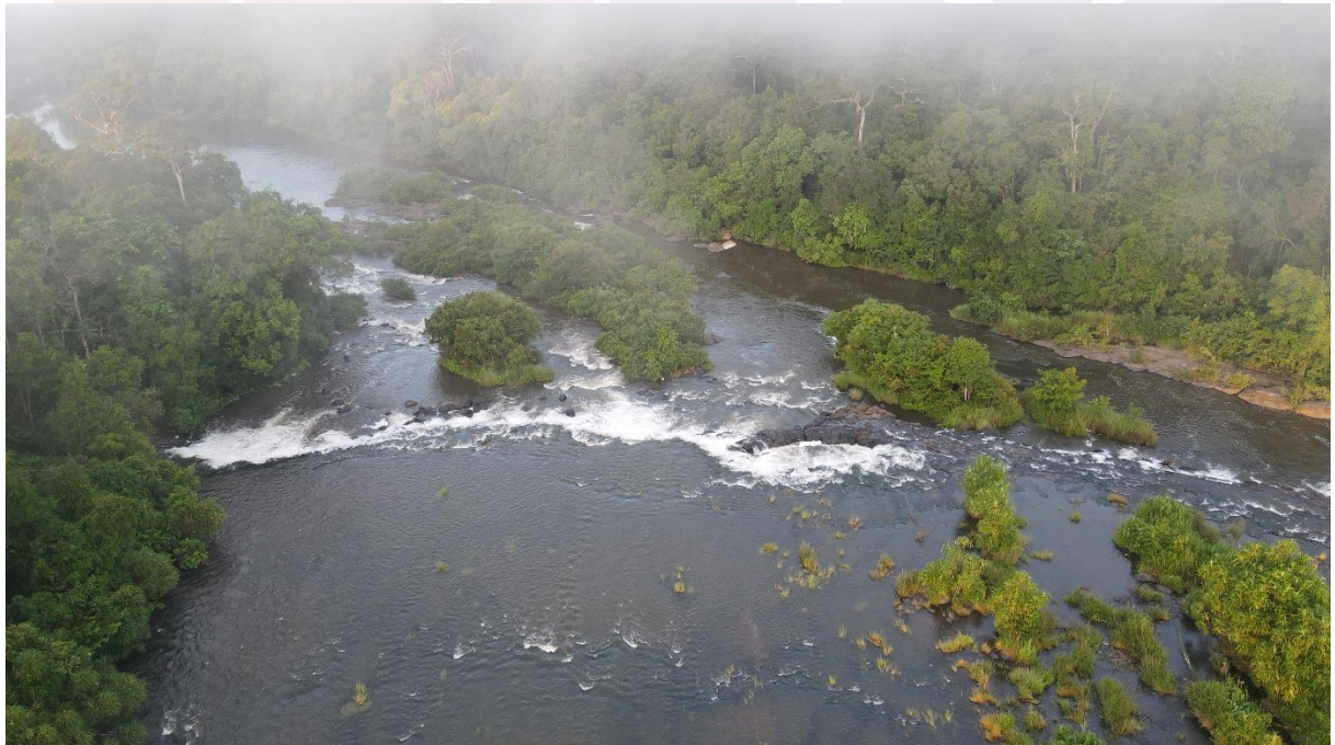
រូបលេខ២ ស្ទឹងអាវ៉ែង