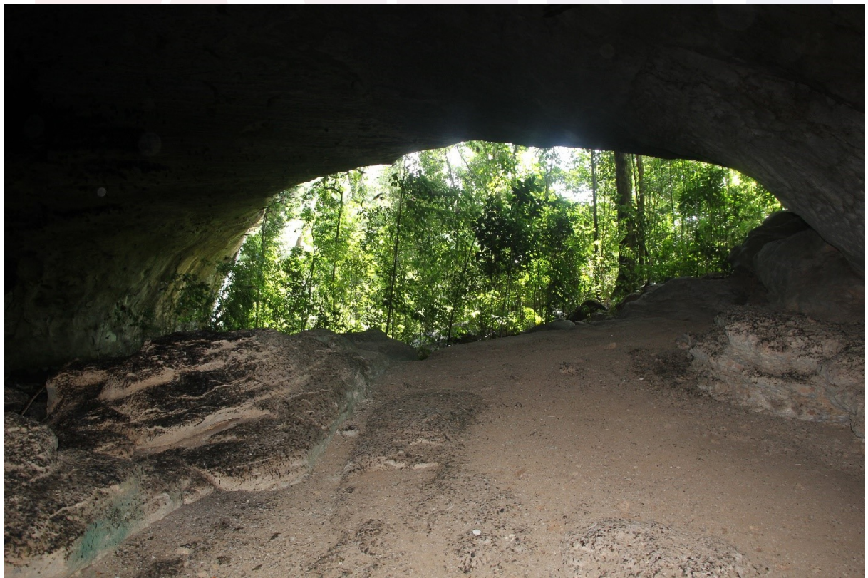
រូបលេខ៦ រូងជំនាងក្រោម ឬរូងខៀវ រូងក្រហម