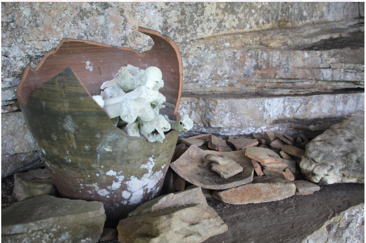
រូបលេខ៤ ពាងដាក់ឆ្អឹងនៅរូងជំនាងស.វទី១៥ ទី១៧គ.ស