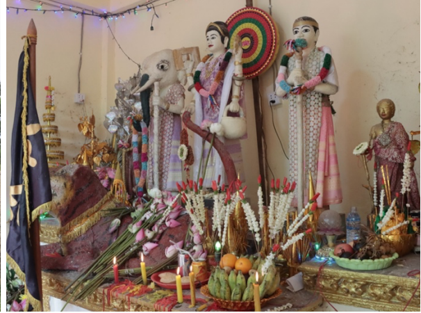
រូបលេខ១ កូនភ្នំអាស្រមអ្នកតាមេ-ស