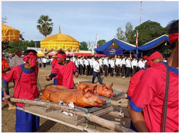
រូបលេខ៧ ជ្រូកដែលគេសម្លាប់ថ្វាយអ្នកតាម-ស ក្នុងពិធីបុណ្យកាលដើមឆ្នាំ២០០០