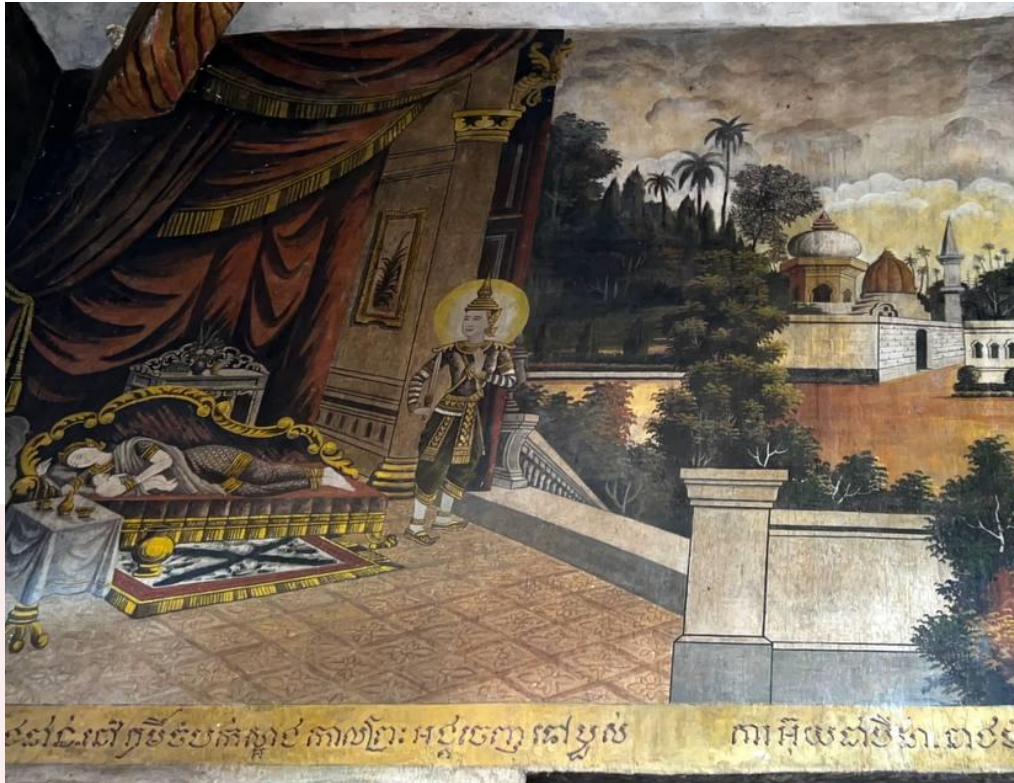
រូបលេខ៧ គំនូរវត្តបាគង

គំនូរវែងនេះចំពោះភ្នែកមនុស្សបច្ចុប្បន្នមើលហើយ បែរគិតថាហាក់ដូចជារឿងមិនសមរម្យ អាសអាភាស ធ្វើឱ្យអ្នកមើលហើយវិលវល់ក្នុងគំនិតស្រើបស្រាល លិចលង់ក្នុងចំណង់កាមគុណ។ ស្ថិតក្នុងគំនិតដដែលនេះវត្តមួយចំនួនបានកែគំនូរត្រង់វត្តនេះដោយគួរសំពត់អាវ គ្រប់ពីលើមនុស្សស្រីទាំងនោះ។ ចួនកាលកោសលុបកន្លែងនោះចោលតែម្តងដើម្បីកុំឱ្យឃើញរូបអាត្រាទាំងនោះតទៅទៀត(រូបលេខ៨ ស)។