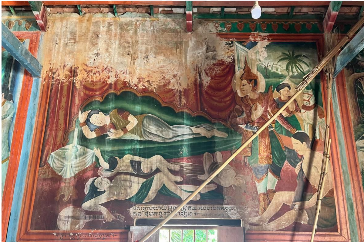
រូបលេខ៤ គំនូរវត្តស្វាយខ្សាច់ភ្នំ

ប្រសូតមកហើយ ព្រះទ័យរបស់ព្រះសិទ្ធត្ថកុមារក៏នឹកឡើយណាយក្នុងជីវិតជាយរវាស ហើយទ្រង់បានសម្រេចព្រះទ័យយាងចេញសាងព្រះផ្នួសក្នុងរាត្រីនោះតែម្តង។ ប៉ុន្តែមុន នឹងចេញពីព្រះបរមរាជវាំងទ្រង់ទតនាងពិម្ពា និងបុត្រដែលទើបនឹងប្រសូត ជាលើកចុង ក្រោយ។ នៅត្រង់នេះសិល្បៈគំនូរបានយកសេចក្តីនេះមកបរិយាយជារូបភាពបង្ហាញពី សភាពរបស់ពួកស្រីស្នំ ពួកស្រីរាំ ដែលច្រៀង លេងភ្លេង និងរាំថ្វាយព្រះសិទ្ធត្ថទត រួច ស្រីស្នំ ស្រីរាំបានដេកលង់លក់ដោយសភាពផ្សេង អ្នកខ្លះកាយអាក្រាត រហូតសំពត់ ហៀរទឹកមាត់។ ដើម្បីស្តែងឱ្យឃើញដូចគ្នាទៅនឹងដំណើររឿងក្នុងគម្ពីរគេត្រូវបង្ហាញដង ខ្លួនមនុស្សស្រីដេកអាក្រាតកាយ អ្នកខ្លះទៀតមានស្បែកស្តើងៗដណ្តប់ហើយចេញកេរ ខ្មាស ខ្លះទៀតមានស្បែកដណ្តប់ពីលើប៉ុន្តែបង្ហាញកេរខ្មាសជាហេតុៗ(រូបលេខ៤ដល់៧)។ ២