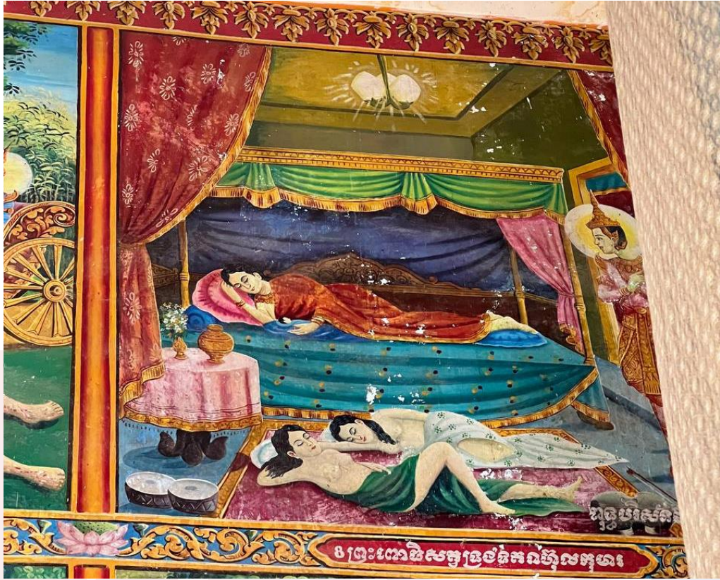
រូបលេខ៥ គំនូរវត្តតាំងរោម