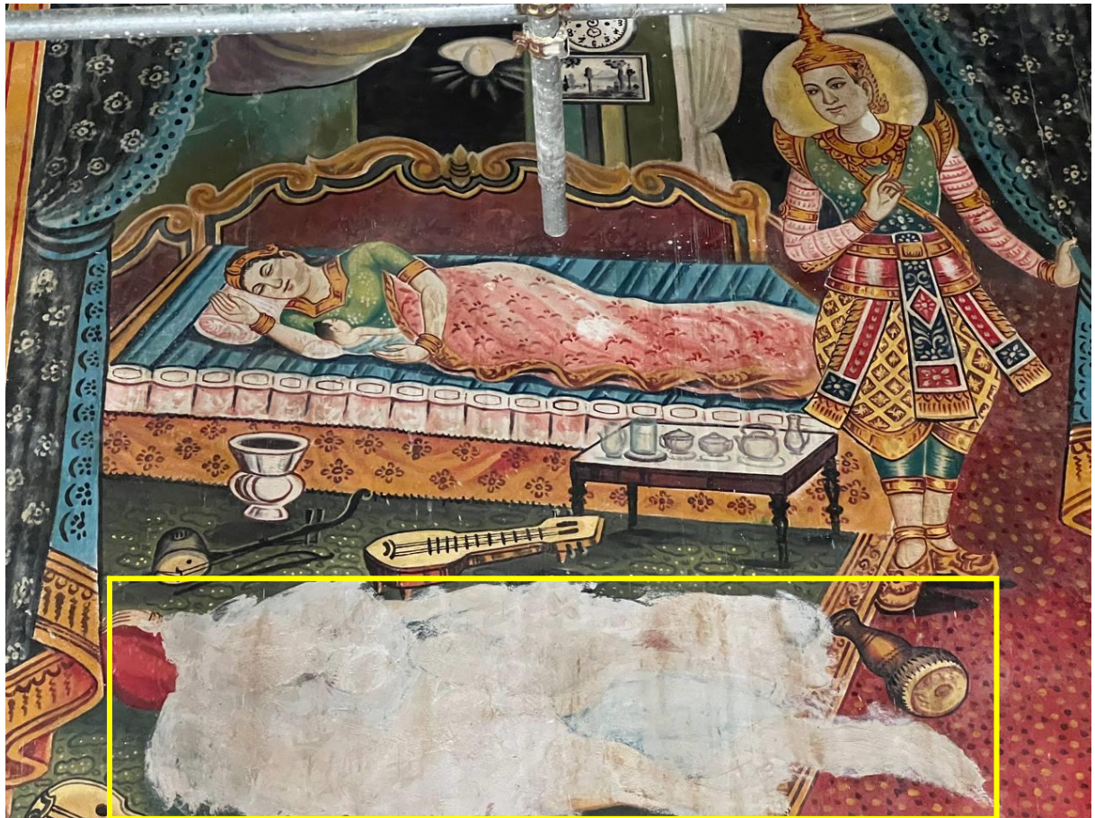
រូបលេខ៧៧ គំនូរវត្តបញ្ចកែវមុនី