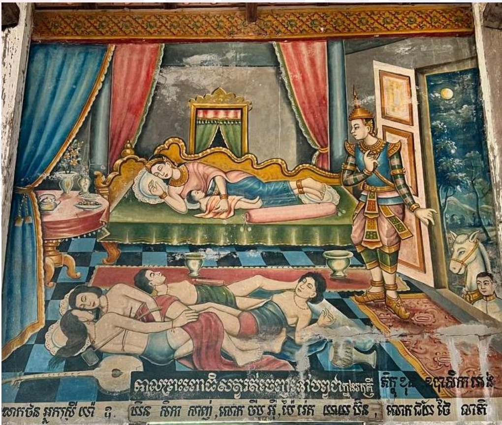
រូបលេខ៦ គំនូរវត្តសំរិទ្ធជ័យរាម