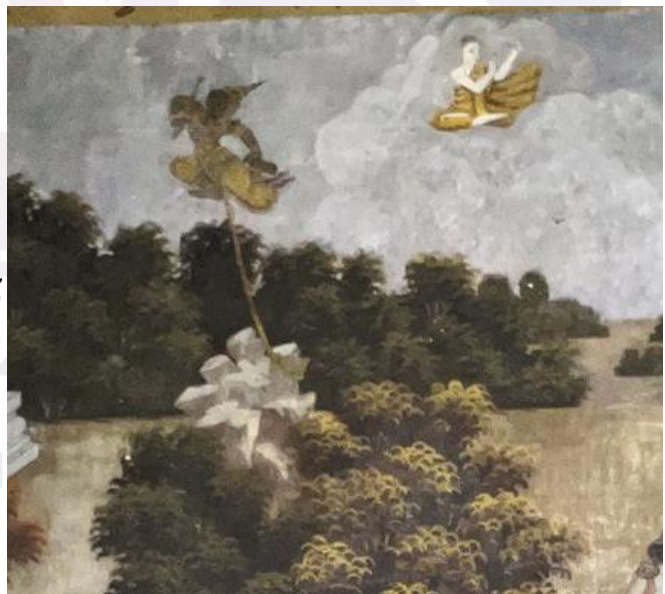
រូបលេខ៣ជាឈុតព្រះឧបគតត្ថេរមារ និមិត្តខ្លួនផ្ទាញ់មារដោយឧបាយផ្សេងៗរួច ក៏ចង់មាននឹងវត្តពន្ធជាប់នឹងភ្នំ។ នៅត្រង់ ឈុតនេះគឺជាប្រធានរឿងនៃកណ្តាមារព័ន្ធ ដែលខ្មែរនិយមហៅថាព្រះឧបគតចង់មារ