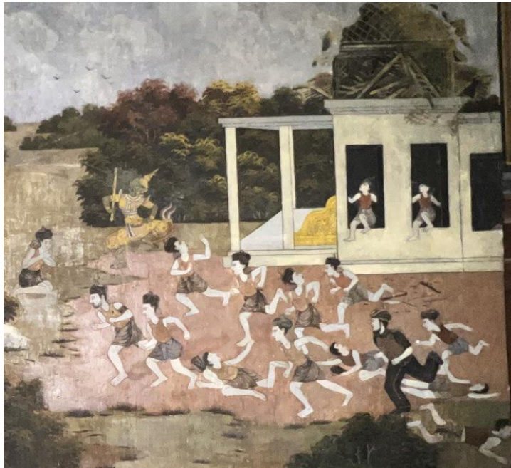
រូបលេខ២ ជាឈុតដែលមាន និមិត្តខ្លួនបង្កជាអន្តរាយយាយីដល់ អ្នកស្រុក និងបំផ្លាញបុណ្យឆ្នងរបស់ ព្រះបាទធម្មាសោក