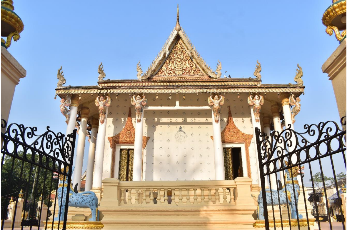
រូបលេខ២ រូបព្រះវិហារជ្រុងបូព៌ា