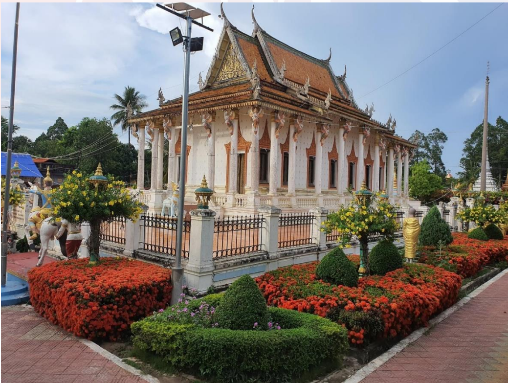
រូបលេខ១ រូបព្រះវិហារជ្រុងនិរតី

ព្រះវិហារជាកន្លែងចាំបាច់បំផុតផ្នែកជំនឿ សាសនាក្នុងសង្គមខ្មែរ។ ស្ថិតក្នុងបរិបទនេះហើយ បានជាវត្តនីមួយៗត្រូវតែមានព្រះវិហារជាដាច់ខាត ទោះបីជាមានទំហំតូច ឬធំ យ៉ាងណានោះ ក៏សំណង់ព្រះវិហារទាំងនោះកសាងឡើងដោយការខិតខំប្រឹងប្រែង និងយកចិត្តទុកដាក់យ៉ាងផ្ចិតផ្ចង់ពីសំណាក់មជ្ឈដ្ឋានបរិស័ទចំណុះជើងវត្ត និងម្ចាស់សទ្ធាដើម្បីឱ្យស័ក្តិសមជាទីកន្លែងគោរពសក្ការៈ។ យ៉ាងណាមិញចំពោះសំណង់ព្រះវិហារវត្តព្រះស៊ីសុវត្ថិរតនារាមហោរវត្តជ្រោយតាកែវ ១ ស្ថិតនៅភូមិ ជ្រោយតាកែវ ឃុំ ជ្រោយតាកែវ ស្រុកកោះធំ ខេត្តកណ្តាល ជាសំណង់វិហារបុរាណមួយនៅប្រប់មាត់ទន្លេដែលមានអាយុ ១១៨ឆ្នាំជាអារាមដ្ឋានអ្នកភូមិជ្រោយតាកែវតាំងពីដើមស.វ.ទី២០(រូបលេខ១១ដល់៥)។