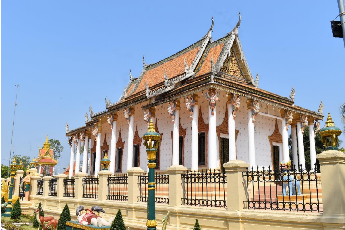
រូបលេខ២ រូបព្រះវិហារជ្រុងអាគ្នេយ៍