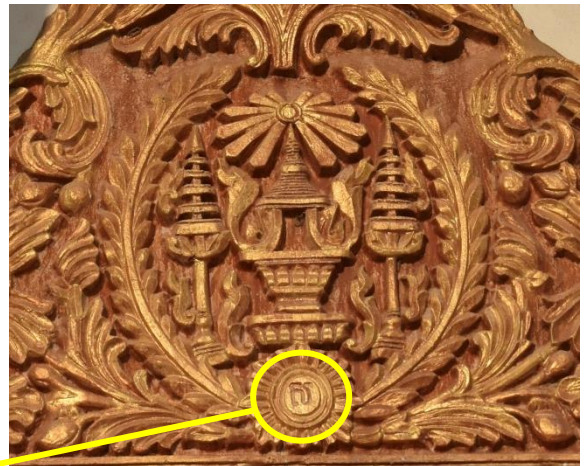
រូបលេខ៧ ៨ អត្ថបទដោយ៖ រឹម ទិត្យបញ្ញា