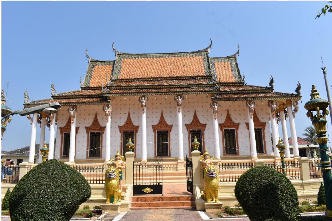
រូបលេខ៣ រូបព្រះវិហារជ្រុងទក្សិណ