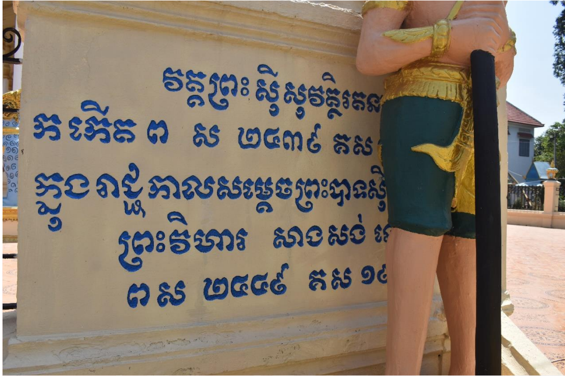
រូបលេខ៦ ច្រកចូលខាងបច្ចិម

ជាលក្ខណៈសម្គាល់ពិសេសមួយនៅក្នុងក្បាច់គោមប្រថាប់ចំកណ្តាលជញ្ជាំងខាងកើតមានរូបព្រះរាជសង្គ្រាហ័យក្នុងនោះមានអក្សរ ស នៅចំពីក្រោមជើងពាន។ លក្ខណៈដូចគ្នានេះផងដែរនៅលើក្បាច់ស៊ុមទ្វារខាងកើត ច្រកចូលខាងស្តាំ នៅក្នុងក្បាច់ស៊ុមទ្វារភ្លឺទេស នៅចំកណ្តាលផ្ទៃក្បាច់មានរូបព្រះសង្គ្រាហ័យនៅក្រោមជើងពានមានអក្សរ ស ជាទម្រង់អក្សរកាត់។ អក្សរ ស ជាអក្សរកាត់សម្គាល់ព្រះនាមព្រះមហាក្សត្រ ស មកពីពាក្យ Sisowath និង ស មកពីពាក្យ ស៊ីសុវត្ថិ(រូបលេខ៧ ដល់១០)។